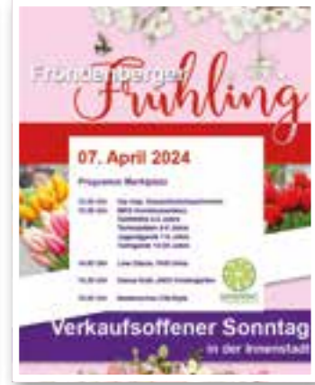
Fröndenberg Seite 10 Frühlingsmarkt