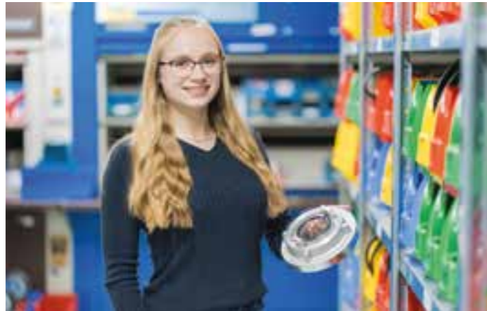
Kaufleute für Groß- und Außenhandelsmanagement sorgen für einen reibungslosen Warenfluss.

Der Technische Handel vereint mehr als 400 Betriebsstätten im deutschsprachigen Bereich. Die Technischen Händler versorgen Industrie, Gewerbe und Handwerk mit sämtlichem Bedarf, der für Produktion und Dienstleistungen erforderlich ist. Die Branche hält mehr als 1.000.000 Artikel bereit. Entsprechend vielseitig sind die Tätigkeiten an der Schnittstelle