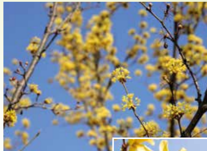
Die Kornelkirsche gehört zu den Frühblühern.

zen oder müssen einige umgesetzt werden?