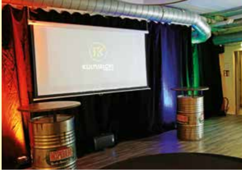
Kulturschaffende sind jeden ersten Montag im Monat herzlich eingeladen, das neue KulturLoft im Schalander zu besuchen, zu entdecken und sich auszutauschen.

Rolf kauft Wohnwagen/Wohnmobile auch renov.-bedürftig, ohne TÜV Tel. 0221/2 76 96 12 oder 0177/5 06 82 42 auch Sa./So. Rolf