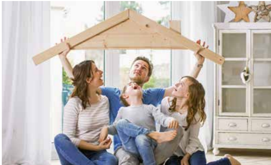
Kaufen oder mieten: Welche Variante die richtige ist, hängt zum einen von der individuellen Lebensplanung, zum anderen natürlich von der finanziellen Situation ab.

Die stetig steigenden Mietpreise stärken bei vielen Menschen den Wunsch nach mehr Freiheit und Unabhängigkeit in Form einer eigenen Immobilie. Immer wieder kommt dabei die grundlegende Frage auf: Mieten oder kaufen, was ist sinnvoller? Eine pauschale Antwort gibt es dabei nicht, denn beide Varianten haben ihre Vor- und Nachteile.