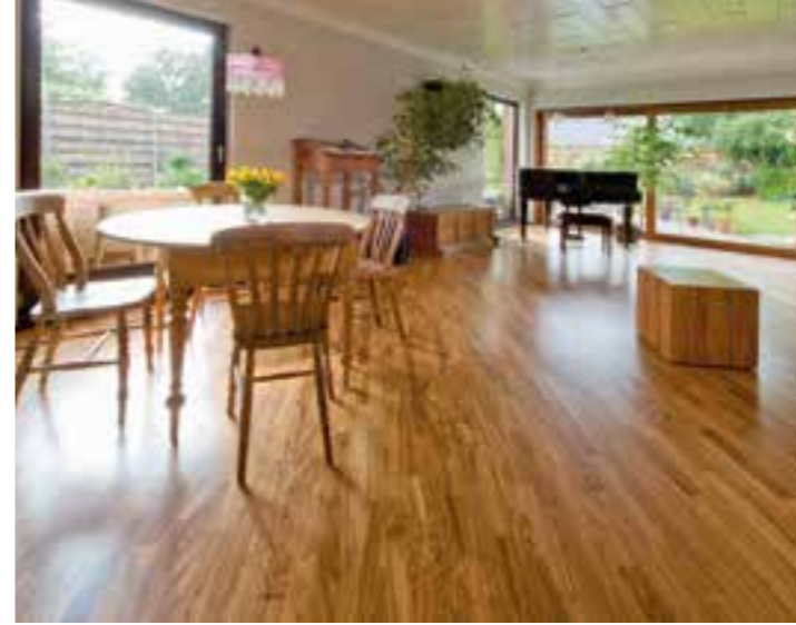
Bevor das hochwertige Olivenholz verlegt und auf ihm gespielt und getanzt wurde, hat es bereits mehrere hundert Jahre bewegter Geschichte in den toskanischen Olivenhainen erleben dürfen.