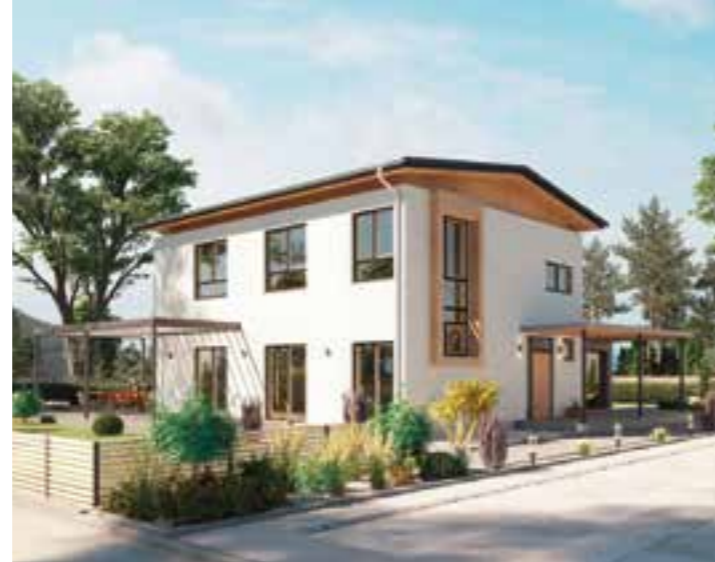
Bei diesem Fertighaus tragen die perfekt gedämmte Gebäudehülle, der Einsatz von regenerativen Energien sowie eine effiziente Wärmerückgewinnung dazu bei, dass das Klima entlastet wird.