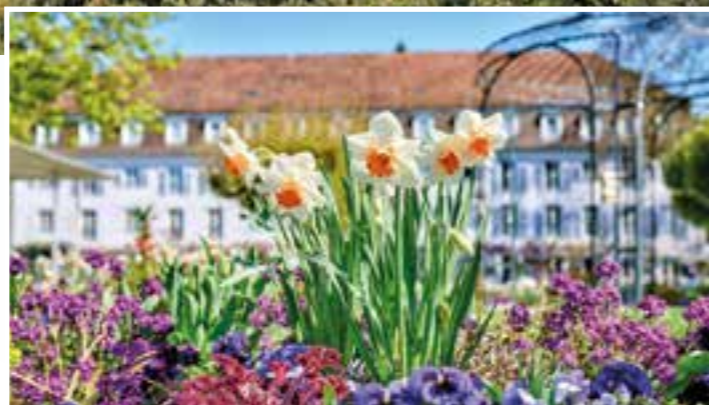
Die Schlösser und Parks am Bodensee öffnen im Frühling ihre Tore und laden zum Entdecken ein.

Urlaub an Pfingsten, das bedeutet verreisen zu einer der angenehmsten Zeiten. Genießen Sie schon vor den Sommerferien einen tollen Urlaub für die ganze Familie an den verschiedensten Reisezielen. In diesem Jahr gibt's nur einen Tag zusätzlich frei, sodass das lange Wochenende von Samstag bis Dienstag, 18. bis 21. Mai, geht.