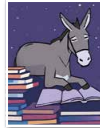
Story des Monats Seite 4 "Leseesel e. V."