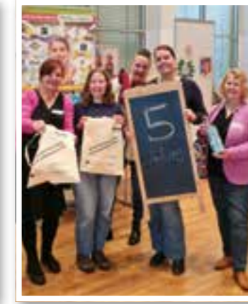
Kamen Seite 8 5. Jahre "Bündnis gegen Plastik"