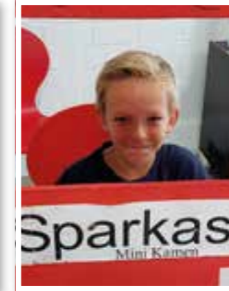
Kamen Seite 7 Ferienangebote