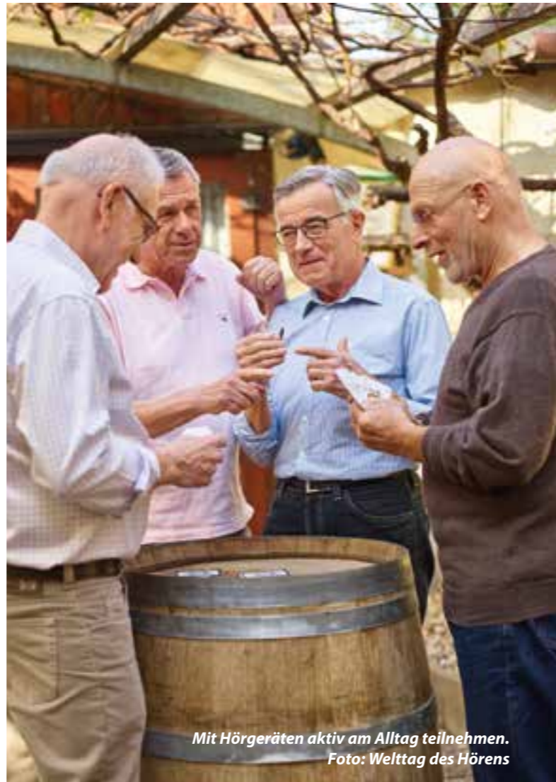
Mit Hörgeräten aktiv am Alltag teilnehmen.

Ebenso wichtig wie ein gutes Gehör ist die Sehkraft, die man regelmäßig überprüfen sollte. Tragen Sie bereits eine Brille? Auch in diesem Fall lohnt ein Sehtest von Zeit zu Zeit, da sich die Sehstärke im Laufe des Lebens verändert. Zudem ist es hilfreich, wenn der Augenarzt