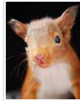
Story des Monats Seite 4 Aktion Eichhörnchen e.V.

Termine Veranstaltungen in der Region 27