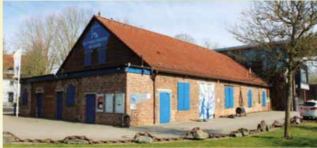
Kettenschmiedemuseum Fröndenberg.

Wenn sich die ersten Narzissen, Tulpen und Krokusse zeigen, dann ist Frühling! In der neuen Jahreszeit beginnt auch die „Draußen-Zeit“. Nun ist die Gelegenheit für Familientreffen, Ausflüge oder Kurzurlaube. Bei schönem Wetter locken nicht nur Frühlingsmärkte, Parks, Zoos und Tierparks oder in der Osterzeit das traditionelle Osterfeuer in den Abendstunden. Auch hier im Kreis Unna laden viele Gastronomiebetriebe und Sehenswürdigkeiten zum Frühlingsausflug ein.