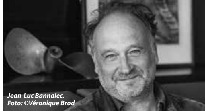
Jean-Luc Bannalec.