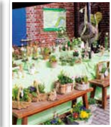
Fröndenberg Seite 10 Frühlingsmarkt