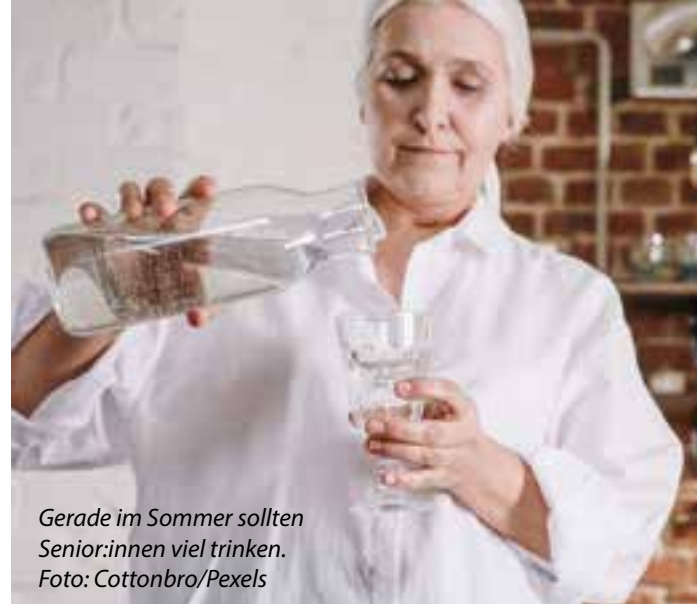
Gerade im Sommer sollten Senior:innen viel trinken.

Draußen schützen Ein guter Sonnenschutz ist bei der hohen UV-Belastung Pflicht und so sollten Sie nie ohne entsprechende Sonnencreme aus dem Haus gehen. Für das Gesicht gibt es ja auch mittlerweile tolle Anti-Age-Sonnenprodukte, die nicht nur schützen, sondern auch reife Haut besonders gut pflegen. Zudem ist eine Kopfbedeckung hilfreich – vom Basecap über den Strohhut bis hin ist der Kopfputz nicht nur ein Schattenspender, sondern zugleich ein hübsches Accessoire. Denken Sie auch daran, sich luftig zu kleiden. Vor allem Materialien wie Leinen sind im Sommer sehr angenehm zu