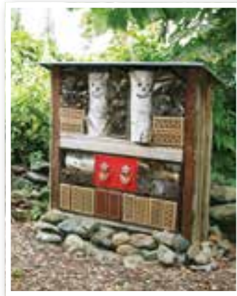
Bergkamen Seite 4 Glück im Kleingarten