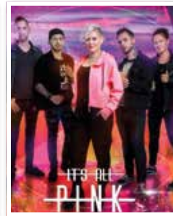
Unna Seite 7 Unna Rockt!