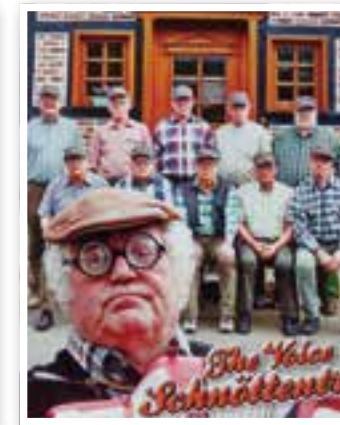
Frödenberg Seite 15 „The Voice of Schnöttentrop“