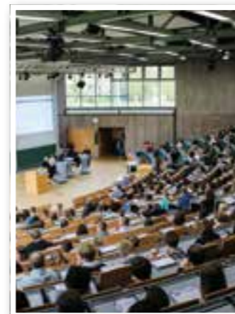
Story des Monats Seite 4 Studieren in der Krise