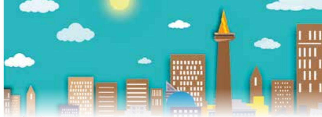
Illustration: Banjarmasin Kalsel

Mitte September wird eine Jury die Vorgärten nach bestimmten Kriterien bewerten, wie zum Beispiel der beste Wandel von grau zu bunt oder wo sich die Insekten am wohlsten fühlen. Als Nachbarschaftsprojekt bietet der Wettbewerb darüber hinaus noch die Möglichkeit, nachbarschaftliche Beziehungen zu beleben. Aber Hauptsache ist, dass die Stadt schöner und bunter werden soll! Als Preise winken ein 100 Euro-Gutschein vom Drücke-Garten-Zentrum Unna (1. Platz), eine Felco Gartenschere (2. Platz) und ein Gartenbuch (3. Platz). Auch wenn nicht jeder den ersten Preis erhalten kann, steht für die GRÜNEN fest: Mit vielen schönen Vorgärten in Unna gibt es ohnehin viele Gewinner! Weitere Infos: www.gruene-unna.de/vorgartenschoen