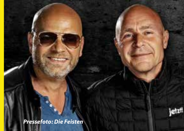
Pressefoto: Die Feisten