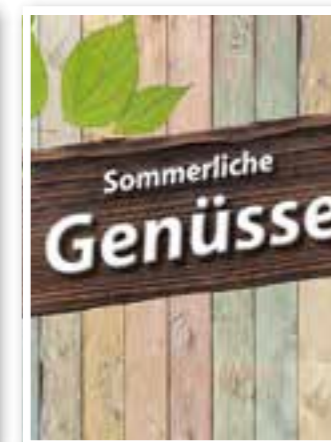
Kreis Unna Seite 13 Gastronomie-Spezial