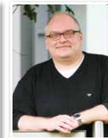
Unna Seite 37 Lehrer des Jahres