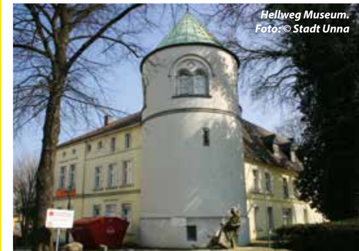
Hellweg Museum.

Durch die Verlängerung der Sonderausstellung „ Der Unnaer Künstlerkreis. Stadt und Kunst zwischen 1945 und 1970 “ bis zum 15. August kann das Museum nun für einige der ausgefallenen Veranstaltungen Nachholtermine anbieten.