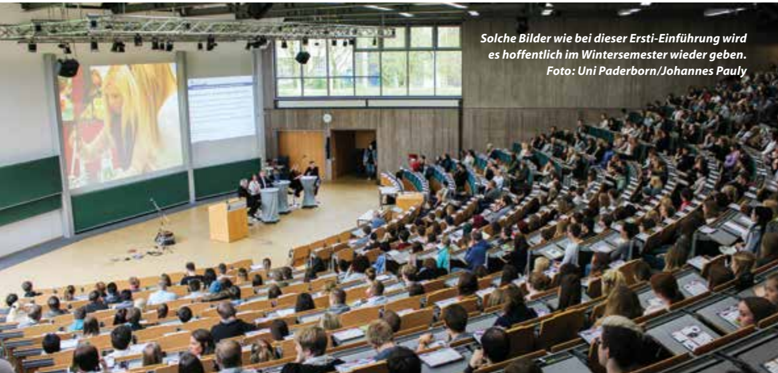
Solche Bilder wie bei dieser Ersti-Einführung wird es hoffentlich im Wintersemester wieder geben.

Studienstart: Wegen Corona gewiss kein Zuckerschlecken