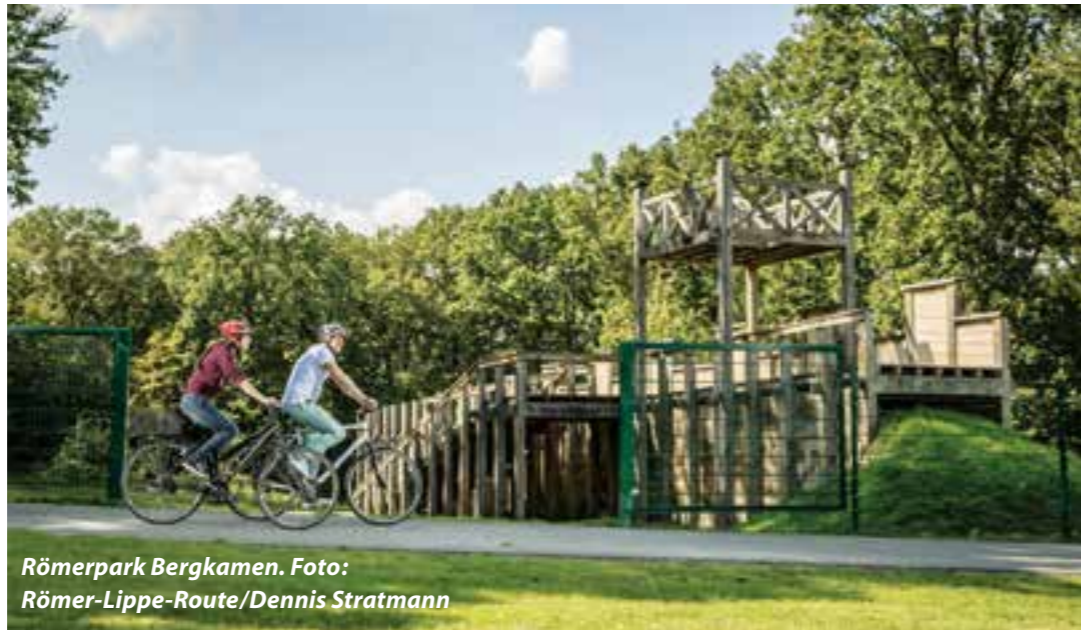
Römerpark Bergkamen.

Der Sommer ist da und auch die Sommerferien stehen vor der Tür. Und zum Glück entspannt sich aktuell die pandemische Lage. Die Inzidenzen sind bundesweit niedrig und so fährt auch das öffentliche Leben wieder hoch. Wer keine große Urlaubsreise geplant hat, kann jetzt die eigene sowie die Nachbarregionen mit Tagesausflügen, einem Wochenendtrip oder einem Kurzurlaub erkunden. Wir geben Ihnen hier ein paar Tipps.