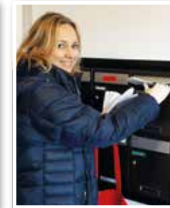
Senioren Seite 22 Corona-Hilfe