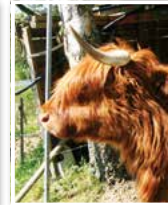
Fröndenberg Seite 18 Unerwünschte Oase