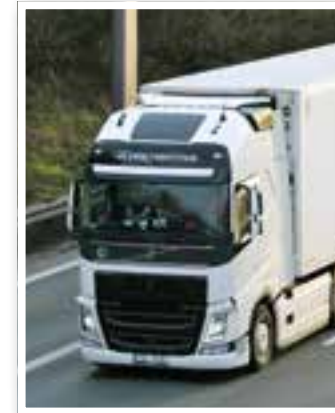
Story des Monats Seite 4 Mit dem Brummi unterwegs