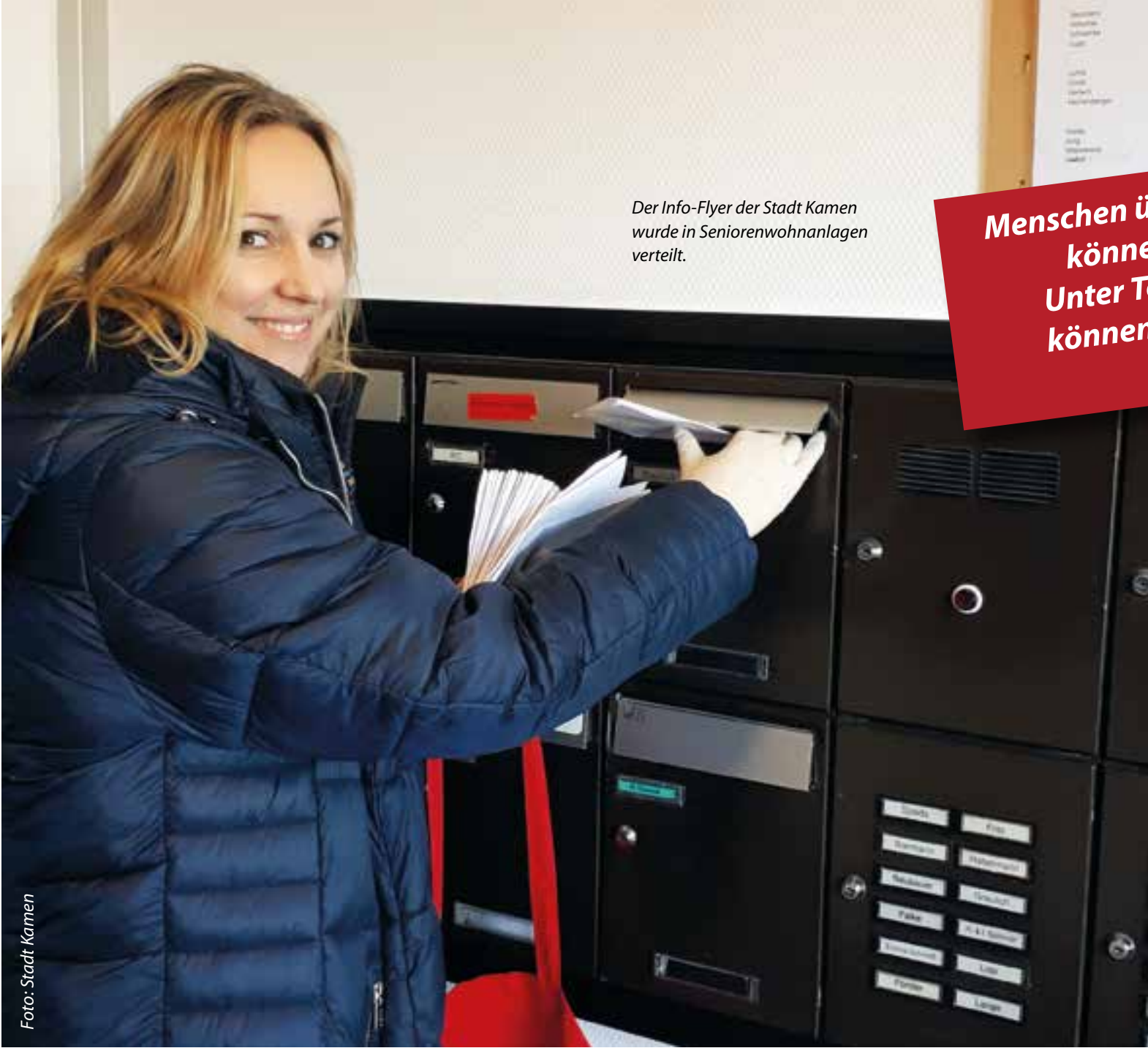
Der Info-Flyer der Stadt Kamen wurde in Seniorenwohnanlagen verteilt.