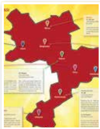
Story des Monats Seite 4 Open-Airs im Kreis