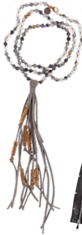
Schmuck: Ulla Popken