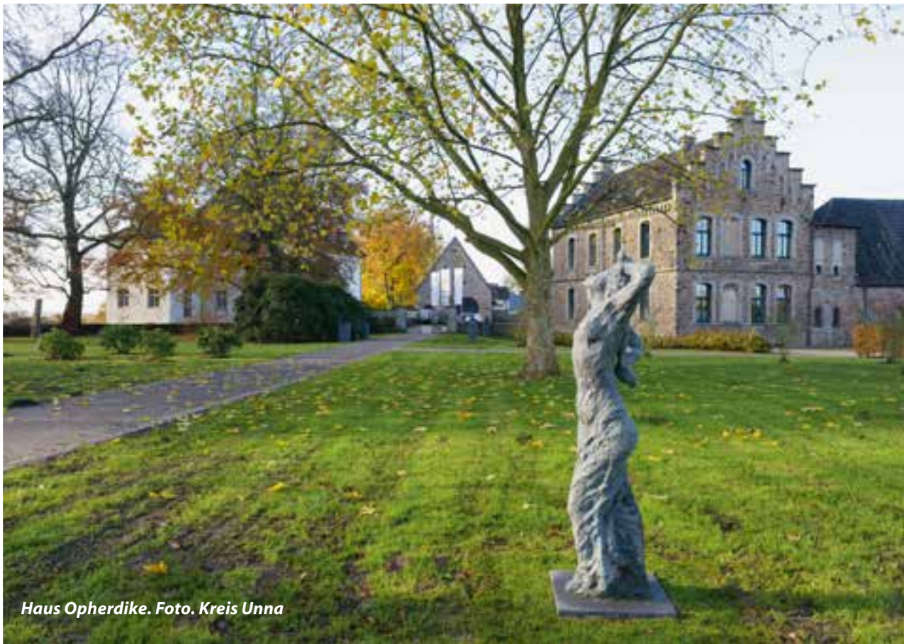
Haus Opherdike.

Statt in die Ferne schweifen, schöne Ziele vor Ort genießen