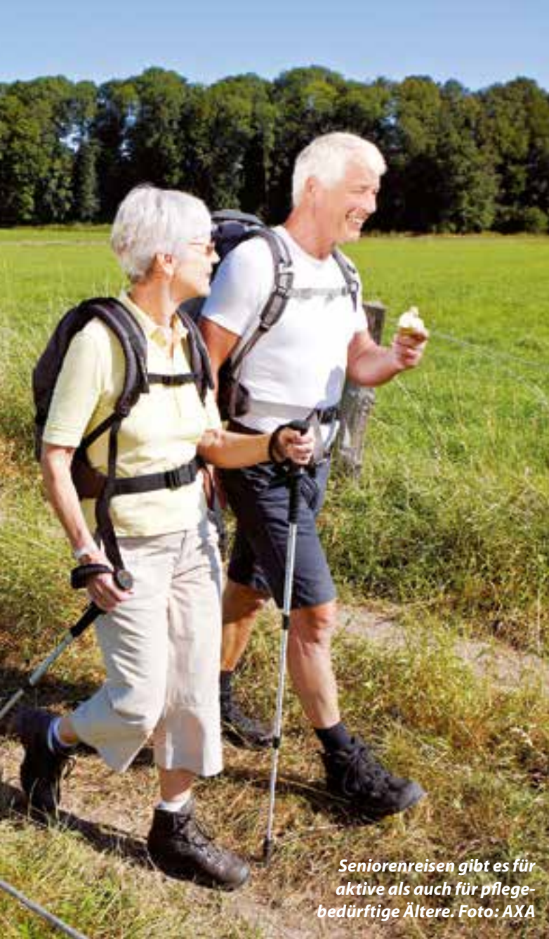
Seniorenreisen gibt es für aktive als auch für pflegebedürftige Ältere.

möglichkeiten, denn es können oftmals Zuschüsse durch die Pflegekasse beantragt werden. Solch einen Service bieten nur Reiseveranstalter, die sich auf Pflegebedürftige spezialisiert haben.