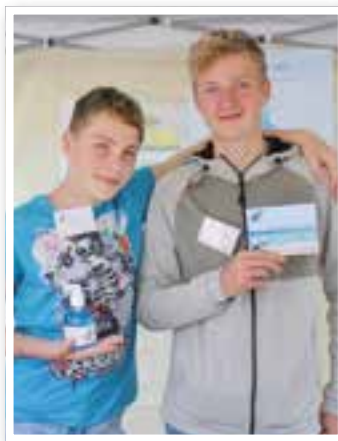
Kamen Seite 34 Schüler werden Unternehmer