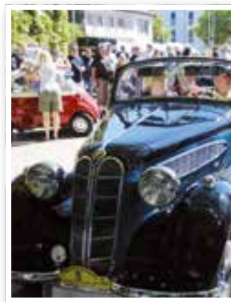
Holzwickede Seite 40 10. „Haarstrang Klassik“