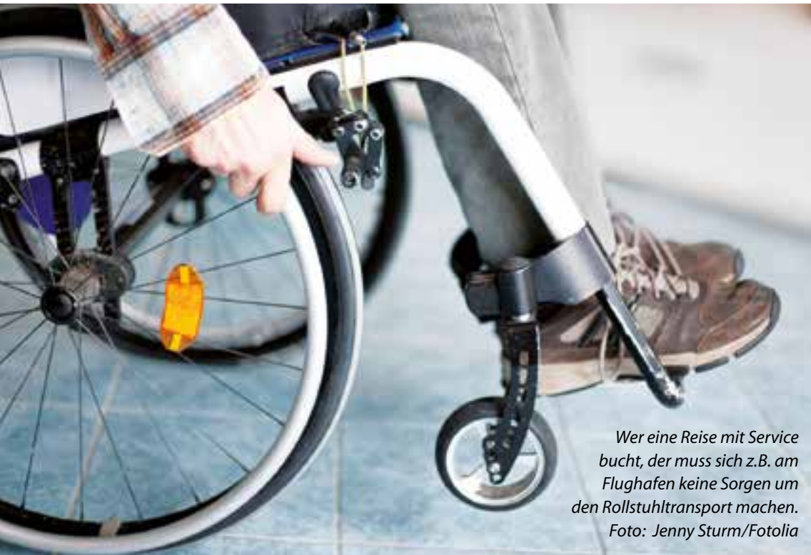
Wer eine Reise mit Service bucht, der muss sich z.B. am Flughafen keine Sorgen um den Rollstuhltransport machen.