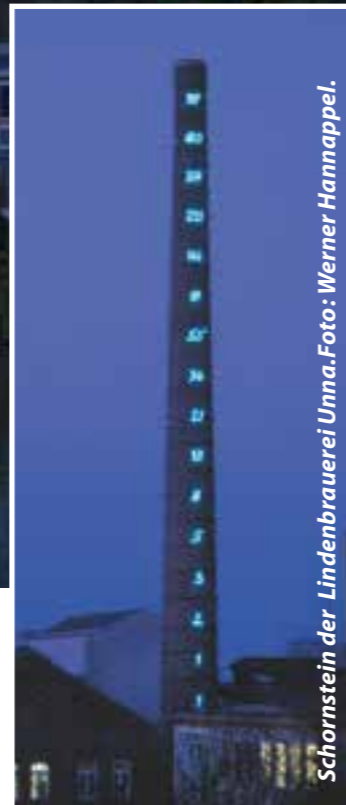
Schornstein der Lindenbrauerei Unna.

Das vor Ort angebotene Kunstprogramm wird um eine weitere künstlerische Arbeit ergänzt, die die Besucherinnen und Besucher partizipatorisch einbeziehen wird. „Lichterlebnisse“ können bei einem Lindenberg oder einem anderen Kaltgetränk in besonderer Atmosphäre ausgetauscht werden. Eine Dämmerungsführung in den „Skyspace“ rundet das Programm in Unna ab. Während der Sonnenuntergangsstunde ist im Skyspace des „Third Breath 2005/2009“ von James Turrell ein farbenprächtiges Lichtspiel von einzigartiger Schönheit zu bewundern.