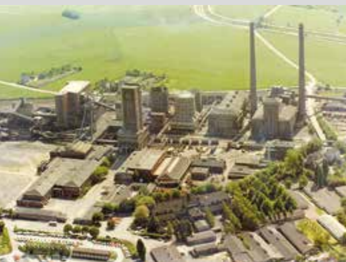
Zechenanlage Königsborn in Bönen, Schacht III/IV, Luftbildaufnahme, ohne Datum.