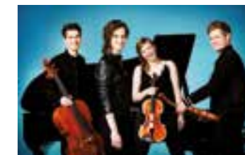
Notos Quartett