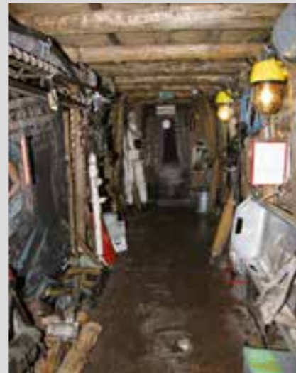
Der „Barbara-Stollen“ im Stadtmuseum Bergkamen.