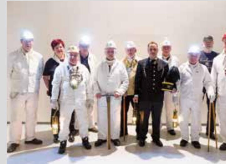
Die Mitglieder des Geschichtskreises Haus Aden/Grimberg 3/4 sind im ganzen Land mit ihrem mobilen Stollen unterwegs.