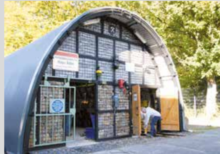
Der Lehrstollen in Bergkamen ist die jüngste Attraktion in punkto Bergbau im Kreis Unna.