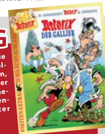
ASTERIX®-OBELIX®-IDEFIX®/©2018 LES EDITIONS ALBERT RENE/ GOSCINNY- UDERZO

Mit etwas Glück sind auch Sie bald stolzer Besitzer einer solchen Softcover-Sonderedition, machen Sie einfach bei unserer Verlosung mit! Die Teilnahmebedingungen und den Einsendeschluss finden Sie unter www.fkw.de . Viel Glück!