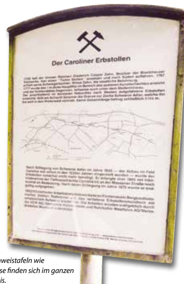
Hinweistafeln wie diese finden sich im ganzen Kreis.

hoffen, dass dank der Ehrenämter aus unseren Zechen dieses wichtige Stück Ruhrpott-Kultur auch nach dem offiziellen Ende des Steinkohle-Bergbaus erhalten bleibt. Und Nachwuchs ist bei den Vereinen auch ohne Erfahrungen unter Tage gern gesehen. Glück auf!