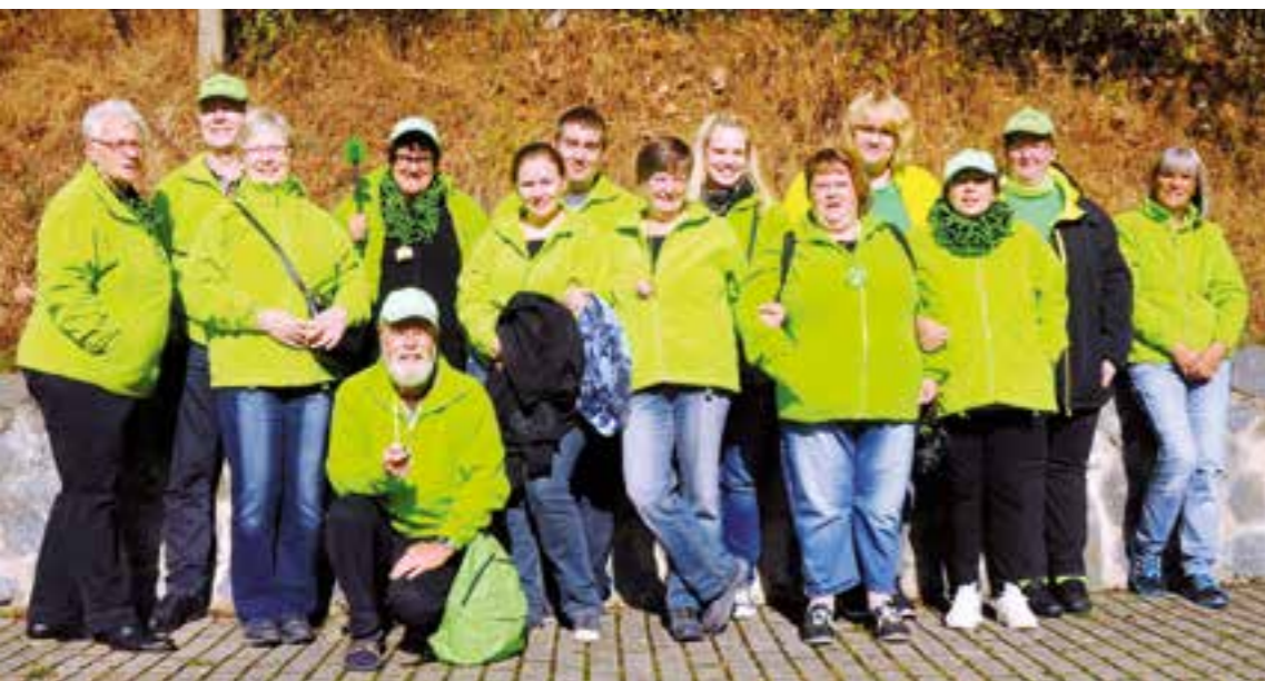
Die Mitglieder des Freizeitkreises geben sich bei Ausflügen gern in den Vereinsfarben Grün und Schwarz zu erkennen.

Spaß, Sport und Spiel beim Freizeitkreis