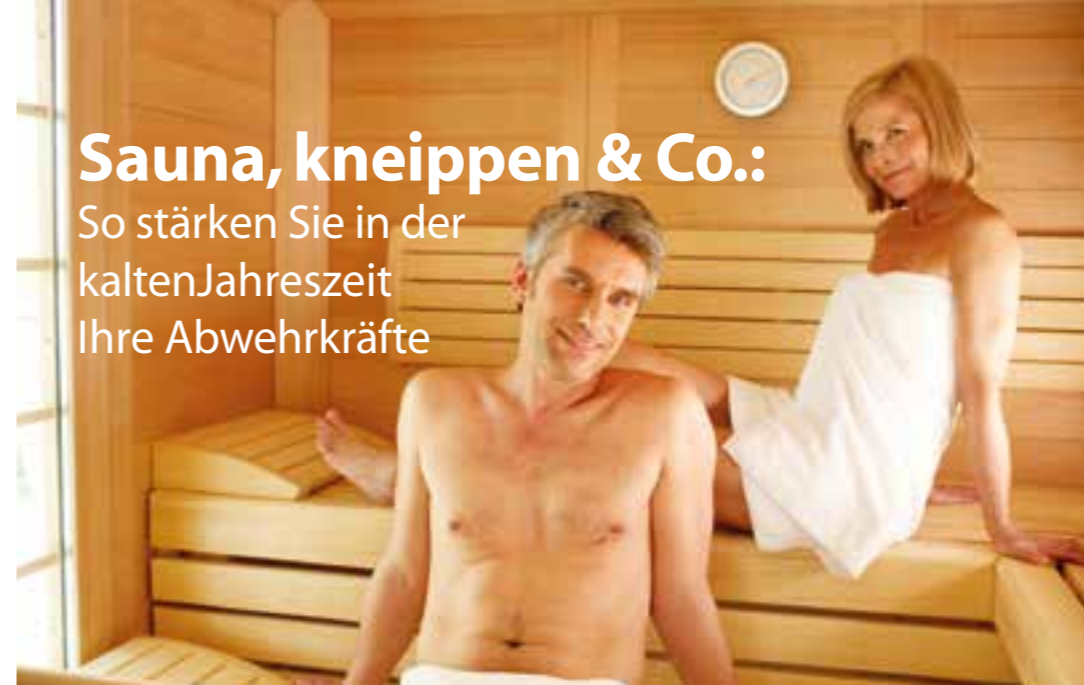
Saunagänger leben angeblich länger. Also nichts wie hin!

Wenn die Grippezeit langsam Fahrt aufnimmt, versuchen viele, ihr Immunsystem auf Trab zu bringen. Dazu gibt es eine Menge an Hausmitteln aber auch natürliche Helfer und die aus der Apotheke.