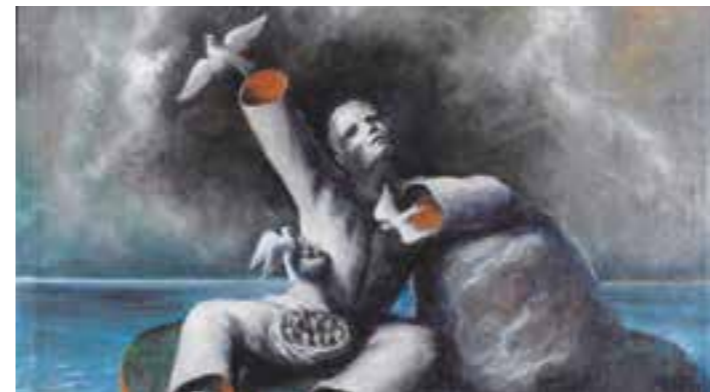
Edgar Ende, „De Profundis“, 1951, Öl auf Leinwand, 60 x 80,3 cm, Privatsammlung

Nach der farbenfrohen Werk-schau von Otmar Alt geht es nun düsterer zu auf Haus Opherdicke: Bis zum 24. Februar 2019 sind dort die Bilder des Malers und Grafikers Edgar Ende zu sehen.