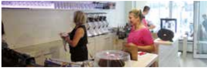
Das „Mio Tesoro“: Hell, modern und mit Platz für 16 Gäste.

Bio-Produkte und Kaffee-Spezialitäten der Innenstadt