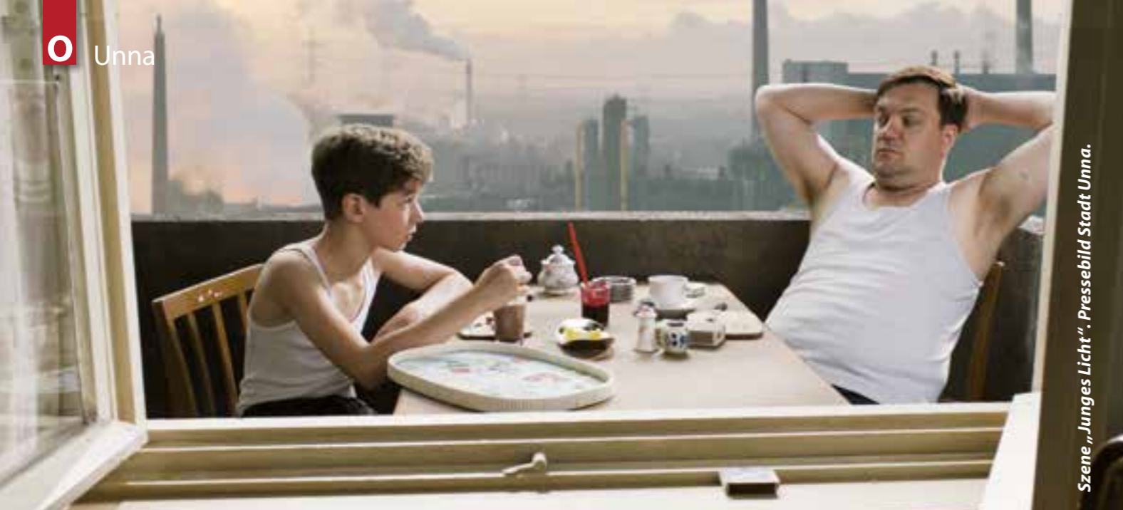
Szene „Junges Licht“.