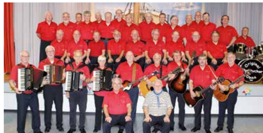
Unterstützen das Heilig-Geist-Hospiz: Die Sänger vom Shantychor Unna e.V.

Ein Hospiz geht uns alle an! Das ist nicht nur die Meinung der Ev. Kirchengemeinde, sondern auch die des Shantychores Unna. Leider können die Kostenträger des Hospizes ihre Einrichtung nicht voll finanzieren und somit ist diese auf Unterstützung durch Spenden angewiesen. Einen Teil davon möchten Kirche und Chor gemeinsam am 28. Oktober sammeln. Die Besucher erwartet an diesem Nachmittag nach der maritimen Andacht ein buntes Gesangsprogramm mit Shanties und Seasons – den Arbeits- und Freizeitliedern