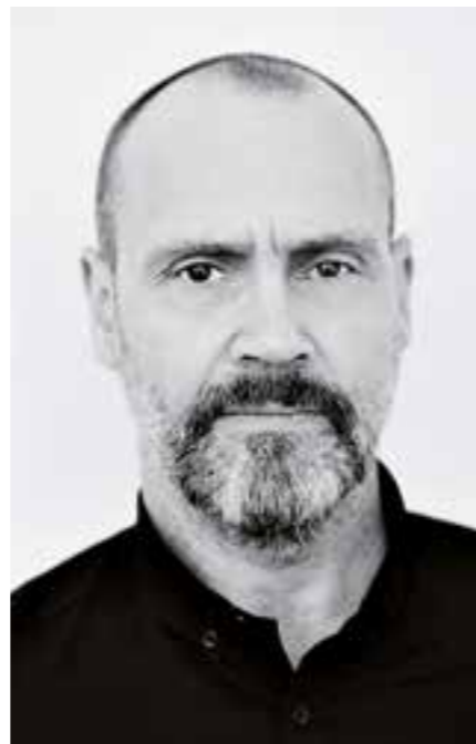
Simon Beckett

In Unna und den Nachbarkreisen wird aktuell wieder hemmungslos gemordet, denn „Mord am Hellweg“ (MaH) – Europas größtes Krimifestival - ist voll im Gange. Krimifans können sich auf fast 200 Lesungen von Newcomern und Stars der Szene freuen. Aber damit nicht genug: Im Rahmen des Festivals 2018/19 wird bereits zum sechsten Mal der Europäische Preis für Kriminalliteratur – der RIPPER AWARD – verliehen. Und dabei sind auch Sie gefragt!