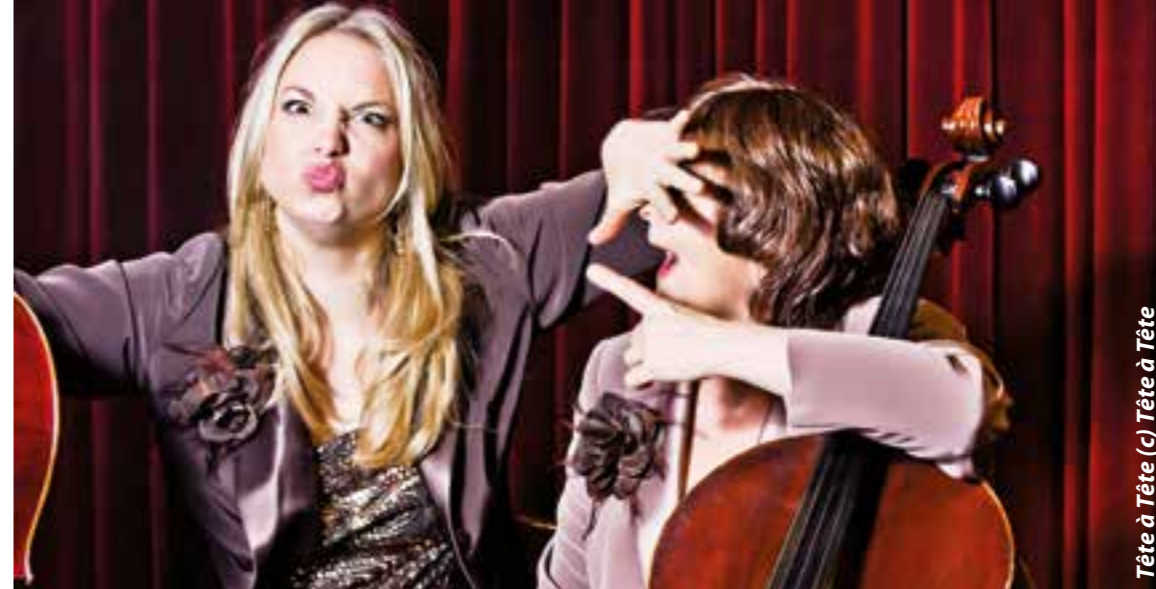
Tête à Tête