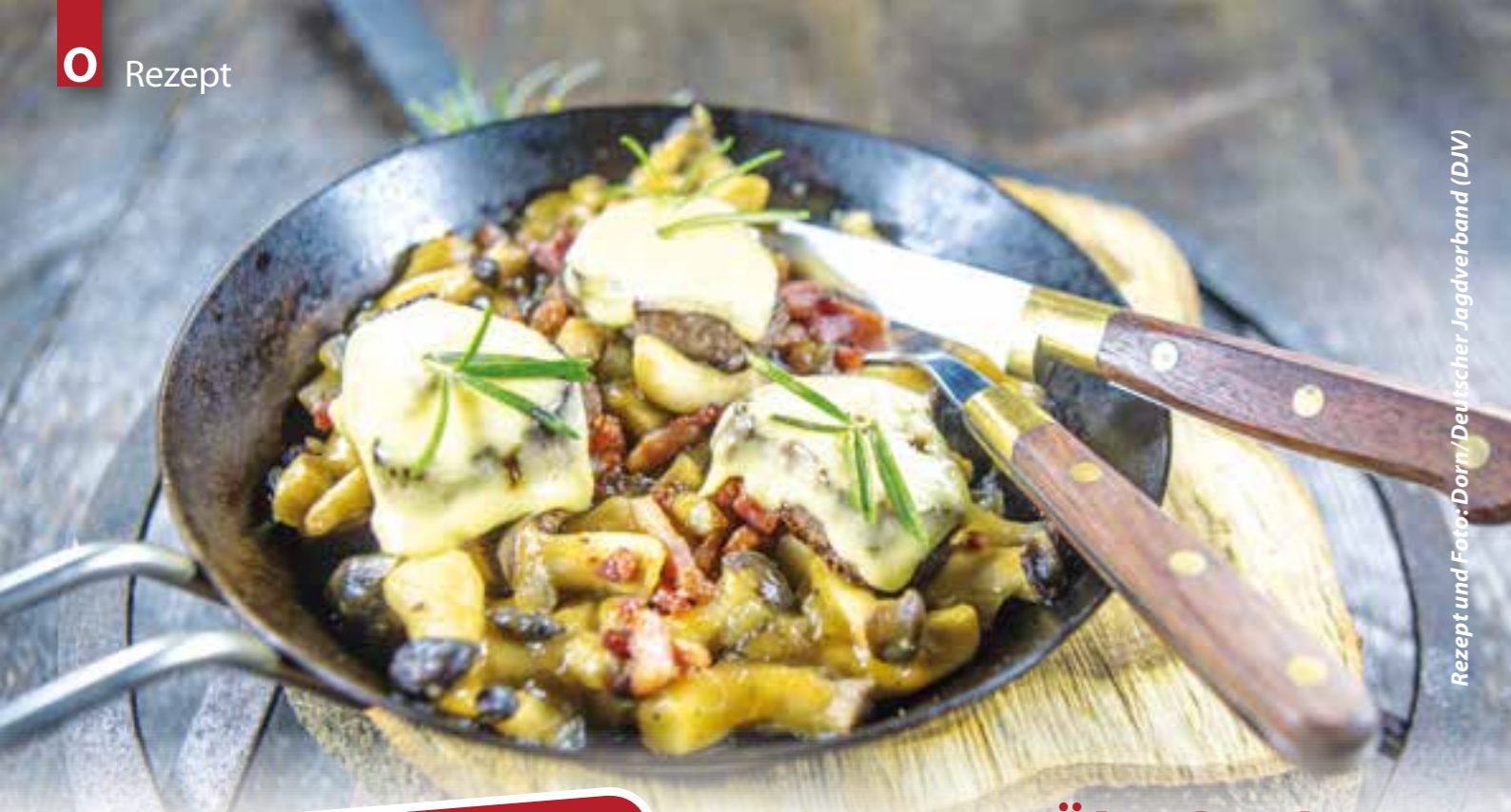
Rezept und Foto: Dorn/Deutscher Jagdverband (DJV)

Tipp: Wildbret-Anbieter in Ihrer Nähe finden Sie bequem via PLZ-Suche auf der Website www.wild-auf-wild.de