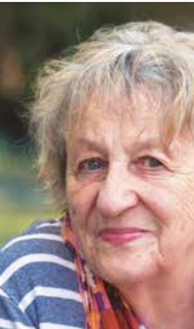
Ingrid Noll