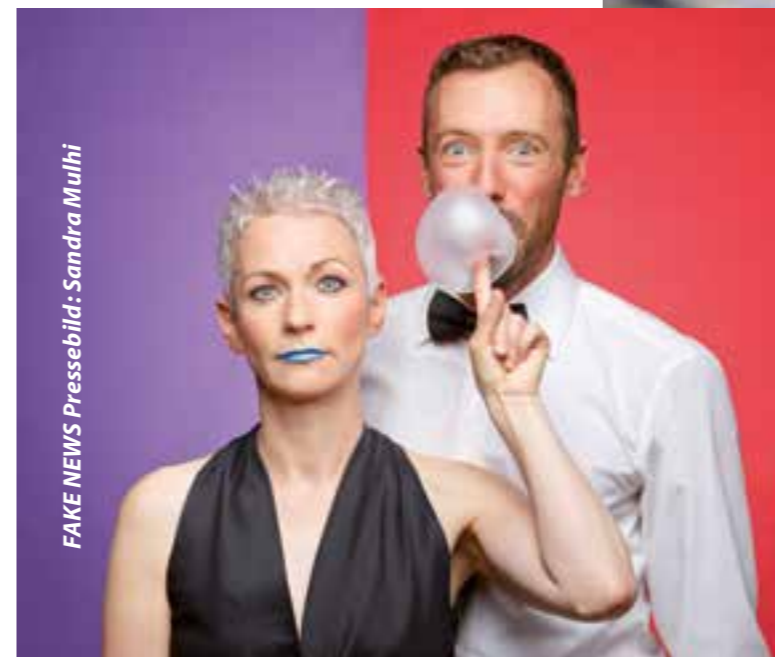
FAKE NEWS