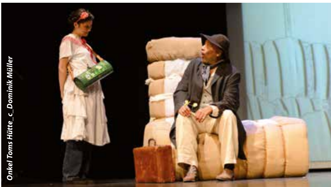
Onkel Toms Hütte

Im Oktober startet die Theatersaison 2018/19 in der Stadthalle