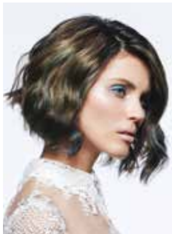
Kurz-Bob mit Highlights