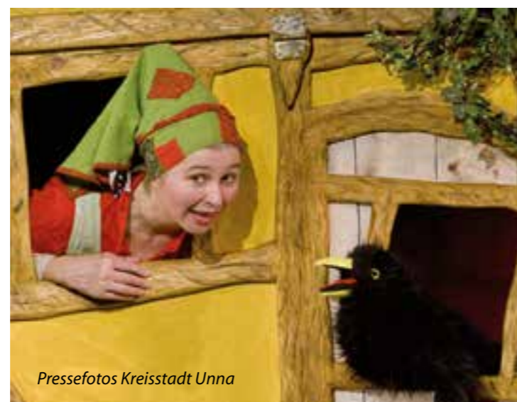
Pressefotos Kreisstadt Unna

Weitere Infos erhalten Sie im pinken Programmheft, das an vielen öffentlichen Orten in Unna ausliegt. Es kann zudem bei der Stadt Unna, Bereich Kultur, angefordert oder von der Homepage www.unna.de heruntergeladen werden. Karten für die Stücke gibt's im i-Punkt zum Preis von 5 Euro für Kinder und 5,50 Euro für Er-