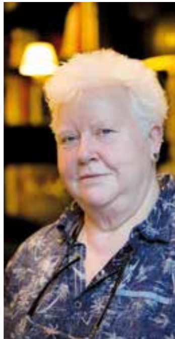
Val McDermid