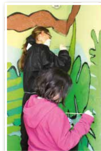
Titel Seite 4 Dschungel-Graffiti in Unna