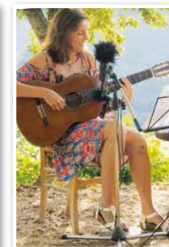
Unna Seite 30 Premiere: italienische Woche