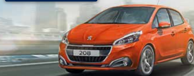
Abbildung zeigt Sonderausstattung.

z.B. Peugeot 208 ACTIVE PURETECH 82 60 kW (82 PS), 5-Türer, Touchscreen, Audioanlage mit Bluetooth, Klimaanlage manuell, Sitzheizung, Einparkhilfe hinten, Elektrisch anklappbare Außenspiegel, uv.m. OHNE ANZAHLUNG mtl. nur 139 €