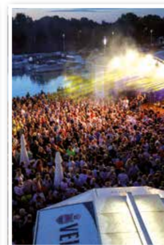
Bergkamen Seite 8 Hafenfest Marina Rünthe