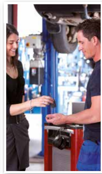
Ausbildung Seite 26 KFZ-Mechatroniker