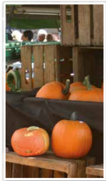
Termin Seite 20 Bauernmarkt in Fröndenberg