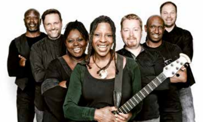
Das Konzert von Judy Bailey bildet den krönenden Abschluss des Kreiskirchentags.

Kulinarisch geht es bodenständig zu: eine große Kuchentheke mit Kaffee und Tee einerseits und ein großer Grill mit Bratwurst und Co. andererseits sorgen für das leibliche Wohl. Wasser, Cola, Limonade und Bier helfen gegen den Durst.