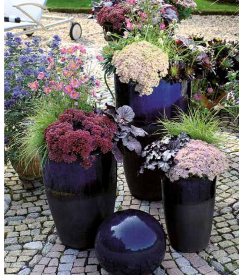
Kompakt und luftig, breitwachsend und aufstrebend, gesetzt und spritzig – diese herbstlichen Kübelbepflanzungen vereinen Harmonie und aufregende Kontraste Bild GMH.

Sich ihrer eigenen Schönheit voll bewusst, unterstreichen sie die Vorzüge ihrer Pflanzpartner noch zusätzlich – wohl wissend, dass das Auge des Betrachters auch zu ihnen zurückkehren wird. Und zwar immer und immer wieder, denn die Herbstzauber-Pflanzen bleiben bis weit in den Winter hinein attraktiv – die einen, da sie oh-