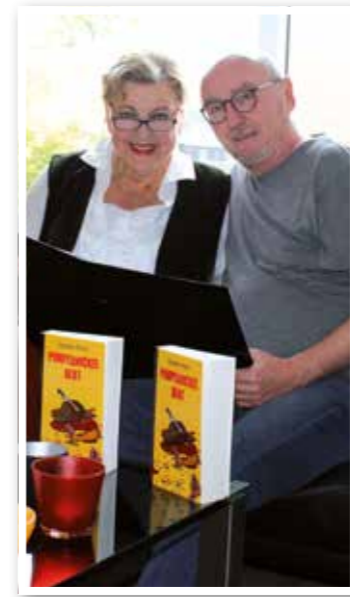
Titel Seite 4 Mörderjagd mit Mutter Beimer