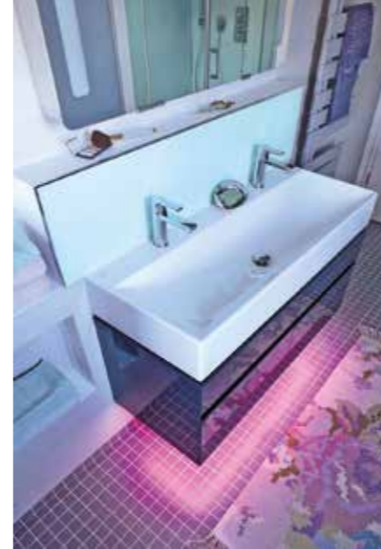
LED-Beleuchtungen, die zudem ihre Farbe ändern können, setzen besondere Lichtakzente - auch als indirekte Beleuchtung unter dem Waschtisch.

Für einen fröhlichen und munteren Start in den Morgen sorgt gutes Licht rund um den Spiegel. Reizvolle Effekte lassen sich zusätzlich mit LED-Stripes als indirekte Beleuchtung erzielen. Die spritzwassergeschützten Strei-