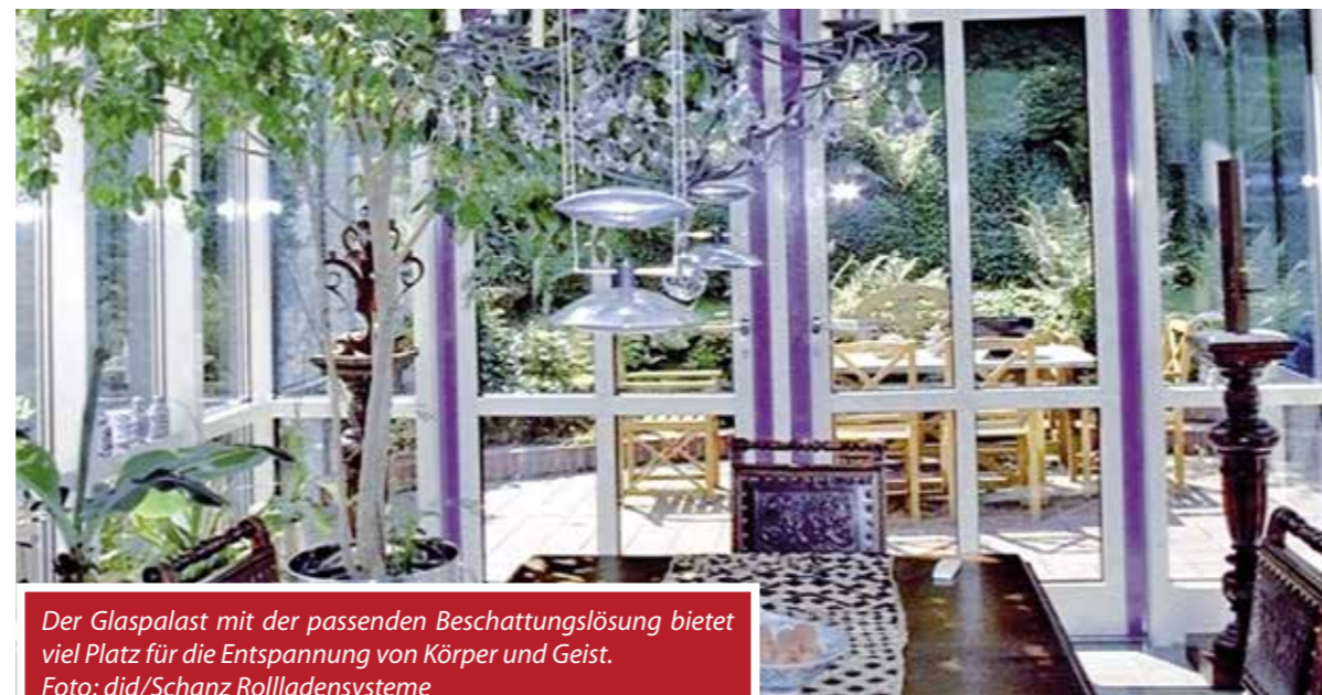
Der Glaspalast mit der passenden Beschattungslösung bietet viel Platz für die Entspannung von Körper und Geist.

So schaffen Sie mehr Platz in Ihrem Zuhause