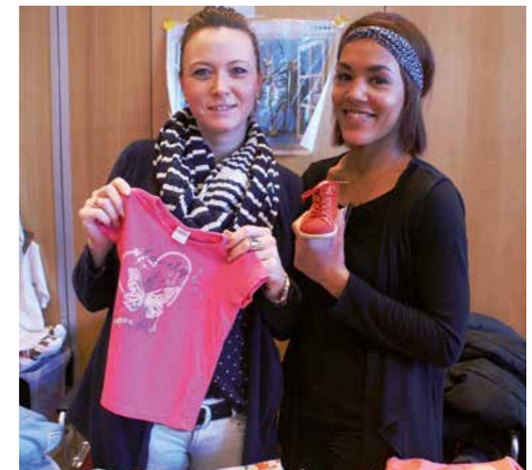
Shoppingspaß beim Schnäppchenmarkt: Riesen Auswahl beim Kids-Markt in Kamener Stadthalle.

Während die Eltern shoppen, können die Kleinen auf der Hüpfburg toben, mit XXL-Legosteinen Meisterwerke bauen, malen oder sich Schminken lassen. Der Eintritt kostet für Erwachsene 2 Euro, Kinder dürfen selbstverständlich kostenlos mitkommen! Die Spezialmesse rund ums Baby und Kind bietet von 11 bis 16 Uhr alles, was das Kinderherz begehrt. Alle weiteren Informationen finden Sie unter www.kids-markt.de .