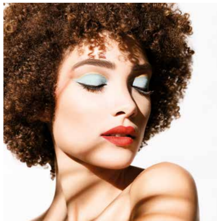
Für das richtige Summerfeeling darf es beim Make-up gerne etwas bunter sein.

Für das richtige Summerfeeling darf es beim Make-up gerne etwas bunter sein. Cremelidschatten in sattem Türkis ist ein echtes Highlight und trotz der Textur problemlos dem Strandbesuch. Abtauchen erlaubt! Konträres, warmes Braun darüber setzt einen natürlichen Schatten. Die präzise gearbeitete Lidfalte mit leuchtendem, goldenen Kajal sorgt für einen betont extravaganten Augenaufschlag. Lippen in sommerlichem Cayenne und dezentes, pfirsichfarbenes Rouge runden dieses Indian-Summer-Make-up perfekt ab.