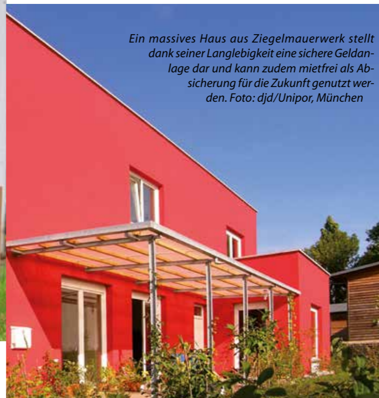
Ein massives Haus aus Ziegelmauerwerk stellt dank seiner Langlebigkeit eine sichere Geldanlage dar und kann zudem mietfrei als Absicherung für die Zukunft genutzt werden.

falle werden. Regionale Anbieter sollten für Tiefbauarbeiten, für die Erstellung des Rohbaus, für Dach und Fassade gesucht werden. Maurer, Zimmermann, Dachdecker und Klempner finden sich besser über „Mundpropaganda“. Das gilt auch für die Gewerke des Innenausbaus, für Schreiner, Maler und Fliesenleger. Auch der Gartenbauer aus der Nähe ist ein verlässlicher Partner. (eb/djd/VPB)