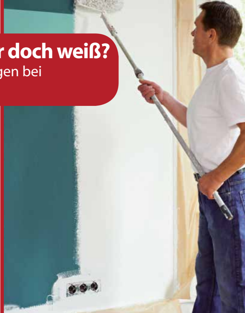
Gerade in Kombination mit starken Farben kommt die zarte Trendfarbe besonders stark zur Geltung.

Damit unter dem strahlenden Weiß aber das alte Rot nicht weiter in einem zarten Rosaton durchscheint, sollte sich nach seinen Worten der Heimwerker für eine Wandfarbe mit hoher Deckkraft entscheiden - das spart Zeit, Material und somit auch bares Geld. (djd)