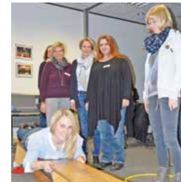
Körperliche Betätigung stand dabei ebenso an.

Großer Andrang herrschte in den Fluren des Sportcentrum Kamen-Kaiserau. Knapp 120 Fachkräfte aus Schule, Kita und dem offenen Ganztage hatten sich zum ersten kreisweiten Sprachbildungstag zusammen gefunden.