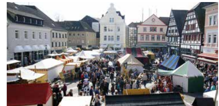
Zum historischen Westfalenmarkt wird am ersten Aprilwochenende eingeladen.