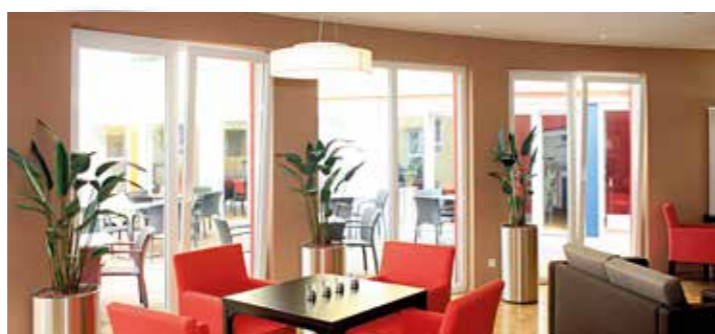
Clubraum zur Terrasse