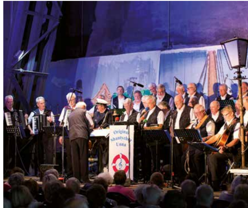
Bei vielen Auftritten haben die Shantychor-Sänger bereits das Publikum begeistert.

Informationen über den Verein gibt es im Netz unter www.shantychor-unna.de .