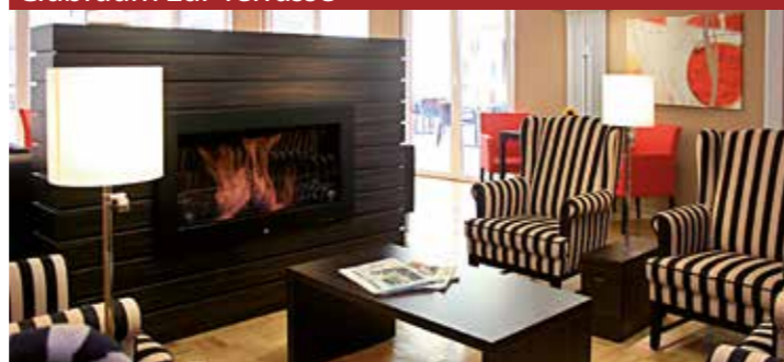
Bibliothek mit Kamin