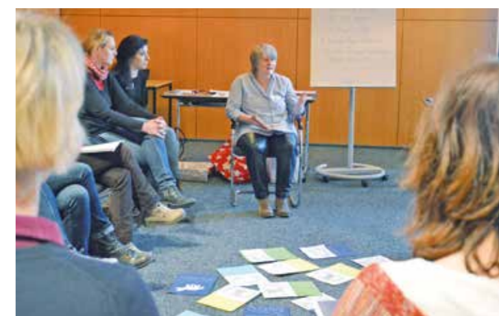
In Workshops wurde die Thematik der Sprachbildung von der Kita in die Schule vertieft.