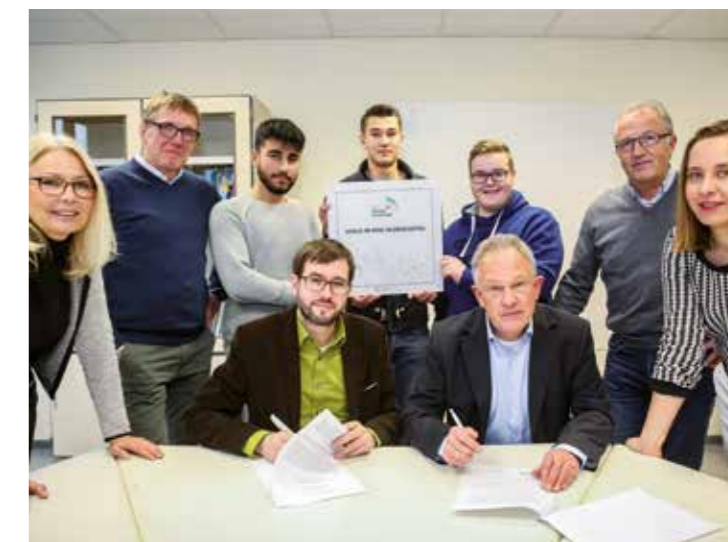
Vertreter der Peter-Weiss-Gesamtschule, der TU Dortmund und vom Kreis vereinbarten in Gegenwart von Jugendlichen und Talentscouts eine Zusammenarbeit.

In der Kooperationsvereinbarung legten die TU Dortmund und die Gesamtschule die Grundzüge ihrer Zusammenarbeit fest. Da geht es um Raumfragen, um Kontakte, um Austausch und vor allem darum, dass die Jugendlichen einen bestimmten Talentscout haben, der sie kennt und den sie kennen. (Kreis)