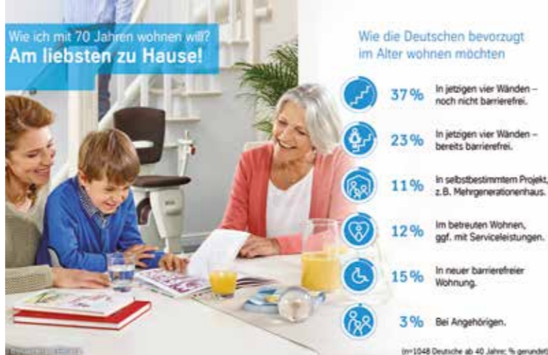
Die meisten Deutschen wollen auch im Alter zu Hause wohnen bleiben.