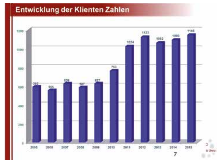
Auszug aus der jüngsten Präsentation "Die Struktur und die Aufgaben der gGmbH für Suchthilfe Kreis Unna".