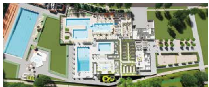
Der 3D-Schnitt zeigt, wie das neu gebaute Natur Solebad in zwei Jahren aussehen wird.

Informationen zum aktuellen Stand und Bilder gibt es im Netz unter www.solebad-werne.de ; das Baustellen-Tagebuch und die Webcam liefern Einblicke in die Entwicklung. (ola)