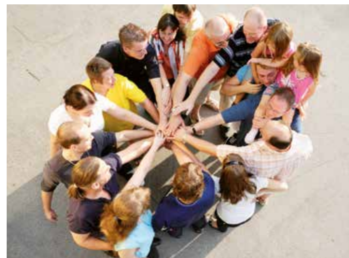
Zum achten Mal wird zur Unnaer Ehrenamts- und Ideenbörse ins Zentrum für Information und Bildung eingeladen.

Bedeutung des Ehrenamtes In Zukunft wird die Bedeutung des Ehrenamtes noch weiter zu-