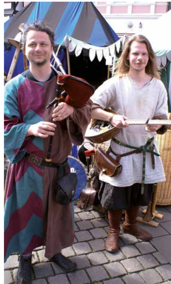
Mittelalterliche Klänge werden nicht fehlen beim Westfalenmarkt in Unna.

Aktionsprogramm am Samstag und Sonntag: Marktmusik, Gaukler, Märchen für Kinder, Schwertkampf der Ritter, Kinderwettstreit gegen Ritter, Kinderschmiede, Bogenschießen, Lederarbeiten für Kinder, Kinderschminken.