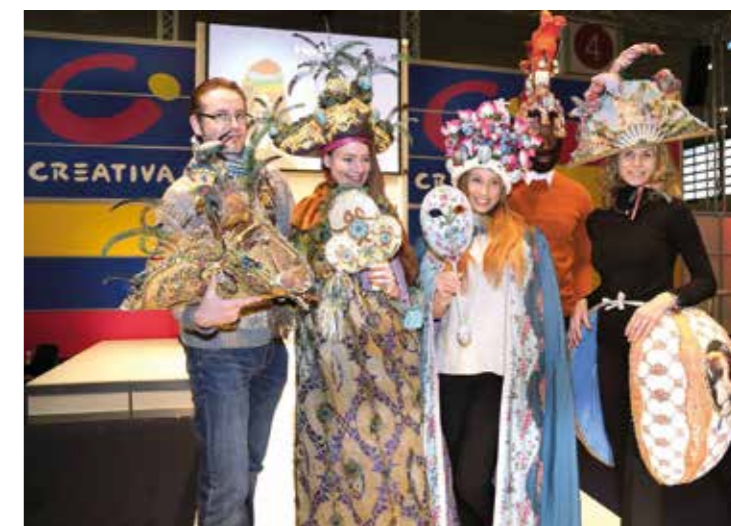
Individuelles und Exquisites wird auf der Messe CREATIVA in Dortmund zu bestaunen sein.

Auf dem exklusiven Forum „fokus.kreatives.handwerk“ in Halle 4 verkaufen ausgewählte