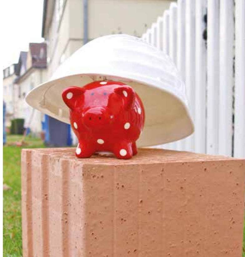
Wer die momentan günstigen Baugeldkonditionen nutzt, kann aktiv für spätere Zeiten vorsorgen und gleichzeitig sein Eigenheim nach eigenen Wünschen gestalten.

Späte Wünsche immer teurer Viele Bauherren glauben, es sei kein Problem, während der Bauphase beispielsweise Innenwände zu versetzen, beobachten