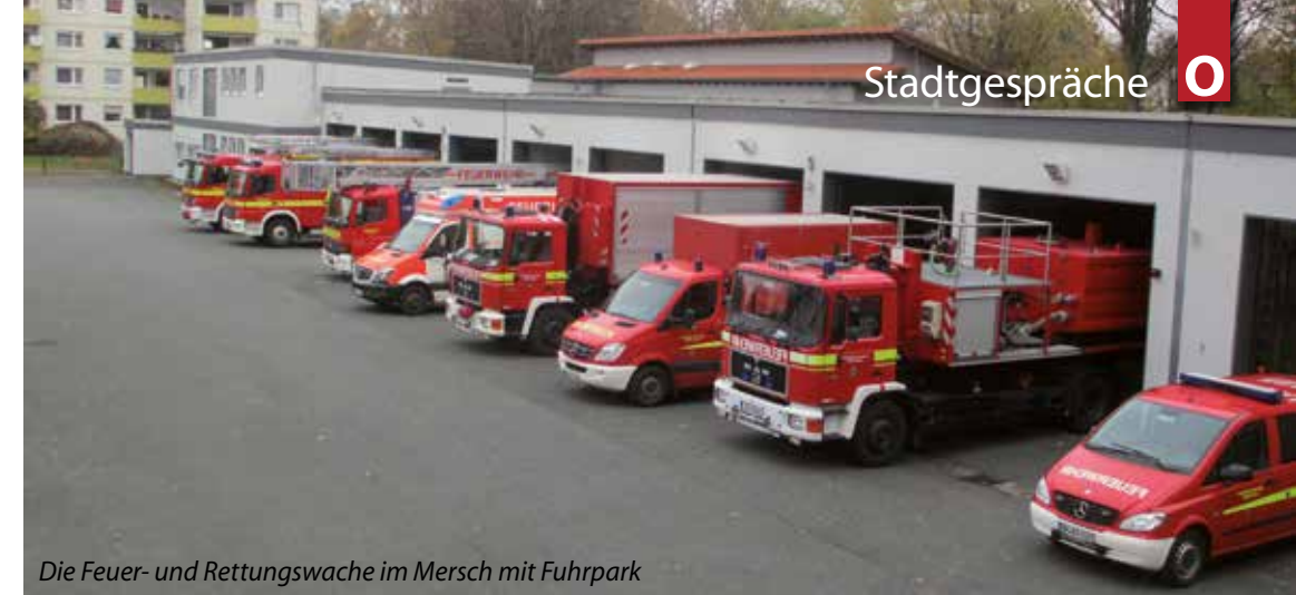
Die Feuer- und Rettungswache im Mersch mit Fuhrpark