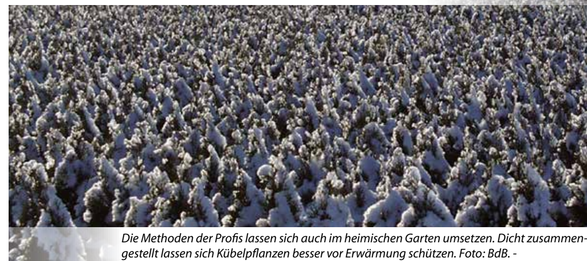
Die Methoden der Profis lassen sich auch im heimischen Garten umsetzen. Dicht zusammengestellt lassen sich Kübelpflanzen besser vor Erwärmung schützen.

Es klingt paradox, doch wer seine Gehölze im Garten vor Frost schützen will, muss dafür sorgen, dass sie tagsüber nicht zu stark von der Sonne erwärmt werden. Die Ursache ist in der Physiologie der Pflanzen zu finden. „Im Gegensatz zu Menschen und Tieren, die eine bestimmte Körpertemperatur aufrecht erhalten müssen, vertragen winterharte Pflanzen problemlos längere Frostperioden, indem sie ihren Stoffwechsel auf ein Minimum herunterfahren“, erklärt Michael Koop vom Bund deutscher Baumschulen (BdB) e.V.