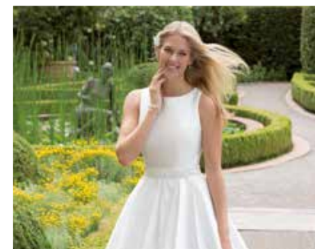
Es wird fließend, transparent, leicht und romantisch.

Auch dies sollte vorher geprobt werden. Wichtig ist es, keine zu dunkle Foundation zu wählen - das macht oft optisch alt. Highlighter unter den Brauen sowie braunrosa Rouge auf dem höchsten Punkt der Wangen verleihen dagegen Frische. Wasserfester Eyeliner und Mascara in Tiefschwarz geben einen ausdrucksvollen Blick und halten auch Rührungstränen Stand. (akz-o/djd).