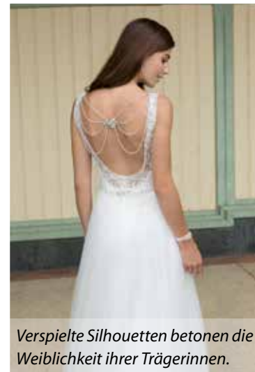
Verspielte Silhouetten betonen die Weiblichkeit ihrer Trägerinnen.

Hier ist Pflege von innen und außen angesagt. Am besten beginnt man drei, vier Monate vorher mit einer verjüngenden Schönheitskur. Ihre Hochzeitsfrisur testet die kluge Braut