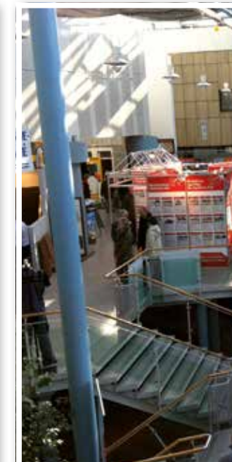
Planen- Bauen- Wohnen Seite 24 Kamener Bau- und Immobilienmesse mit neuem Namen