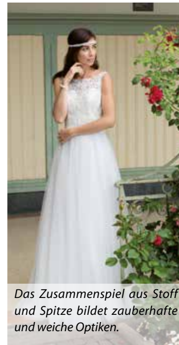
Das Zusammenspiel aus Stoff und Spitze bildet zauberhafte und weiche Optiken.

Nicht nur wegen des Eherings stehen bei der Hochzeit