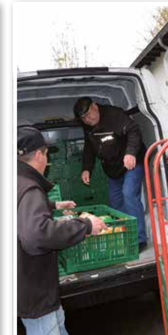
Fast ein mittelständisches Unternehmen Seite 28 Die Tafel in Unna – 120 Ehrenamtliche und zehn Ausgabestellen