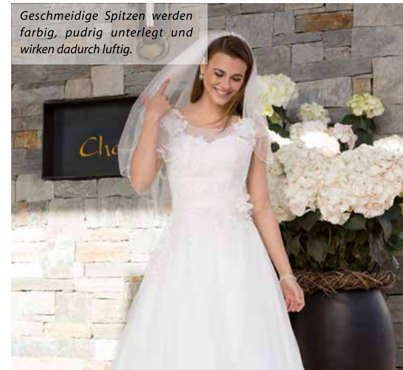
Geschmeidige Spitzen werden farbig, pudrig unterlegt und wirken dadurch luftig.