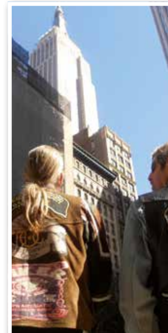
Eine eingeschlossene Gemeinschaft Seite 8 Fröndenberger Gründer freut sich über internationale Mitglieder