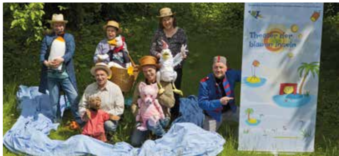
Mit der Aufführungsreihe „Theater der blauen Inseln“ bringen drei Kinder- und Familientheater ihr Kulturangebot auch in den Kreis Warendorf.

Wenn die Kinder nicht ins Theater können, kommt das Theater zu den Kindern! Das sagten sich drei Kinder- und Familientheater aus dem Münsterland – das Krokodil Theater aus Tecklenburg, das Theater Don Kidschote aus Münster und das Figurantentheater Hille Puppille aus Dülmen – und starten jetzt ins zweite Jahr mit der Aufführungsreihe „Theater der blauen Inseln“. Geplant sind bis zu 100 Aufführungen im gesamten Münsterland.