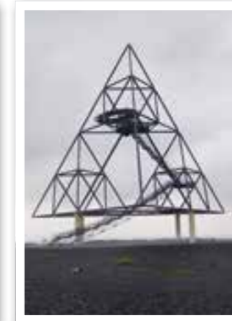
Ab ins Blaue Seite 19 Auf Entdeckungstour in der Region