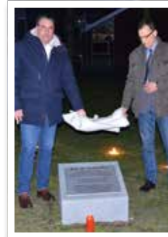
Ahlen Seite 6 „Platz der Weißen Rose“

Redaktion: Michaela Dziwisch Heike Sieger Satz: FKW Fachverlag GmbH Druck: Senefelder Misset, Doetinchem Erscheinungsweise: monatlich Verbreitungsgebiet: Ahlen, Beckum, Drensteinfurt, Oelde und Ennigerloh Erfüllungsort: Möhnesee Auflage: 14.550 Keine Gewähr für unaufgefordert eingesandte Manuskripte oder Fotos. Der Abdruck von Veranstaltungshinweisen ist kostenlos. Abdruck und Vervielfältigung redaktioneller Beiträge und Anzeigen bedürfen der ausdrücklichen Zustimmung des Verlages.