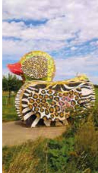
Nette Begrüßung am oberen Parkplatz des Sauerlandparks in Hemer.

Spaß und auch Matsch verspricht. Wo wir beim Sauerland sind: Nahe Warstein können Groß und Klein nicht nur die Natur beim Wandern genießen, sondern auch Wild hautnah er-