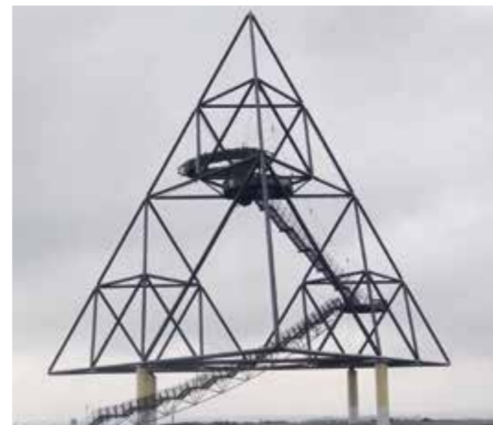
Auf dem Tetraeder in Bottrop hat man bei gutem Wetter einen Top-Ausblick über den Ruhrpott.