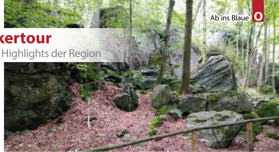
Mystisch und naturnah: das Felsenmeer in Hemer.