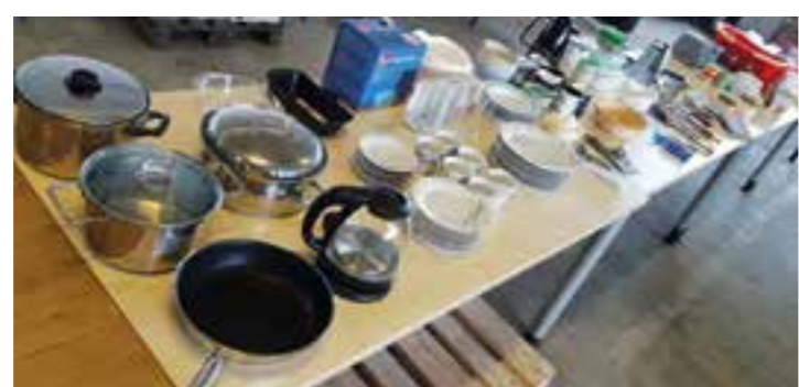
10 Startersets für Küchen hat Horizonte e.V. bereits für die städtischen Unterkünfte zusammengestellt, damit sich die Flüchtlinge möglichst gut selbst versorgen können.

Immer mehr Flüchtlinge aus der Ukraine kommen nach Ennigerloh und nicht alle können in privaten Wohnungen untergebracht werden. Aus diesem Grund richtet die Stadt Ennigerloh wieder eigene Wohnungen für Frauen und Kinder ein. Dabei nutzt sie die seit langem gute Zusammenarbeit mit den örtlichen Handwerkern, Händlern, Vereinen, Kirchengemeinden und privaten Initiativen.