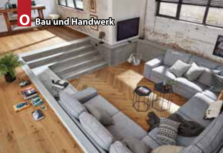
Ein Parkettboden ist auch 2022 moderner denn je.