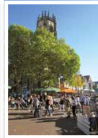
Oelde Seite 14 Frühlings-Erlebnis-Tag