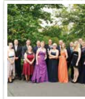
Schützen Seite 6 Collage der Königspaare