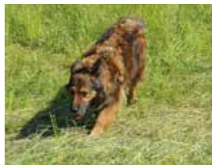
200 Schafe machen, was Asta von ihnen verlangt.