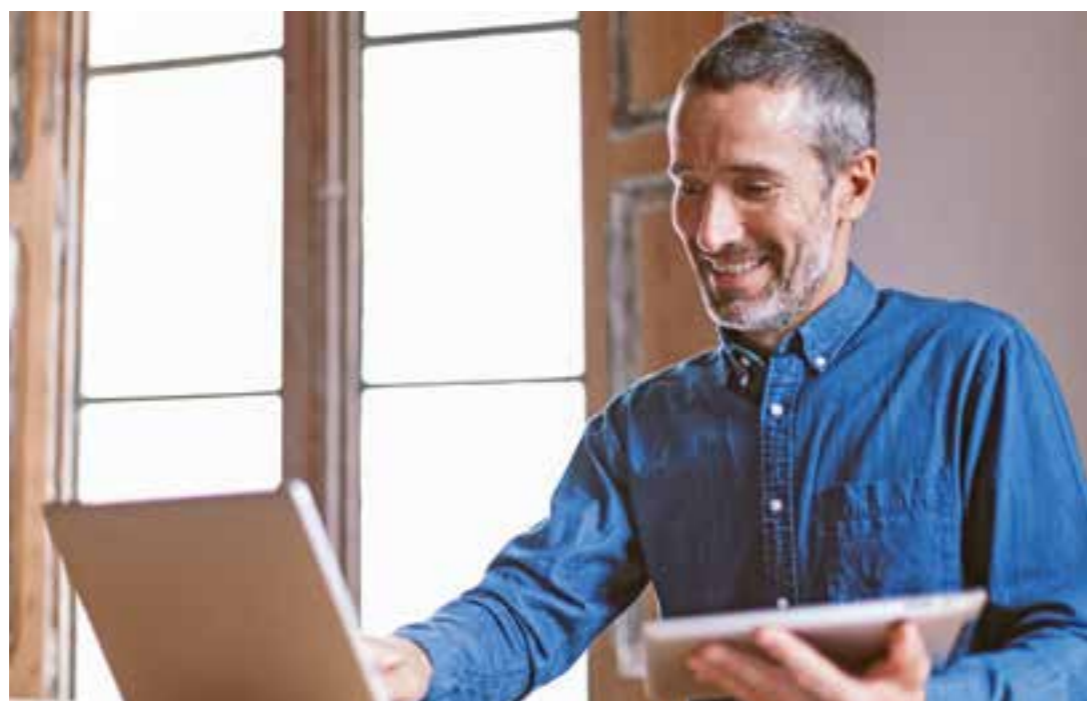
Wer sich jetzt beruflich auf den neuesten Stand bringt, kann zuversichtlich in die Zukunft blicken.

Wer eine Fachschule für Erzieher, Meister- oder Betriebswirtkurse besuchen möchte, kann eine staatliche Unterstützung beantragen. Das Aufstiegs-BAföG unterstützt den beruflichen Aufstieg bei mehr als 700 Fortbildungsabschlüssen. Zum 1. August dieses Jahres hat das Bundesministerium für Bildung und Forschung (BMBF) die Förderleistungen noch einmal deutlich ausgebaut.