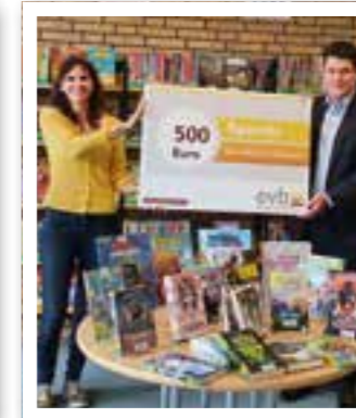
Beckum Seite 15 evb startet Spendenaktion