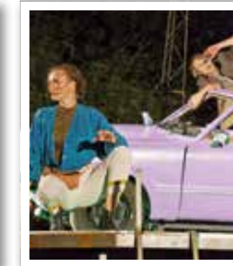
Ahlen Seite 24 „Schuhfabrik Kultursommer“