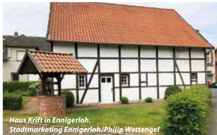
Haus Krift in Ennigerloh.

Aus dem Denkmalförderprogramm 2021 des Landes Nordrhein-Westfalen hat die Bezirksregierung Münster der Stadt Ennigerloh für die Baudenkmäler „Haus Krift“ und die „Aussegnungshalle am Friedhofsweg“ Fördermittel in Höhe von insgesamt 57.000 Euro bewilligt.