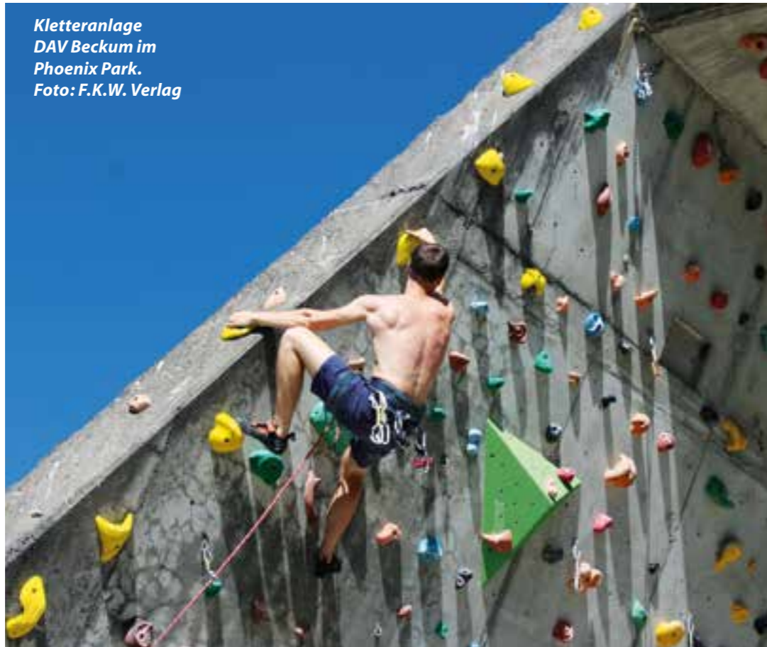
Kletteranlage DAV Beckum im Phoenix Park.

Konkret erhält der Beckumer Reiterverein 10.000 Euro zur Modernisierung der Entwässerung auf dem Reitgelände, der Turnverein 11.812 Euro zur Modernisierung des Bootshauses, der Tanzsportclub Rot-Gold Neubeckum 12.000 Euro zur Modernisierung der Zu- und Abluftanlage und die Deutsche Alpenverein (DAV) Sektion Beckum erhält 11.000 Euro zur Modernisierung der alten Kletteranlage. Der Alpenverein Beckum weitet übrigens aktuell seine Angebote an Ausflügen und Kletterkursen wieder aus.