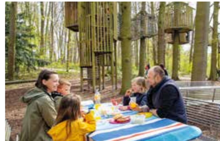
Im Vier-Jahreszeiten-Park gibt es an zahlreichen Stellen wunderbare Picknickmöglichkeiten – wie etwa hier auf fest installierten Bänken und Tischen.

Statt in die Ferne schweifen, schöne Ziele vor Ort genießen