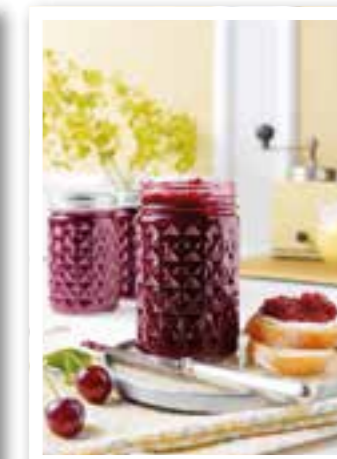
Gaumenfreuden Seite 21 Heimisches Obst genießen