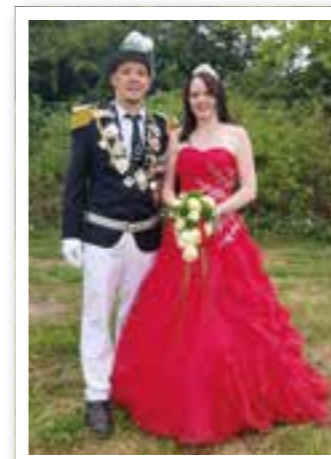
Ahlen/Beckum Seite 6 2020 ohne Horrido