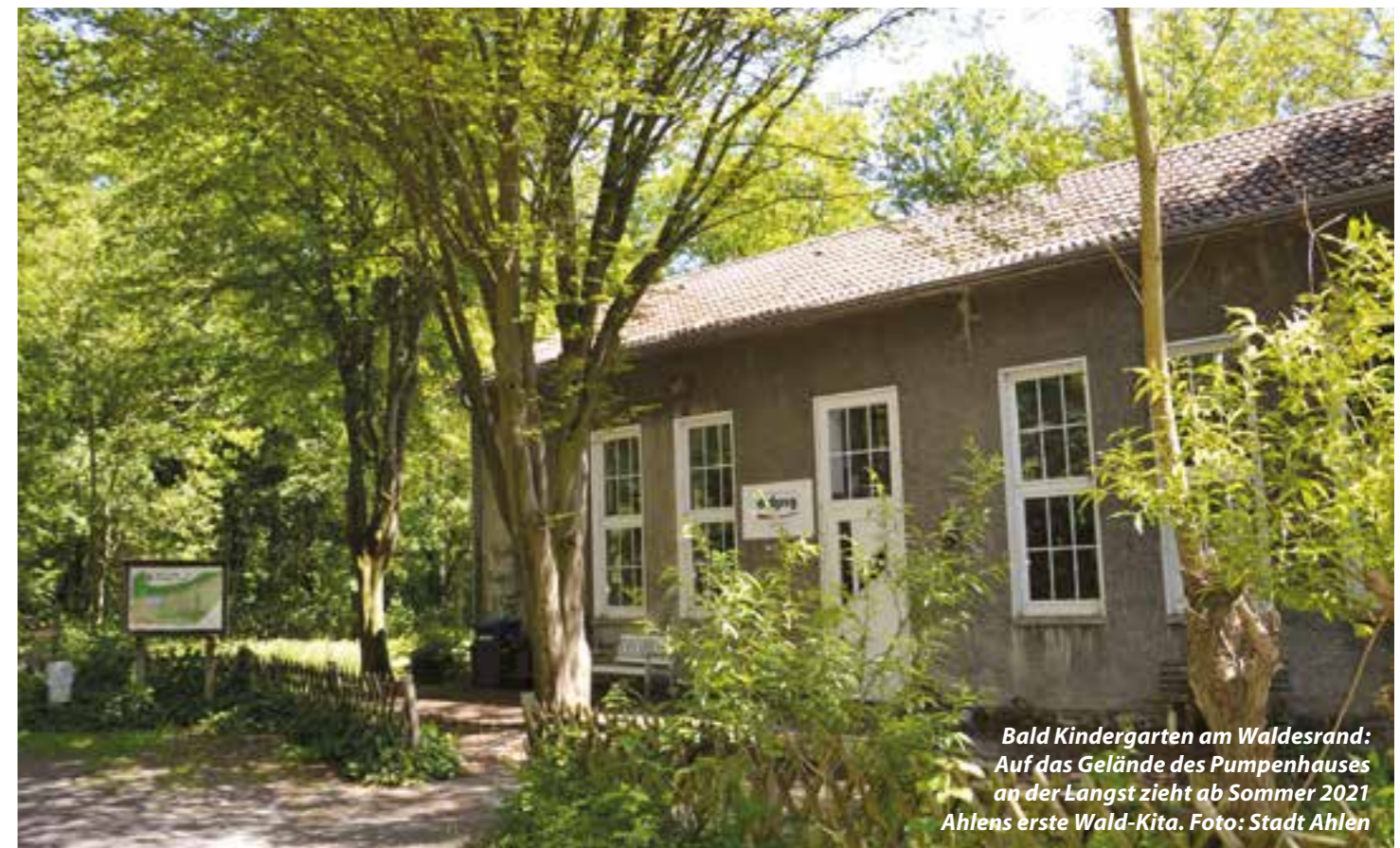
Bald Kindergarten am Waldesrand: Auf das Gelände des Pumpenhauses an der Langst zieht ab Sommer 2021 Ahlens erste Wald-Kita.

DRK eröffnet im August 2021 Ahlens erste Wald-Kita