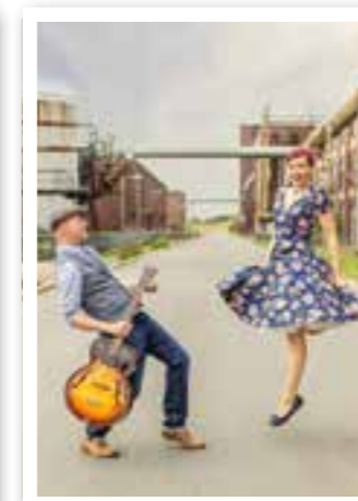
Ahlen Seite 12 Schuhfabrik: Kultursommer