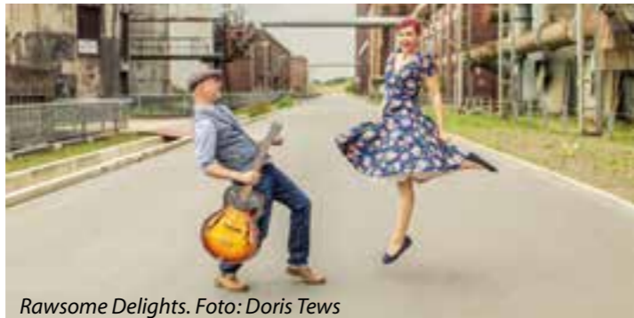
Rawsome Delights.

freiem Himmel auf dem Parkplatz hinter der Schuhfabrik statt. An jedem Termin können maximal 100 Personen unter entsprechenden Hygiene- und Sicherheitsvorkehrungen teilnehmen.