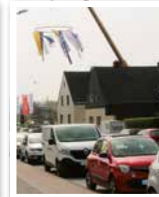
Beckum Seite 14 Automeile