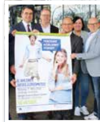
Ahlen Seite 7 8. Ausbildungsmesse