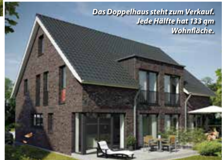
Das Doppelhaus steht zum Verkauf. Jede Hälfte hat 133 qm Wohnfläche.