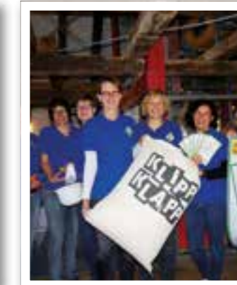
Oelde Seite 30 Neues aus dem Vier-Jahreszeiten-Park