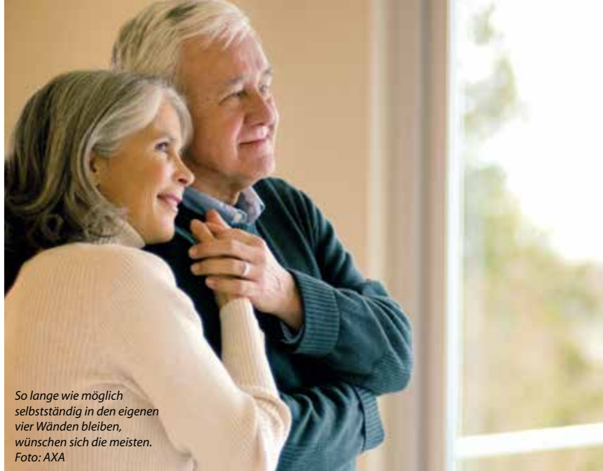
So lange wie möglich selbstständig in den eigenen vier Wänden bleiben, wünschen sich die meisten.

Wer noch fit genug ist, um in den eigenen vier Wänden zu leben, aber nicht mehr alles selbst machen mag, der kann – auch unterstützt von der Pflegekasse – auf Hilfe bei Haushalt und Körperpflege setzen. So kann Ihnen eine Haushaltshilfe lästige Arbeiten wie Putzen und Wäschepflege abnehmen. Das Kochen können Sie eventuell auch einer Hilfskraft überlassen oder auf einen mobilen Menüdienst setzen, der Ihnen täglich ein schmackhaftes Mittagessen nach Hause bringt. Sie leben allein? Sicherheit, dass Ihnen zum Beispiel im Falle eines Sturzes geholfen wird, bietet Ihnen ein Hausnotruf. Dieser wird als Armband oder als Kette getragen und kann im Notfall gedrückt werden. Der Anbieter wird dann