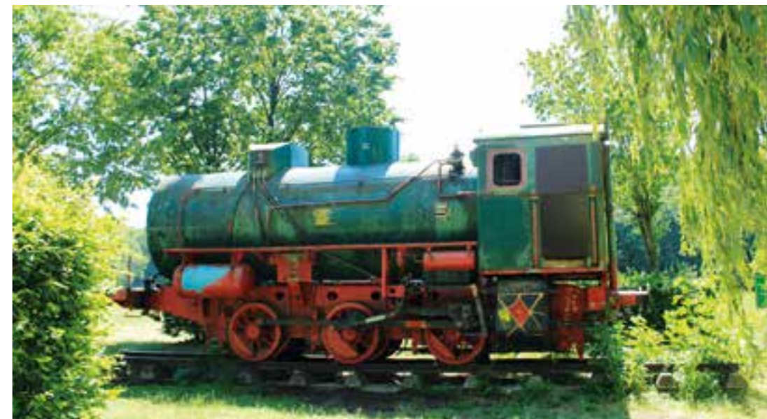
Phoenix-Park Beckum.

und Beckum auswählt, hat anschließend zahlreiche Ausflugsziele in der Nähe. Der Aktivpark Phoenix eignet sich durch seine Stadtnähe hervorragend für zahlreiche Freizeitaktivitäten. Neben einem Abenteuerspielplatz sind Spielbereiche für Kinder verschiedener Altersgruppen eingerichtet, wie zum Beispiel Sandspielplätze, eine Wasserspielzone, ein Spielhang mit Riesenrutsche, eine Seilbahn sowie verschiedene Geräte zum Wippen, Schaukeln, Balancieren, Klettern und Spielen.