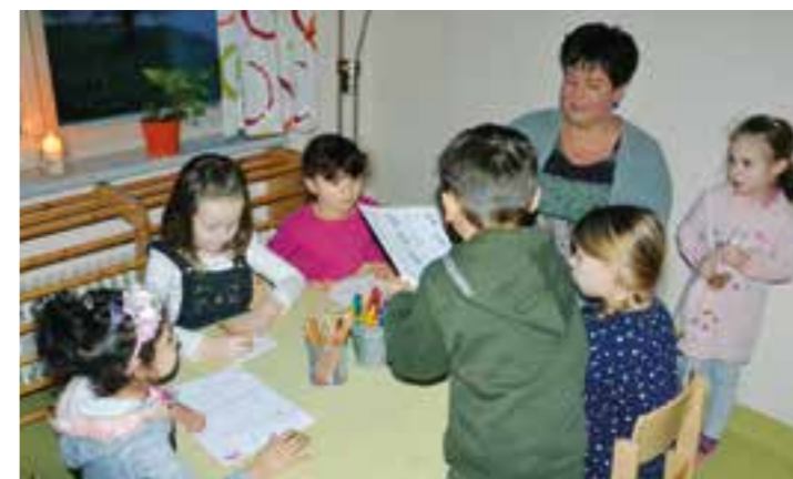
Basteln eines Daumenkinos, das auch ohne Elektrizität Geschichten erzählt.

Wie es sich anfühlt, einen Tag lang auf elektrischen Strom zu verzichten, haben Kinder und Erzieherinnen der Kita Beumers Wiese ausprobiert. Ungewöhnlich dunkel war es vor der Kita, als gegen 7 Uhr die ersten Kinder eintrafen. Aber nicht nur das Licht blieb aus. Beim gewohnten Druck auf den Klingelknopf tat sich nichts! Wer rein wollte, musste mit einer Glocke auf sich aufmerksam machen. Der Aktionstag, der zum dritten Mal stattfand, will ein Gefühl für bewussten Energieverbrauch vermitteln.