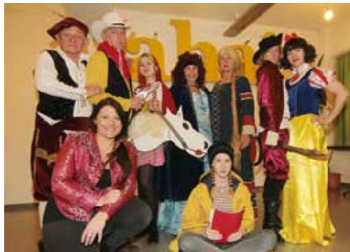
Theatergruppe St. Ludgeri.

Die Theatergruppe St. Ludgeri aus Ahlen ist wieder in Spiellaune. Nachdem dieses Ensemble in den letzten Jahren immer wieder mit Boulevardstücken, Komödien und einer Faust-Persiflage zu gefallen wusste, haben die Akteure diesmal selbst ein Stück geschrieben und unter der Regie von Andrea Kühn-Parciany inszeniert. Der Titel lautet „Märchen außer Rand und Band!“ und ist erneut ein Angriff auf die Lachmuskeln der Besucher.