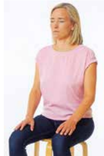
Sitzmeditation lässt sich unkompliziert und ohne Extra-Geräte durchführen.

konzentrieren und dadurch den Schmerz besser ausblenden. Andere Übungen der Rückenschule, wie zum Beispiel aus dem Bereich Hatha-Yoga oder Meditation, können ebenfalls zu einer Besserung von Rückenbeschwerden führen. Wie wäre es mit einer einfachen Alltags-Übung? Probieren Sie doch einmal eine Sitz-Meditation aus. Wählen Sie einen Ort aus, der sich für das Nichtstun anbietet. Setzen Sie sich auf einen Hocker und nehmen Sie eine bequeme, aber zugleich aufrechte Sitzhaltung ein. Achten Sie darauf, dass Kopf, Nacken und Rücken eine gerade Linie bilden – so kann der Atem ungestört strömen. Nun atmen Sie bewusst ein und aus und konzentrieren sich ganz auf den Atemvorgang. Für den Anfang reichen zehn Minuten, Sie können die Übung auch auf eine halbe Stunde oder länger ausweiten! Initiiert und organisiert wird der Aktionstag von der Aktion Gesunder Rücken (AGR) e.V. und dem