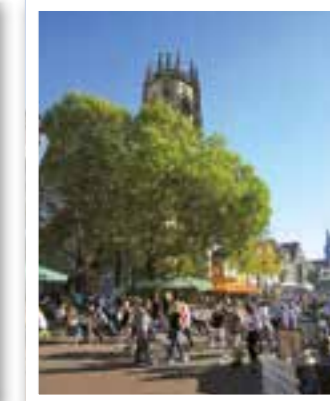
Oelde Seite 30 HET