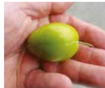
V.K. Feys gelbe H. Wadersloh

Neben den alten Apfel- und Birnensorten stehen auf der ca. 40 bis 50 Jahre alten Obstwiese auch mehrere Pflaumensorten, die in diesem Jahr bestimmt wurden. An verschiedenen Stellen wurden sie gesammelt und anschließend an die Steinobst-Expertin Dr. Annette Braun-Lüllemann übergeben. Über den Vergleich von Form und Größe mit den vorhandenen Fruchtsteinen einer Sammlung können die Pflaumensorten zugeordnet werden. Natürlich spie-