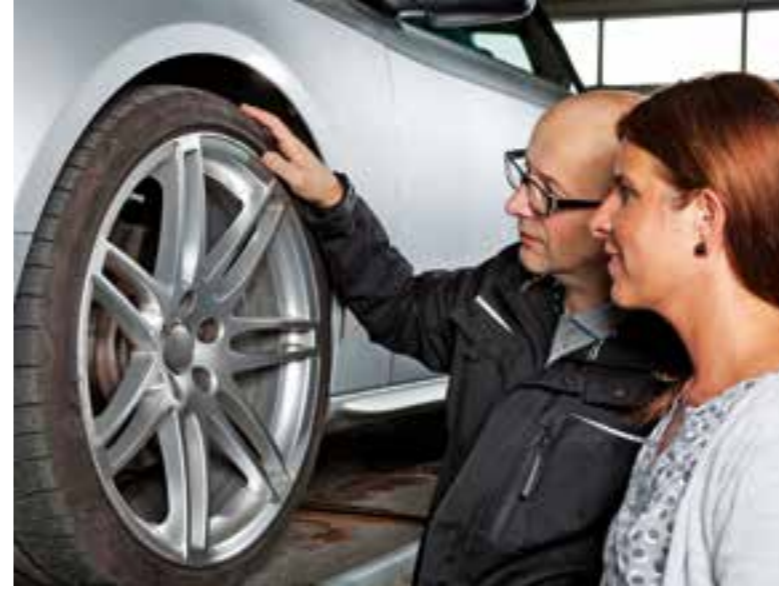
Spezialisierte Fachbetriebe bieten beim Reifenwechsel einen kostenlosen Räder-Check an.

Bremse und Co. überprüfen Gerade die Bremse ist bei rutschigen Straßenverhältnissen besonders gefordert. Der Werkstattcheck zeigt sofort, ob die Anlage in gutem Zustand ist oder ob die Beläge erneuert werden sollten. Zu einem Mehr an Sicherheit kann auch der Austausch alter Scheibenwischer beitragen.