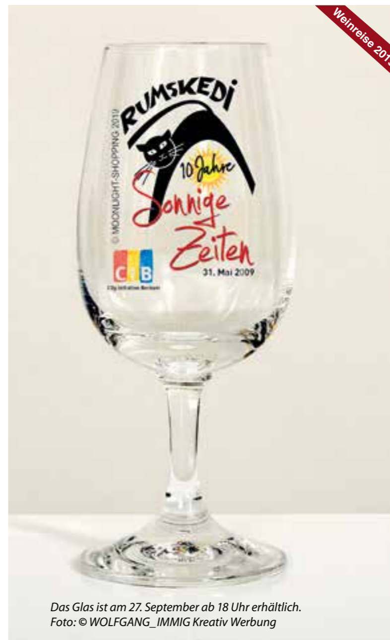
Das Glas ist am 27. September ab 18 Uhr erhältlich.

Am Freitag, 27. September, lädt die City Initiative Beckum bereits zum siebten Mal zum beliebten Moonlight Shopping mit Weinreise in die Innenstadt ein. In der Zeit von 18 bis 23.11 Uhr können Beckumerinnen und Beckumer die Gelegenheit nutzen, sich mit Freunden und Bekannten zu treffen, und die neuesten Modetrends des Herbstes zu entdecken.