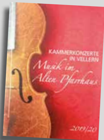
karten für das Konzert kosten 20 Euro.

Am Konzertabend Variationen „Bei Männern, welche Liebe fühlen“ von Ludwig van Beethoven sowie Sonaten von Franz Schubert und César Franck werden erklingen. Eintrittskarten für das Konzert kosten 20 Euro.