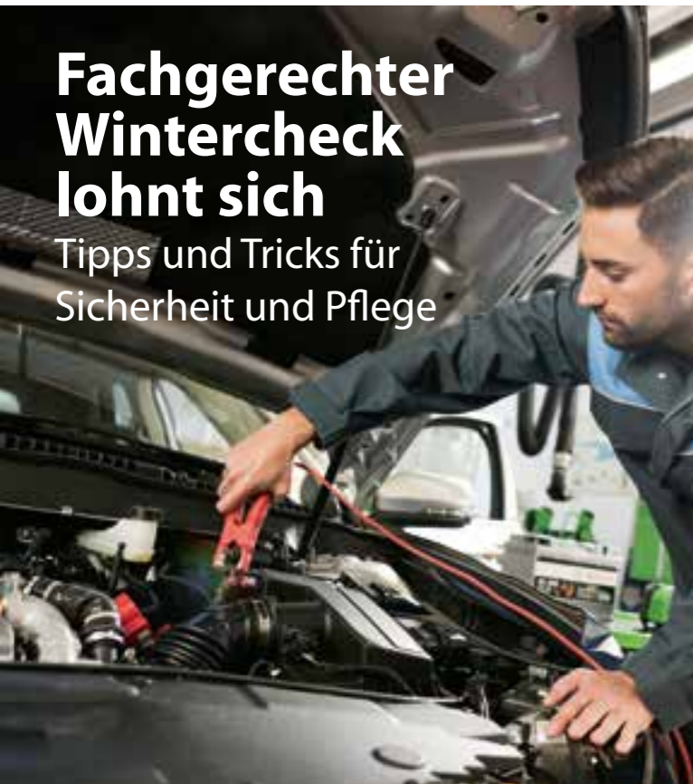
Hat die Batterie genug Power für strenge Frostnächte? Beim Herbst-Winter-Check kontrolliert der Fachmann den Batteriespeicher ebenso wie Bremsen, Licht und Scheibenwischer.

Tipps und Tricks für Sicherheit und Pflege