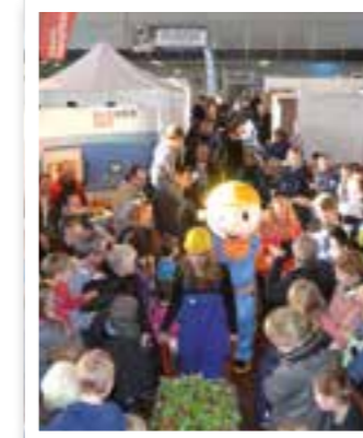
Ahlen Seite 8 Ahleener Bautage