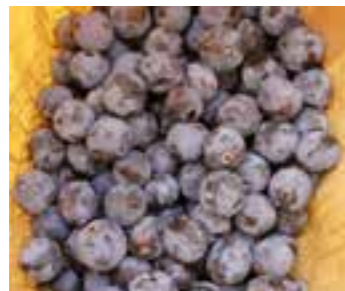
V.K. AT Zuckerpfäumchen Wadersloh

Im Rahmen des insgesamt fünfjährigen Leader-Projektes „Südwestfalens blühende Vielfalt erhalten“ wurden in Wadersloh sechs alte Pflaumensorten wiederentdeckt. Das Projekt hat zum Ziel, nach alten Obstsorten zu suchen und die Bevölkerung etwa durch Veranstaltungen und Öffentlichkeitsarbeit über die Bedeutung von Streuobstwiesen und historischen Obstsorten zu informieren.