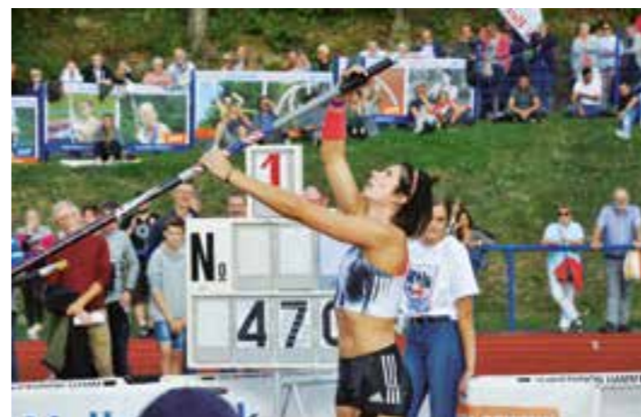
Jennifer Suhr, die Olympia-Siegerin und Hallenweltmeisterin aus den USA siegte mit 4,75 Metern beim 21. Beckumer Stabhochsprung-Meeting.

Jennifer Suhr fliegt über 4,75 Meter zum US-Sieg