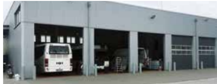
In der Fahrzeughalle von Taxi Goß in Wadersloh beginnt die erste Werkmesse am Sonntag, 29. September, um 11 Uhr. Die Katholische Pfarrei St. Margareta Wadersloh und der Männergesangverein „Lyra“ Wadersloh laden dazu herzlich ein.

Die Gläubigen aus allen fünf Gemeinden der Pfarrei St. Margareta sind willkommen. „Wir haben schon viele verschiedene Gottesdienste in