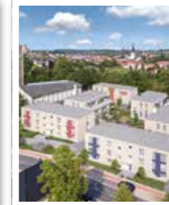
Beckum Seite 24 Martinsquartier