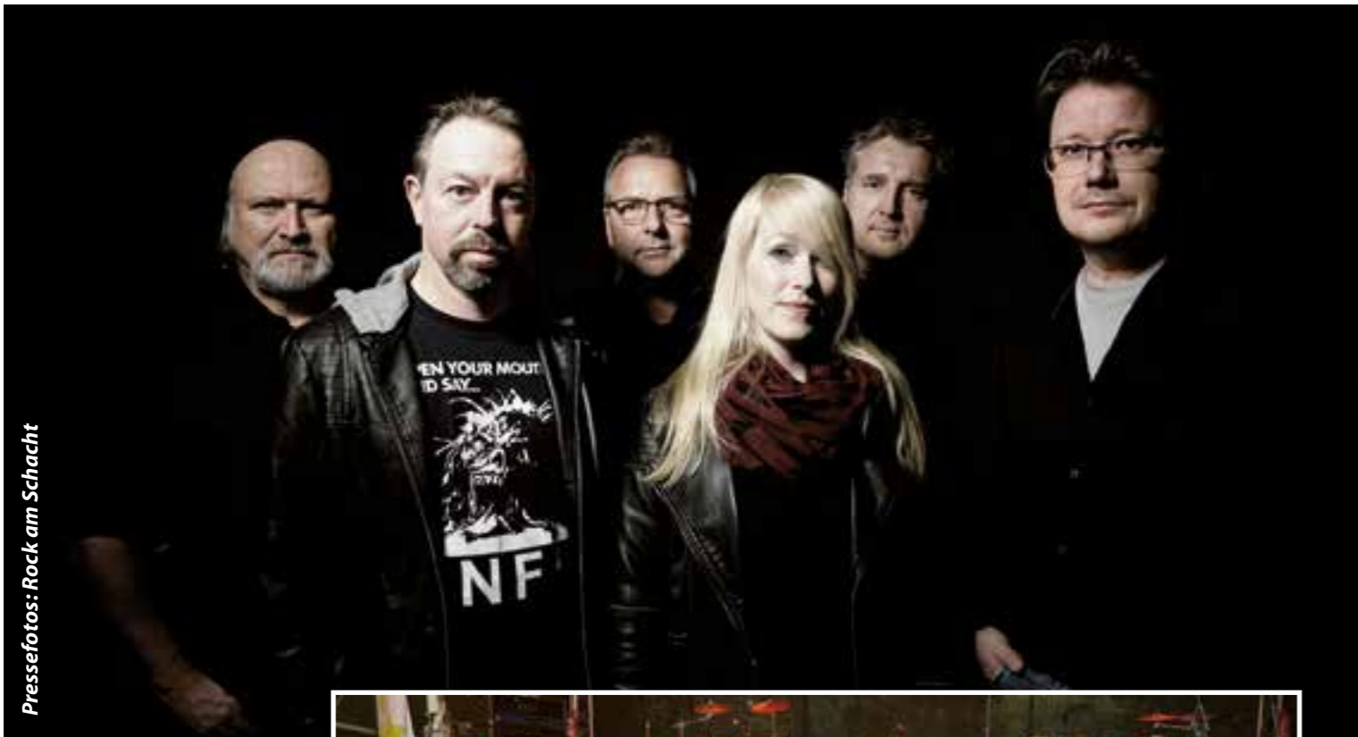
Pressefotos: Rock am Schacht

Mit viel „Frauen-Power“ startet die Musikerinitiative „Rock am Schacht“ am Freitag, 11. Oktober, in die zweite Hälfte des Veranstaltungsjahres 2019. In der Lohnhalle der Zeche Westfalen in Ahlen findet ein Doppelkonzert mit Rockbands statt, die mit temperamentvollen Frontfrauen für Stimmung sorgen.