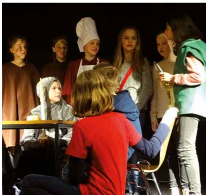
Theaterstücke gekonnt inszeniert vom 6. Schuljahr.

The Show must go on! Dies könnte das Motto für den Theaterabend der Jahrgangsstufe 6 in diesem Jahr gewesen sein. Denn obwohl in vielen Klassen das Grippevirus grassierte, wurde die Show durch die Schüler der Jahrgangsstufe 6 mit gewohntem Engagement auf die Bühne der AMG-Aula gezaubert.