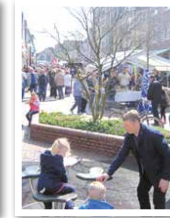
Oelde Seite 20