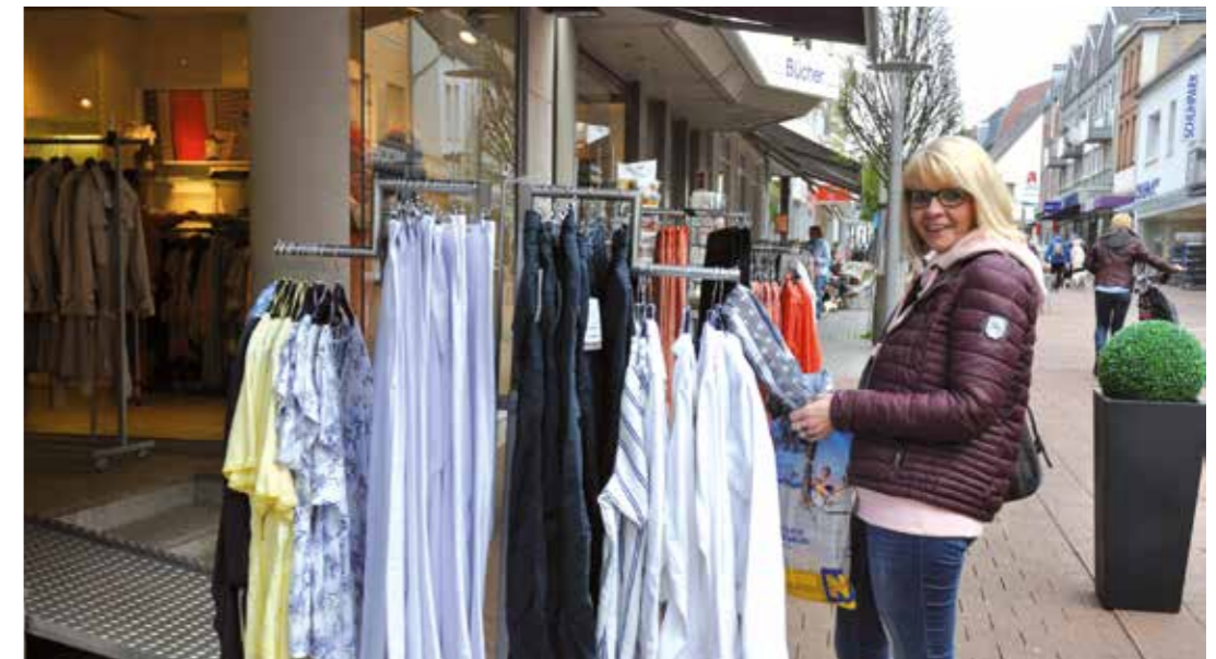
Beim Frühlingsfest in Beckum gibt es manches Schnäppchen zu erhaschen.

Unter dem Motto „Rate mal im Wersetal - Das Beckumer Schaufenster Quiz“ sind alle Interessierten aus Nah und Fern zum verkaufsoffenen Sonntag willkommen. Die Geschäfte haben in der Zeit von 13 bis 18 Uhr geöffnet. Ohne Hektik und Eile kann hier gebummelt, geschaut und gekauft werden, denn die Frühjahrs- und Sommerkollektion, sowohl bei der Bekleidung, als auch bei Schuhen und Taschen sind in den Schaufenstern ausgestellt und ansprechend dekoriert. Bei den Eisdiele und den Ca-