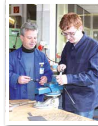
Beckum Seite 6