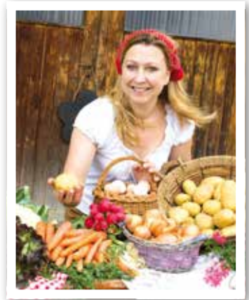
Gesundheit Seite 35 Hofläden – regional einkaufen