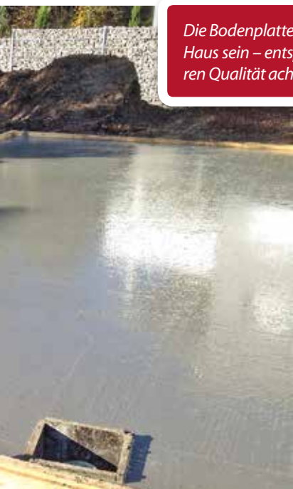
Die Bodenplatte soll ein sicheres Fundament für das Haus sein – entsprechend sollten Bauherren auf deren Qualität achten.