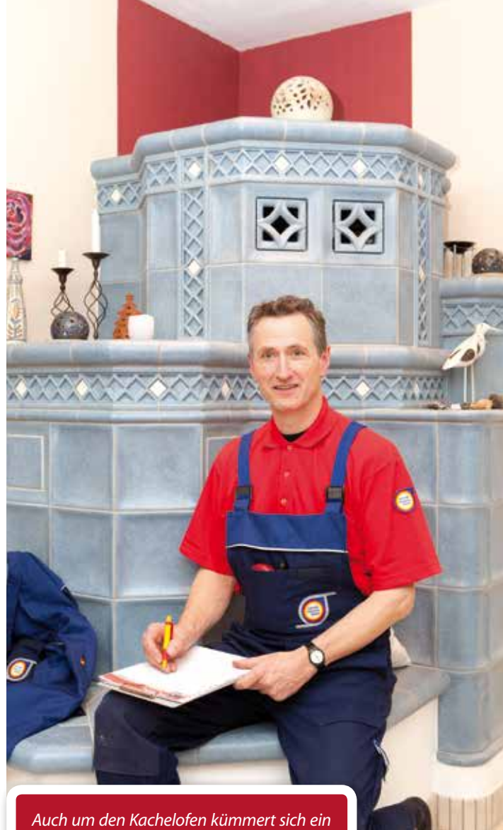
Auch um den Kachelofen kümmert sich ein Handwerker: Mit Liebe und Erfahrung.