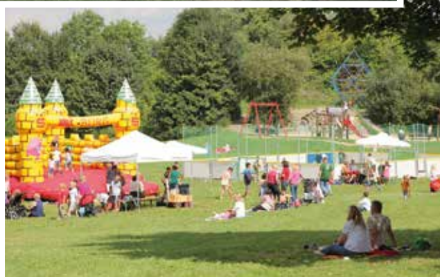
Die Ferenspieltage 2017 bieten ein tolles Aktionsangebot.