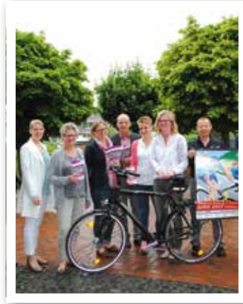
Wadersloh Seite 31 Erstes inklusives Radrennen