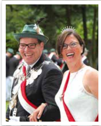
Beckum Seite 6 St. Sebastian Schützen feiern