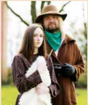
General Jeremiah Watkins.

Reservierungen für die Premiere am 5. August 2023 und die sich anschließenden elf Aufführungen können ab sofort vorgenommen werden. Nutzen Sie die Online-Kartenreservierung. Bei der Bezahlung mit PayPal können Sie sich Ihre Eintrittskarte selbst