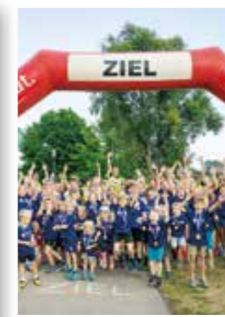
Seite 26 Kinder-Fun-Triathlon Mönnesee