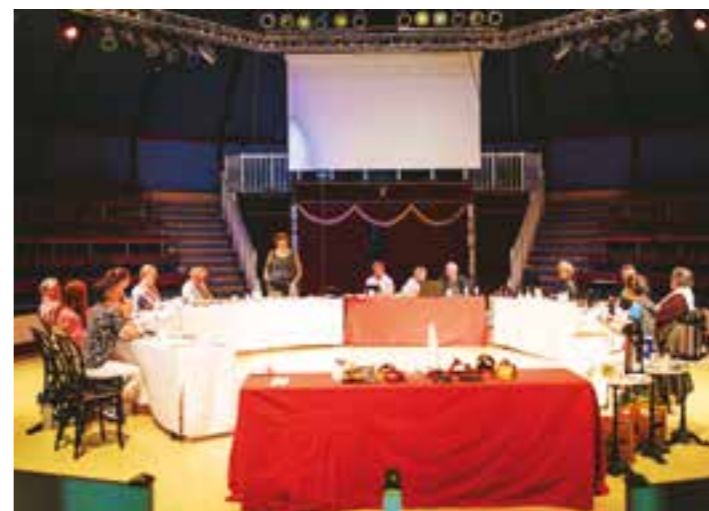
Das Ensemble des Stücks „Der Jupp muss wech!“ im Circus Travados bei der ersten Leseprobe des Stückes.

Mit dem Großprojekt geht der Circus Travados in seinem Jubiläumsjahr spannende und unterhaltsame, aber auch anregende (neue) Wege. Für die Produktion des Stückes sowie den anschließenden Aufführungsreigen (zurzeit sind mindestens zehn Vorstellungen eingeplant) konnten gut 200.000 Euro Finanzmittel bei verschiedenen