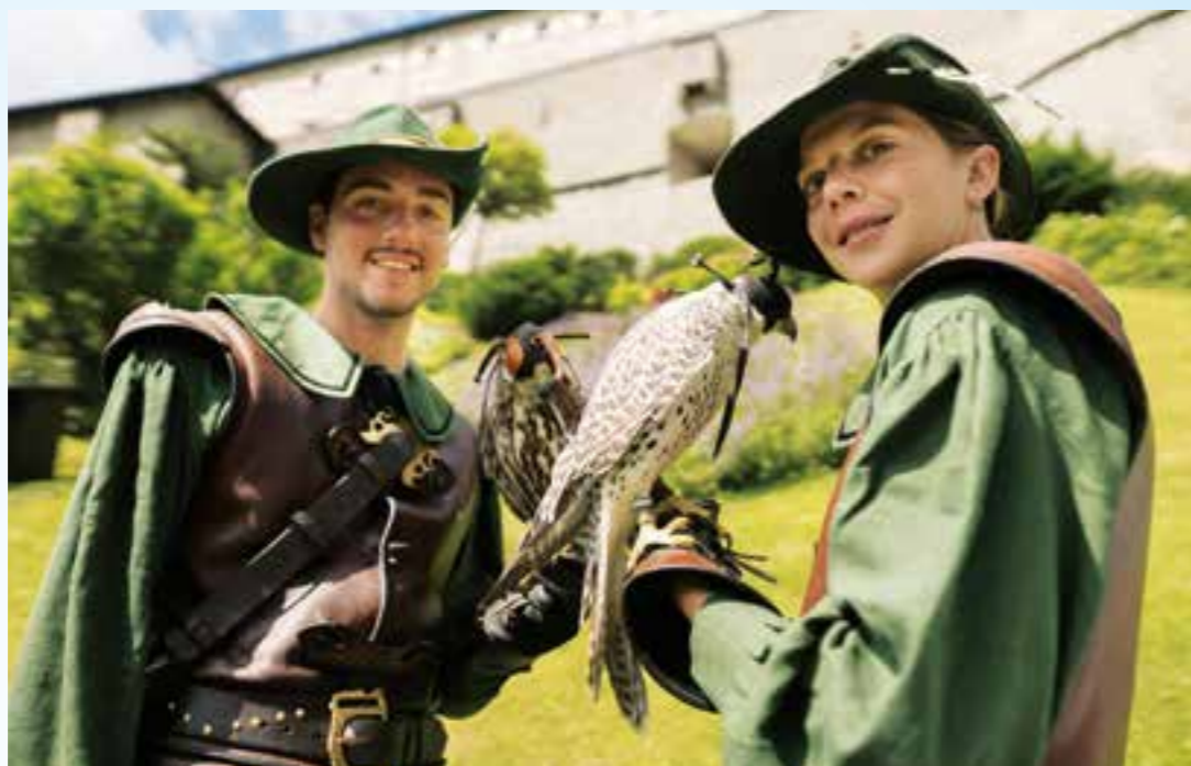
Historische Greifvögel lassen sich bei den Vorführungen des Landesfalkenhofs auf der Erlebnisburg Hohenwerfen aus nächster Nähe bestaunen.

Unser Tipp für Familien: Entdecken Sie die Region Salzburg in Österreich und tauchen Sie ein ins Mittelalter. Keine Frage, das Mittelalter fasziniert und begeistert die Menschen auch heute noch. So zählt die Erlebnisburg Hohenwerfen, die majestätisch auf einem Felsen über dem Salzbachtal thront, zu Salzburgs beliebtesten Ausflugszielen für Familien. Wer die mächtigen Mauern der Burg, die bereits als Filmkulisse dienten, durchschreitet, taucht ein in eine völlig andere Welt.