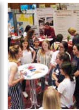
Seite 31 Aktionstag Arbeit Ausbildung