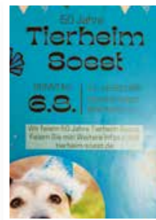
Seite 4 50 Jahre Tierheim Soest