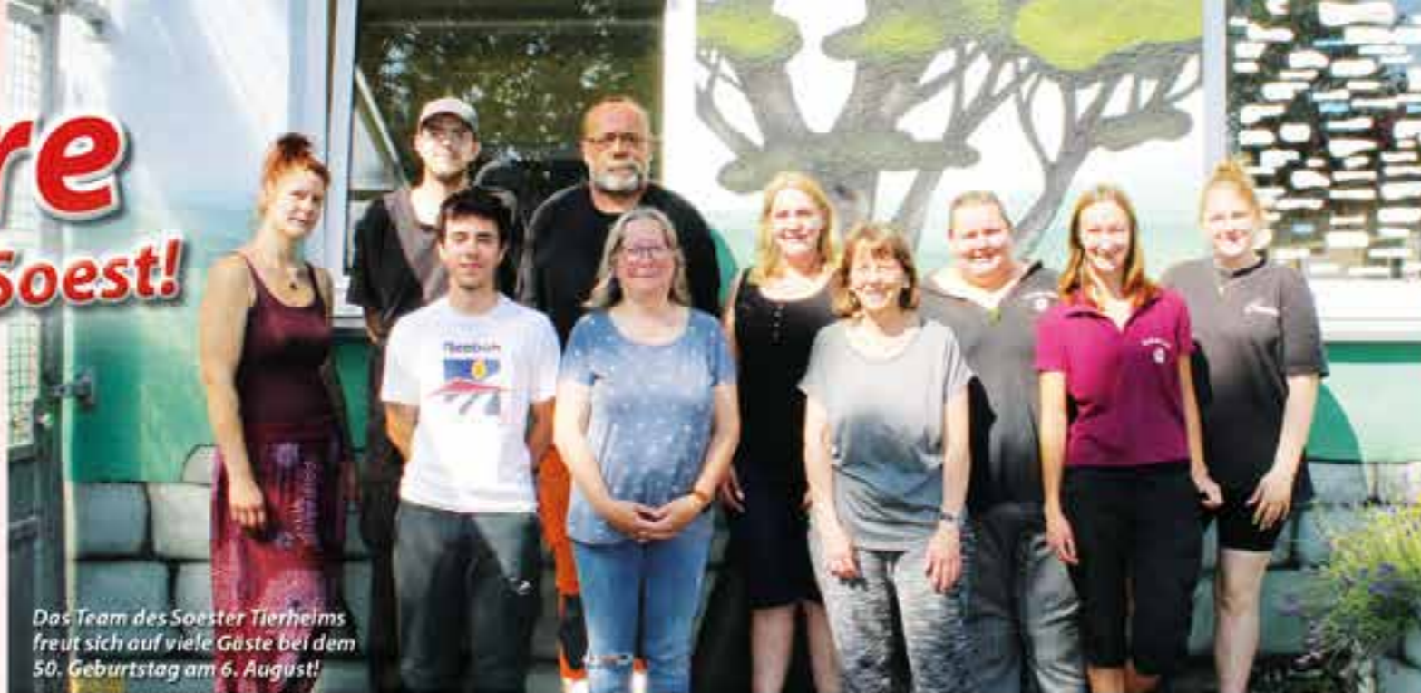
Das Team des Soester Tierheims freut sich auf viele Gäste bei dem 50. Geburtstag am 6. August!

Im Sommer 1969 fand man ein passendes, 1.985 Quadratmeter großes Grundstück am Birkenweg 10 und kaufte es. Am 11. April 1970 begann der Bau des Soester Tierheims. 90 Prozent der Bauarbeiten wurden in Eigenleistung erbracht. Gleichzeitig sammelte man weiterhin durch verschiedene Aktionen Geld, um den Bau zu finanzieren. Am 30. Ap-