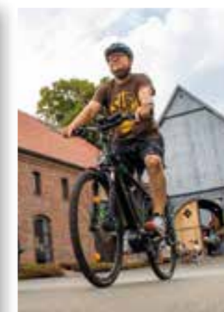
Seite 7 Anradeln im Kreis Soest