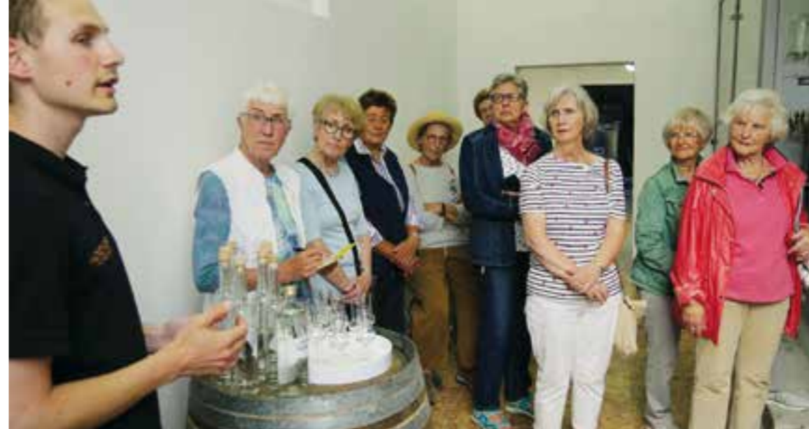
Beim traditionellen Klönabend im Sommer besuchen die Mitglieder immer ein interessantes Ziel im Kreis Soest, hier die Kornbrennerei Northoff in Lippetal, und kehren anschließend zum Klönen in einen Gasthof ein.

Monatstreffen hören wir in der Regel einen Fachvortrag zu gärtnerischen Themen. Manchmal gibt es auch einen Reisebericht, natürlich mit dem Schwerpunkt auf Gärten, Parks und der Pflanzenwelt des Reiseziels. Und einmal im Jahr haben wir gewöhnlich auch einen Vortrag zu aktuellen Umweltthemen. Des Weiteren treffen wir uns im Dezember zu einer kleinen Adventsfeier mit Grünkohllessen und gelegentlich auch im Mai zum Spargelessen. In diesem Jahr geht unsere Urlaubsreise vom 4. bis 8. Juni nach Mannheim zur Bundesgartenschau. Dabei erkunden wir natürlich auch das Umland, besuchen die Deut-