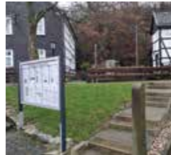
Der Treffpunkt auf dem Gelände vor dem im Hintergrund erkennbaren Stollenbunker.

Wegen des ausgesprochen großen Erfolges der öffentlichen Stollenbunker-Besichtigungen in Belecke für Einzelpersonen und Kleingruppen (unter zehn Personen) führt der Kultur- und Heimatverein Badulik e. V. (KuH) dieses Konzept auch im Jahre 2023 fort.