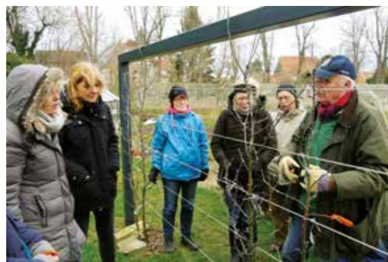
Der Obstbaum-Schnittkurs im Februar für alle Gartenfreunde gehört seit vielen Jahren zum regelmäßigen Angebot des Obst- und Gartenbauvereins Soest.