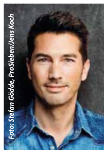
Foto: Stefan Gödde