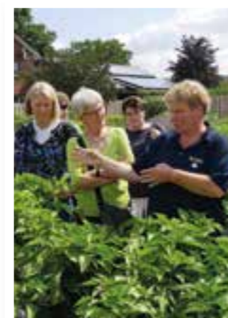
Seite 4 Obst- und Gartenbauverein