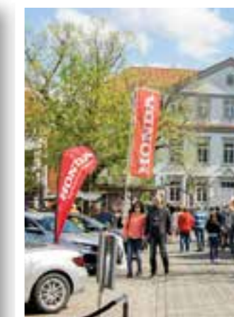
Seite 31 Auto-Frühling Werl