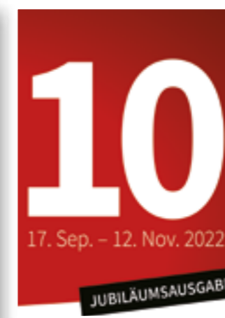
Seite 8 Mord am Hellweg