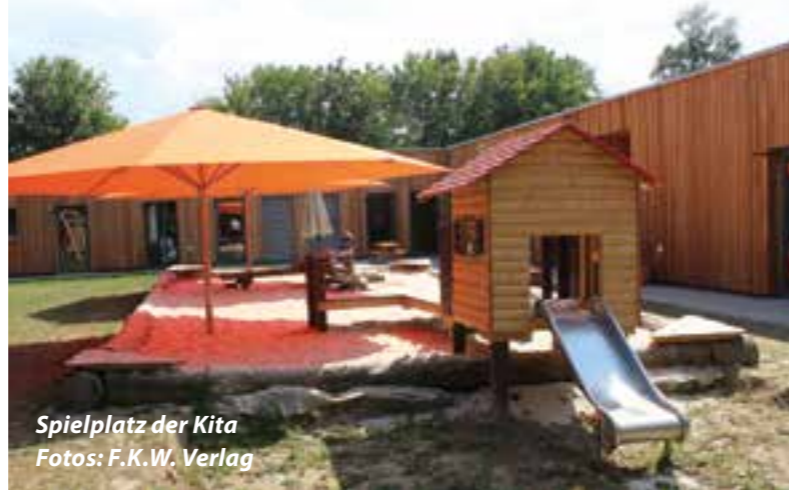
Spielplatz der Kita