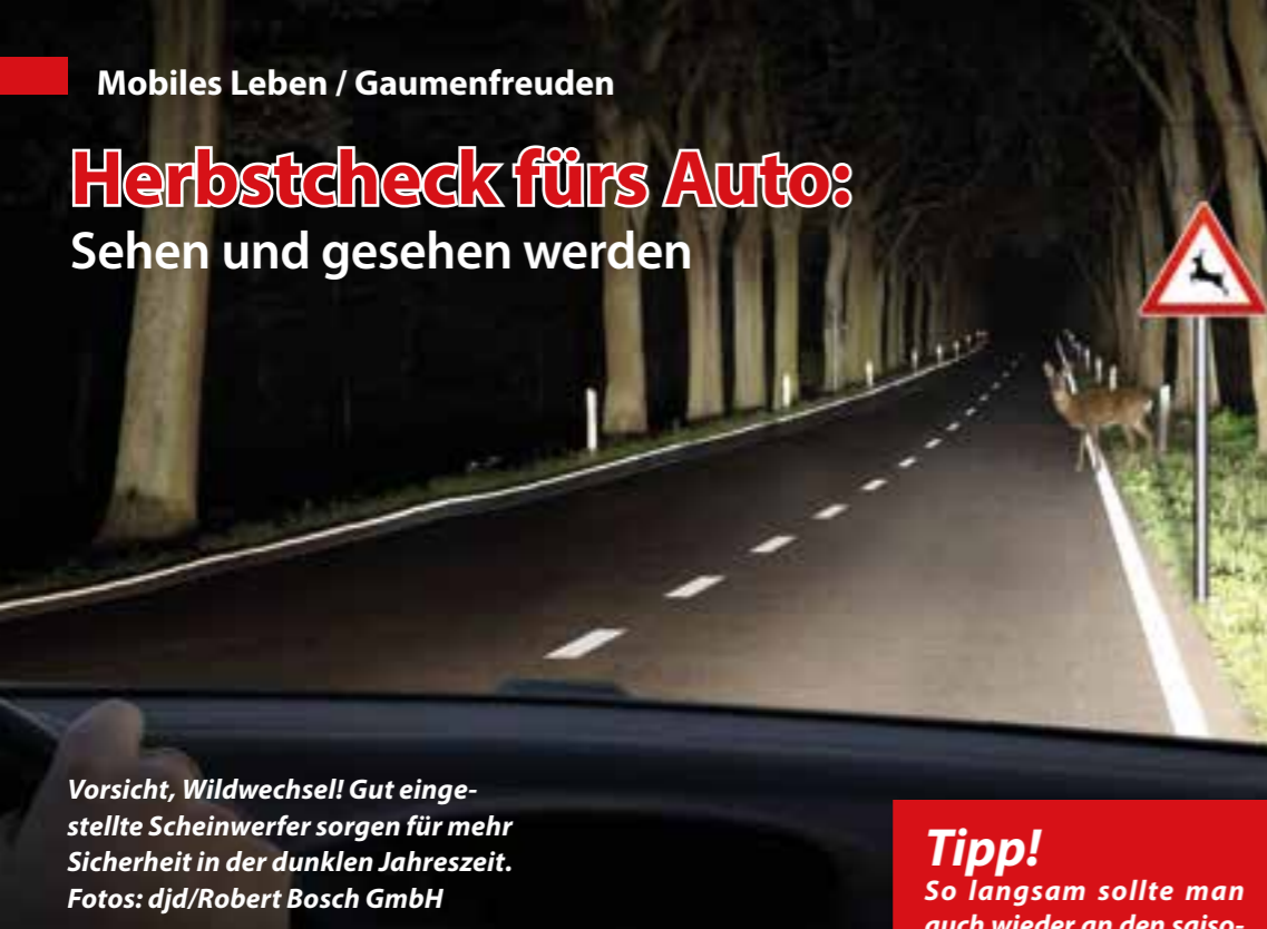
Vorsicht, Wildwechsel! Gut eingestellte Scheinwerfer sorgen für mehr Sicherheit in der dunklen Jahreszeit.

Bei früh einsetzender Dämmerung und nasskaltem Schmelwetter mit Regen und Nebel kommt es am Steuer vor allem auf eines an: gute Sicht. Doch viele Autofahrer scheinen die Beleuchtung ihres Gefährts sträflich zu vernachlässigen.