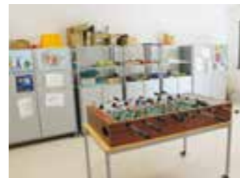
Spiel- und Kreativraum der OGS

genutzt wird, und drei Themenräume: Holzspielbereich, Kreativbereich und Baubereich. Zwischen diesen können die älteren Kids gemäß dem offenen Konzept nach ihren Interessen hin und her wechseln. Für die zwölf Kinder der neuen U3-Gruppe sind die Räume im hinteren Bereich des Gebäudes so konzipiert, dass man sich auch ein wenig abgrenzen kann, damit die ganz Kleinen in den Schlafräumen Ruhe finden. Zwei Nebeneingänge führen auf das Außengelände mit Schaukel, Rutsche und Sandkasten mit Matschbereich sowie Terrasse. Der Nebeneingang für die OGS liegt in Richtung Schule. So können die Schüler:innen von dort auch ihr weitläufiges Außengelände in Richtung Sportplatz erreichen. Ihnen stehen zudem ein Kreativraum, ein Bauraum, ein Rollenspielraum und