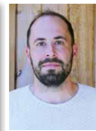
Seite 20 Neubau Kita „Burgelon“