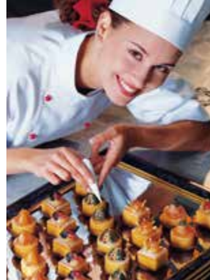
Bei der Ausbildung zum/r Konditor:in ist Fingerspitzengefühl gefragt.

Podcast zum Thema Doch was kann getan werden, damit junge Menschen ihren Neigungen und Talenten bei der Berufswahl wieder besser folgen können? Wie kann es gelingen, dass wieder mehr Jugendliche den Weg in die Berufe finden, die hängierend gebraucht werden? Diesen und weiteren Fragen geht Moderatorin Anna Planken – bekannt aus dem ARD-Morgenmagazin – in einem neuen Podcast auf den Grund. In „Wer macht Morgen? Warum wir für die Zukunft jetzt umdenken müssen.“ spricht sie mit prominenten Gästen aus Politik, Wissenschaft, Handwerk und öffentlichem Leben.