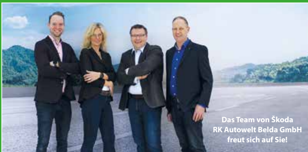
Das Team von Škoda RK Autowelt Belda GmbH freut sich auf Sie!

in nur sechs Schritten! Das ŠKODA ENYAQ COUPÉ iv gibt es in vier Leistungsvarianten – und mit einer Reichweite von bis zu 545 Kilometern. Dank kurzer Ladezeiten ist das Auto auch perfekt für Langstrecken gerüstet. Das Infotainmentsystem bringt die neueste Software ME 3 mit, die u.a. für optimierte Fahrzeugklimatisierung und ein verbessertes Batteriemangement sorgt und immer online ist, sodass Sie alle Dienste von ŠKODA Connect nutzen können. Klingt aufregend? Dann schauen Sie sich das ENYAQ COUPÉ iv live und in Farbe an: Bei RK Autowelt Belda freut man sich auf Ihren Besuch!