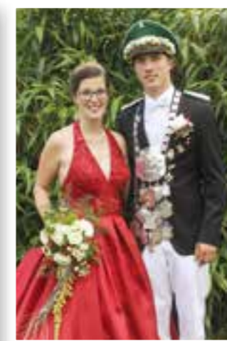
Seite 5 Schützenfeste im Kreis