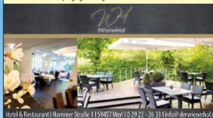
Hotel & Restaurant | Hammer Straße 1 | 59457 Werl | 0 29 22 26 33 | info@derwienerhof.de

Bei sommerlichen Temperaturen kann die stimmungsvolle und großzügige Terrasse des Wiener Hof's ausgiebig genossen werden. Exklusiv und exquisit präsentiert sich das Restaurant, ohne dabei abgehoben zu sein. Neben den kulinarischen Köstlichkeiten von der regulären Karte, können der Saison entsprechend auch weitere leckere Spargelgerichte genossen werden. www.derwienerhof.de