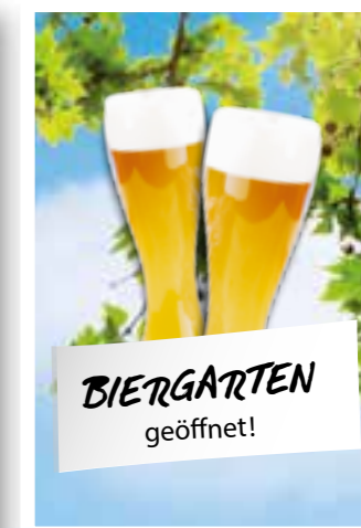
Seite 12 Gastronomie-Spezial