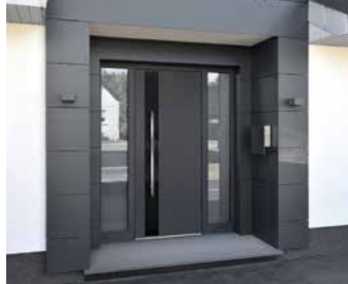
Eine spezielle Haustür-Serie vereint magische Glanzeffekte mit puristischem Chic.

Ebenfalls beliebt sind Holzverkleidungen. Wer auf die Vorteile des natürlichen Baumaterials nicht verzichten möchte, die Nachteile jedoch vermeiden will, kann den