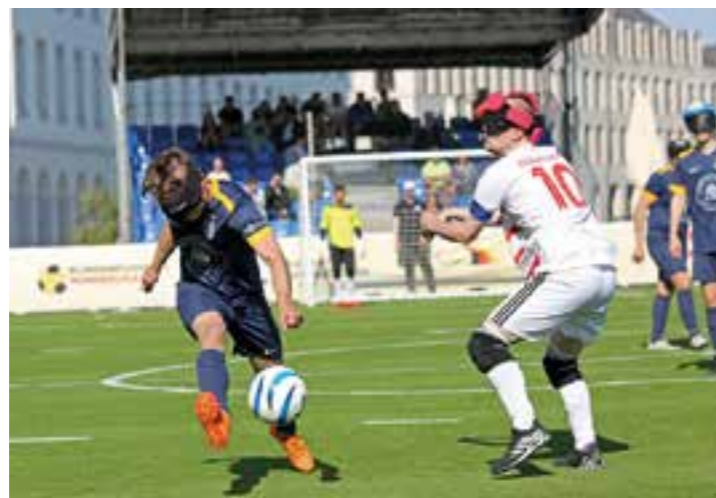
Gleich beim ersten Spiel der Saison trafen die Marburger elf Mal das gegnerische Tor.

Die HALLO SOEST-Redaktion staunte nicht schlecht, als die Presseinvitation zur Austragung eines Bundesliga-Spieltags im Blindenfußball ins Postfach flatterte. Grund genug für uns, diese Sportart, ihre Akteure und die Highlights dieses Events einmal in den Fokus zu rücken.