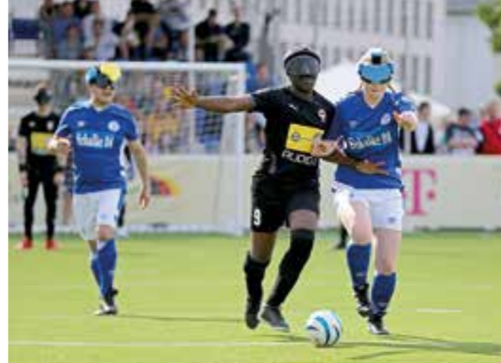
Schalke 04 mühte sich beim Saisonauftakt gegen BSV Wien.

Natürlich hoffen alle Beteiligten, dass dieser spannende Para-Sport trotz des Termins gleich zu Beginn der Sommerferien viele Zuschauer:innen ins Jahn-Stadion locken wird. Denn neben interessanten sportlichen Begegnungen wird auch fürs leibliche Wohl gesorgt und einige weitere Highlights für die Besucher:innen sind ebenfalls in Planung. Zudem wird das Bildungswerk des Landschaftsverbandes Westfalen-Lippe für Sehbehinderte mit einem Informationsangebot vor Ort sein. Neben dem Ausrichter BVB sind auch weitere Akteure beteiligt, um dieses Event zu etwas Besonderem zu machen: die Heinz-Kettler-Stiftung, der Deutsche Behinderten-Sportverband, der SV Westfalia Soest und der DFB-Stützpunkt Soest sowie die Stadt Soest mit der Abteilung Schule und Sport. Zur Schirmherrschaft erklärte sich Bürgermeister Dr. Eckhard Ruthemeyer bereit, der bekanntermaßen genauso fußball- wie kirchensportverrückt ist und vermutlich