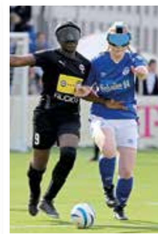
Seite 4 Blindenfußball