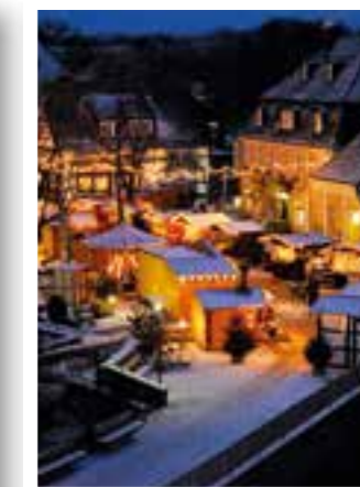
Seite 44 Winterfunkeln Bad Sassendorf