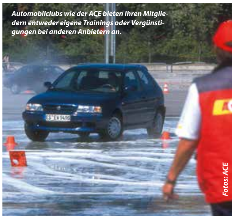
Automobilclubs wie der ACE bieten Ihren Mitgliedern entweder eigene Trainings oder Vergünstigungen bei anderen Anbietern an.

Mitte bis Ende November bekommen die meisten Fahrzeughalter Post von Ihrem Versicherer mit der Rechnung für das kommende Jahr. Nicht selten mit einer bösen Überraschung, wenn man beispielsweise wieder ein weite-