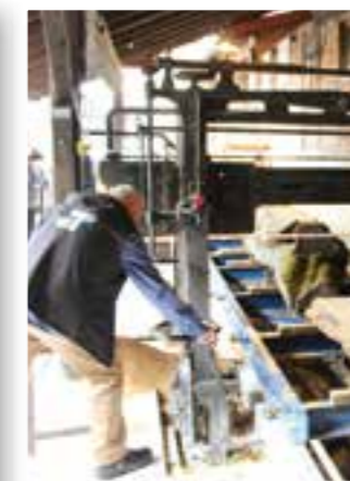
Seite 42 "Ensembles Stüttings Mühle" eröffnet