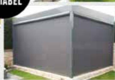
WOHLFÜHLEN ZU JEDER JAHRESZEIT

MASSGESCHNEIDERTE ÜBERDACHUNGEN SO INDIVIDUELL WIE SIE