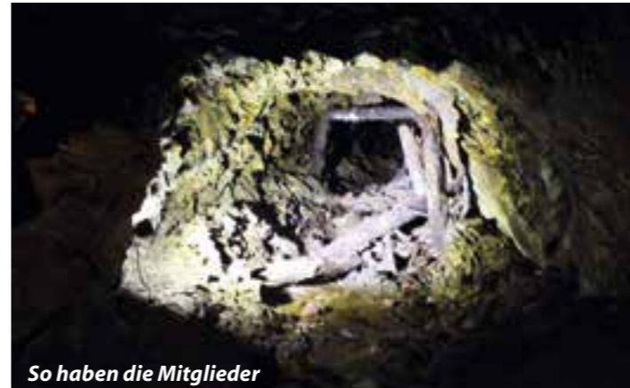
So haben die Mitglieder den Bunker vorgefunden.

liebten Naturspielplatz für Kinder geworden. Außerdem bildet er zusammen mit dem neu errichteten Damm einen Hochwasserschutz für das „Historische Ensemble Stüttings Mühle“, der sich in diesem Sommer schon einmal bewähren konnte.