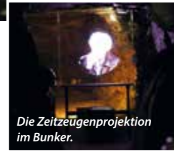
Die Zeitzeugenprojektion im Bunker.

liebten Naturspielplatz für Kinder geworden. Außerdem bildet er zusammen mit dem neu errichteten Damm einen Hochwasserschutz für das „Historische Ensemble Stüttings Mühle“, der sich in diesem Sommer schon einmal bewähren konnte.