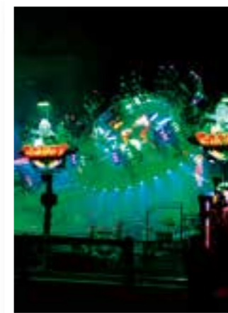
Seite 14 Kirmes-Highlights