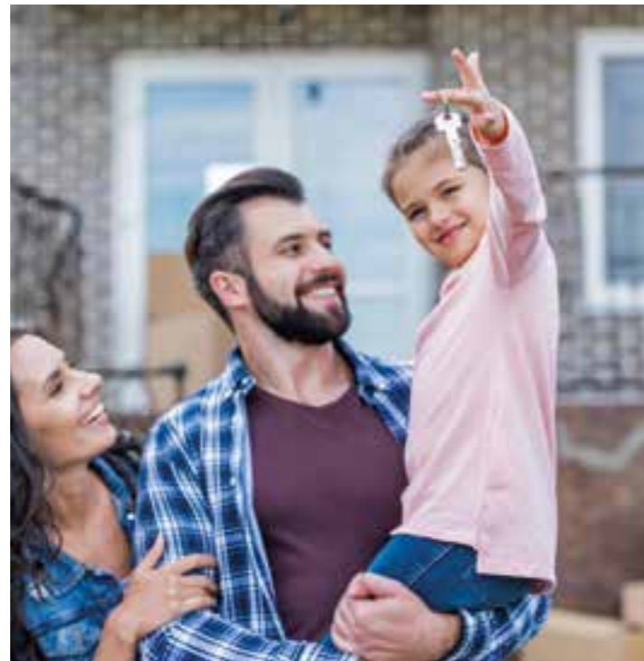
Bis sie die Schlüssel endlich in der Hand halten, müssen Hausbesitzer in spe einiges beachten.

„Zum Kaufpreis für das Haus oder die Eigentumswohnung kommen noch diverse Kaufnebenkosten für die Grunderwerbsteuer, die Maklerprovision und den Notar hinzu“, erklärt Rechtsanwalt Thiemo Loof. Insgesamt können sich diese je nach Objekt und Bundesland auf bis zu 13 Prozent des Immobilien-Kaufpreises belaufen. Im Hinblick auf die Maklerprovision gilt seit Ende 2020: Der-