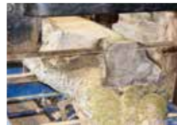
Auch das Sägen mit Wasserkraft wurde bei der Eröffnung demonstriert.

Unternehmen für ihre „überwältigende Spendenbereitschaft“ für die Wester-Renaturierung am Ensemble zu danken, die zeitgleich von Stadt und Kreis vorangetrieben wurde. Sitzbänke, Schautafeln, 50 verschiedene Obstbäume für eine Streuobstwiese und weitere 60 Büsche und Bäume konnten dank der Spenden aufgestellt bzw. gepflanzt werden. Der kleine Seitenarm sei zu einem be-