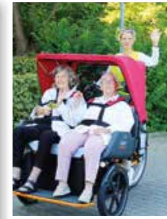
Seite 24 50 Jahre St. Michael Werl