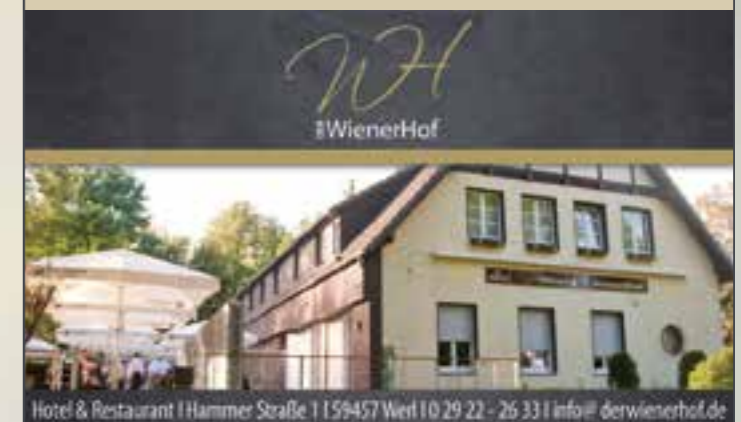
Hotel & Restaurant | Hammer Straße 1 | 59457 Werl | 0 29 22 - 26 33 | info@derwienerhof.de