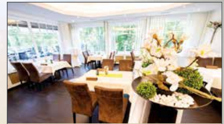
Genuss, Ambiente und Sicherheit – dafür steht der Wiener Hof auch im goldenen Herbst und drinnen, wenn das Wetter schlechter sein sollte. Sogar dann lohnt ein Blick nach draußen in den herbstlichen Kurpark. In der wohligen Atmosphäre und der durch die entsprechende Anlage gefilterten Luft können die Gäste die kulinarischen Köstlichkeiten geschützt genießen. Im Oktober gibt es leckere Ente als Special. www.derwienerhof.de

Die Kartoffeln mit Schale kochen bis sie weich sind. Diese nun