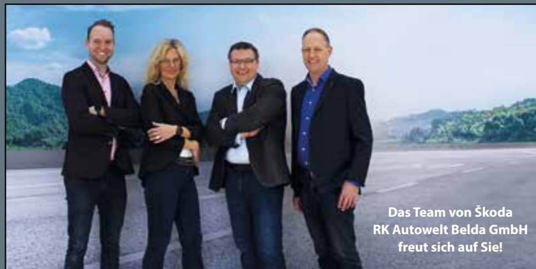
Das Team von Škoda RK Autowelt Belda GmbH freut sich auf Sie!

tails, die jeden Fahrer in Verzückung bringen, sind 13 in der Neuaufgabe brandneu, z.B. die umklappbare Beifahrersitzlehne und Multifunktions tasche unter der Gepäckraumabdeckung, oder ein USB-C-Anschluss am Innenspiegel (ideal für eine Dashcam) sowie Smartphone-Taschen für Fondpassagiere. Karten- und Stifthalter im Ablagefach vor dem Schalthebel hat es zuvor noch bei keinem Škoda gegeben, ebenso ein klappbares flexibles Ablagefach im Kofferraum. Bei so vielen tollen Möglichkeiten bleibt nur eins: eine Probefahrt! Vereinbaren Sie am besten gleich einen Termin und überzeugen sich vom neuen Fabia.