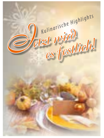
Seite 32 Kulinarische Highlights