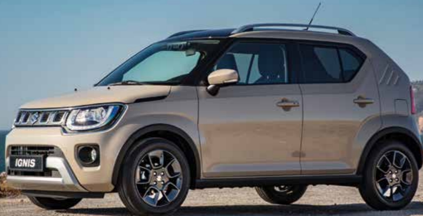
Micro-SUV: der Suzuki Ignis.

Sportiv darf er aussehen, aber in niedrige Sitze plumpsen möchten Sie nicht? Willkommen in der Welt der Komfort-Kfz!