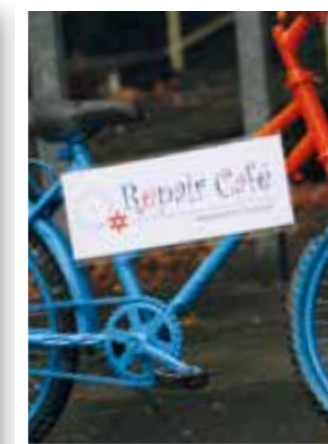
Seite 50 Repair Café in Warstein