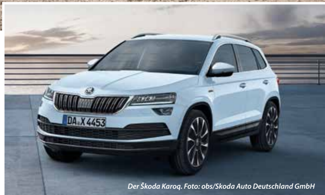
Der Škoda Karoq.

Irgendwann ist wohl jeder reif für ein bequemes Auto. Eins, das Platz bietet, aber auch jeden erdenklichen Komfort. Und dieser fängt bereits beim Einsteigen und Sitzen an. Sich tief in den Sportsitz fallen lassen ist das eine, aber wieder herauskrabbeln kann schon zur Herausforderung werden, wenn man nicht mehr so geschmeidig ist wie mit 20. Die gute Nachricht: Mittlerweile hat so ziemlich jeder Hersteller passende Modelle im Portfolio. Vor allem ist da für jeden Geschmack etwas dabei, vom höheren Mini-Van bis zum kraftvollen SUV. Egal, ob Sie einen kleinen oder großen Wagen fahren möchten: Der Markt hat sich in den letzten Jahren sehr auf die Wünsche derer eingestellt, die gern hoch sitzen und den Überblick haben möchten.