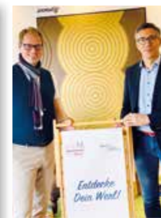
Seite 34 Führungsduo Werler Wirtschaftsring