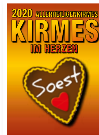
Seite 6 Kirmes im Herzen