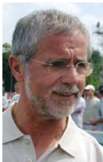
Der ehemalige Fußballstar Gerd Müller ist Gegenstand eines interaktiven Vortrags.

Die VHS Soest bietet ab sofort Vorträge zu unterschiedlichen Themengebieten im Livestream an. Das Angebot ist kostenfrei und kann von allen Bürgerinnen und Bürgern genutzt werden - unabhängig davon, ob man bereits Kundin oder Kunde der VHS ist oder nicht.