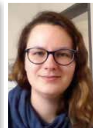
Seite 42 Leben in Quarantäne