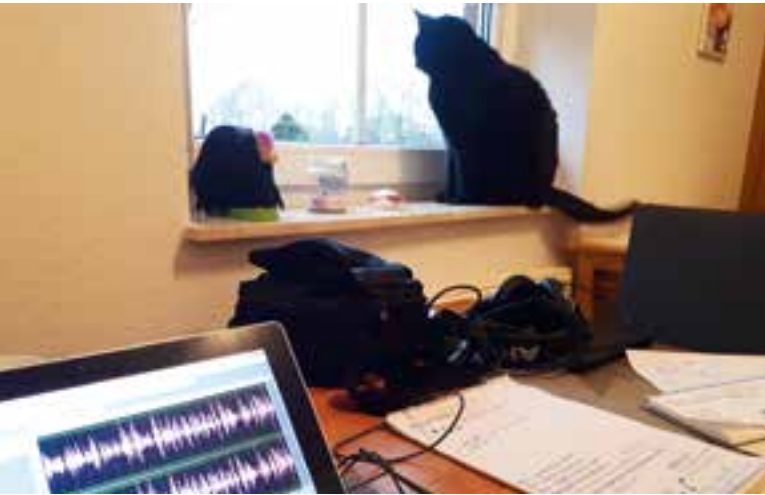
Improvisierter Arbeitsplatz in der Quarantäne: Kater Sammy torpedierte so manche Aufnahme mit lautem Miauen.

Leben in der Quarantäne: Eine Betroffene erzählt