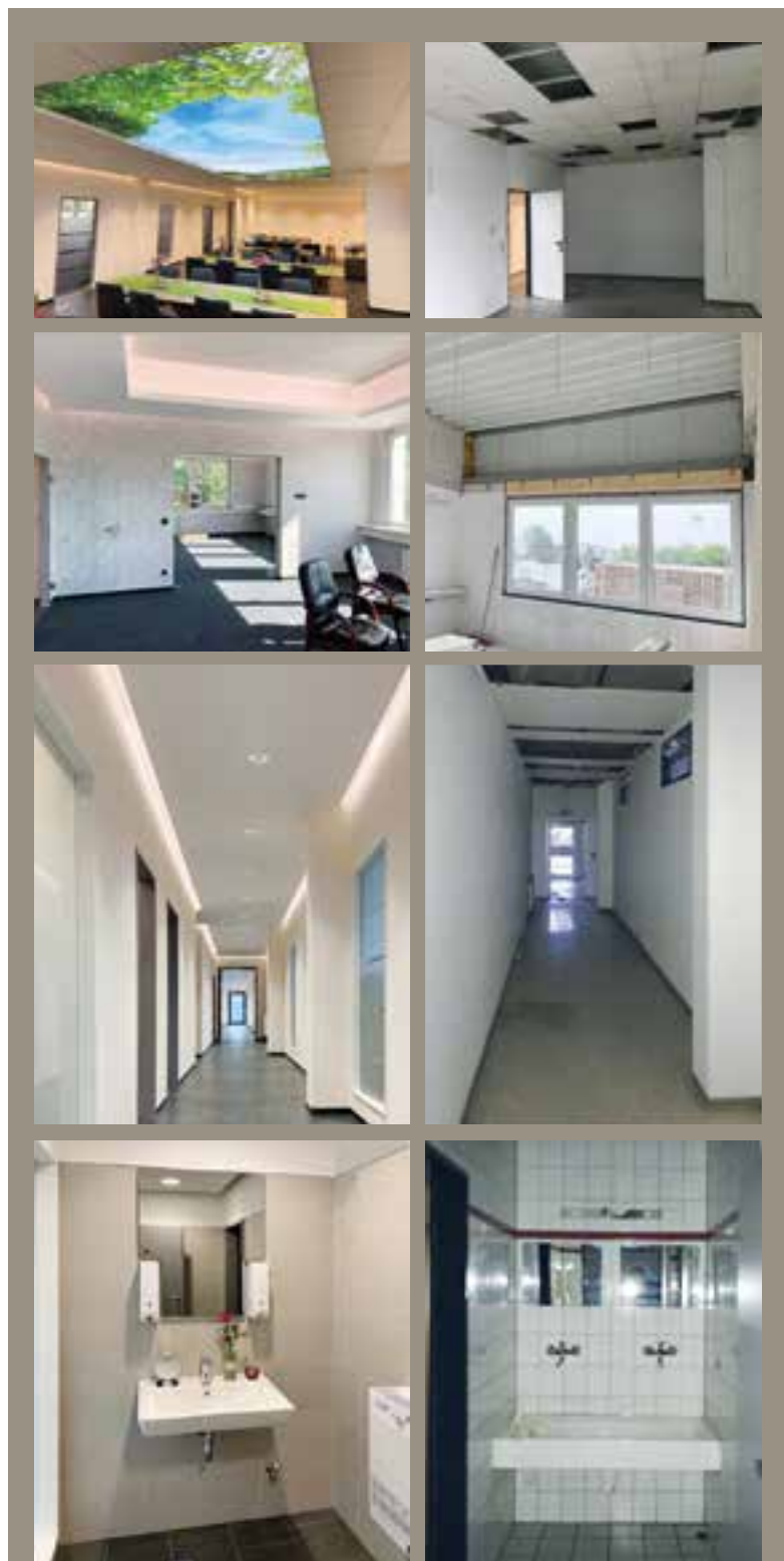
Planung + Fotos Architekturbüro Alexander Hopf M.A. (Arch)