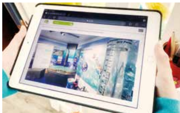
Das Liz ist jetzt auch per 360-Grad-Panorama-Rundgang virtuell für Groß und Klein erlebbar.

Wegen der Corona-Pandemie ist das Freizeitangebot im Kreis Soest zurzeit stark eingeschränkt. Auch die interaktive Erlebnisausstellung des Landschaftsinformationszentrums (Liz) in Möhnesee-Günne zu den Themen Wasser und Wald ist für Besucher geschlossen. In Zusammenarbeit mit dem Kreis Soest und der Telekom entstand im Rahmen des Inklusionsprojektes „Smart4You“ ein 360-Grad-Panorama-Rundgang durch das Liz, der passenderweise gerade jetzt fertig gestellt wurde.