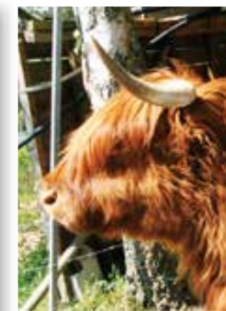
Seite 28 Unerwünschte Oase