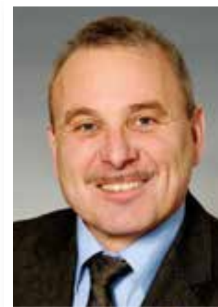
Seite 4 Steht die Kirmes auf der Kippe?