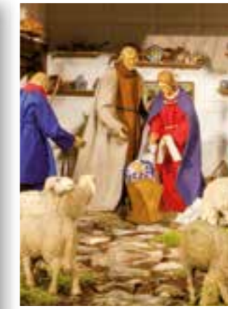
Seite 6 Auf zum Weihnachtsmarkt Soest