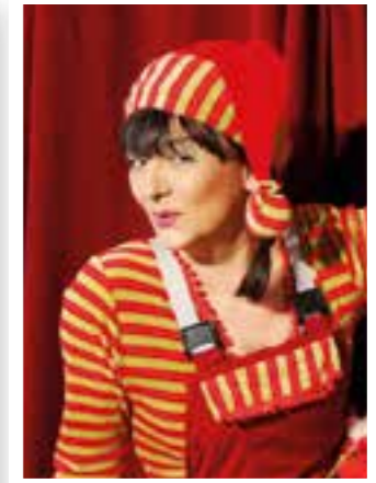
Seite 34 Viel los in Bad Sassendorf