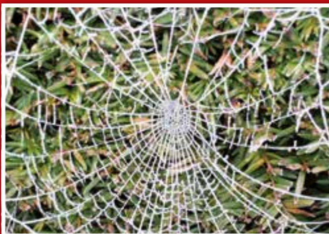
"Der erste Frost zaubert Spitzendeckchen"

Schicken Sie uns auch Ihr Lieblingsfoto: info@fkvverlag.com