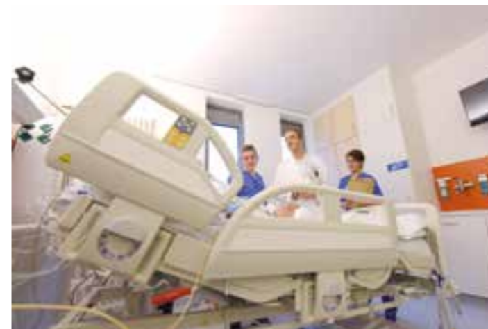
Ein Haus für alle Generationen: Dieser Anspruch soll auch nach einer Fusion erhalten bleiben.

Gütersloh nur der Beginn einer Reihe von Absagen an Kliniken mit ähnlichen Plänen darstellt. Von 309 geprüften Transaktionen habe es nur sieben Absagen in den letzten 16 Jahren gegeben, heißt es auf der Website des Kartellamts. „Ziel der Fusionskontrolle ist es darum in erster Linie, den Wettbewerb um die Qualität der Versorgung der Patienten zu erhalten. Entscheidend dabei ist, dass den Patienten vor Ort hinreichende Aus-