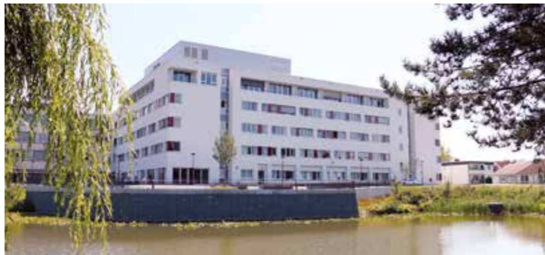
Potenzieller Standort des künftigen neuen Krankenhauses: das Klinikum Stadt Soest.

Mit diesen Bestrebungen scheint nun ein Todesurteil für viele kleinere Kliniken gefallen zu sein. Die beiden Häuser in Soest zählen mit Sicherheit nicht zu den kleinsten, doch stellt sich in Anbetracht der allgemeinen politischen Entwicklung die Frage, ob auch ohne die finanzielle Schiefelage des Klinikums eine