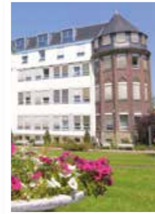
Seite 4 Soest: Zur Klinikfusion