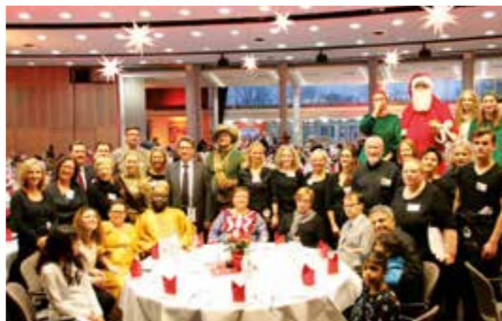
Im vergangenen Jahr blickte die versammelte Presse beim Patenmahl in lauter glückliche Gesichter.

„Patenmahl – Bürger für Bürger“ lautet das Motto. Das bewährte Konzept der Aktion bleibt unverändert. Paten spenden den bedürftigen Menschen aus der Region symbolisch die Mahlzeit. Für eine Spende über 20 Euro kann eine einkommenschwache Person am Veranstaltungs-