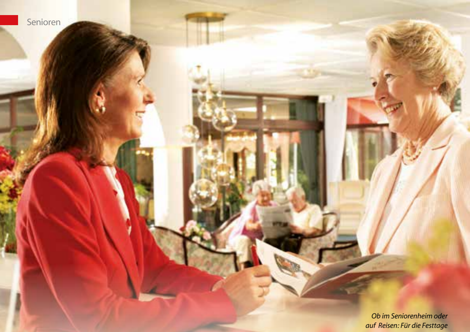
Ob im Seniorenheim oder auf Reisen: Für die Festtage gibt es viele Möglichkeiten, dem Alleinsein zu entfliehen.