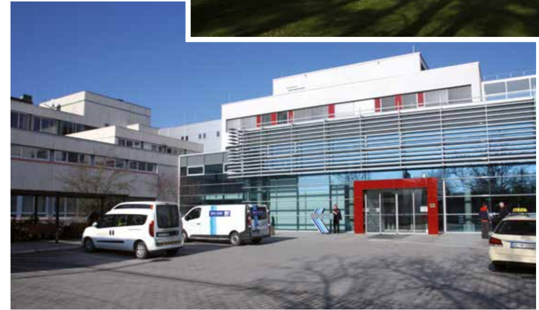
Das Klinikum Stadt Soest verfügt über 316 Betten, 1.000 Mitarbeiter kümmern sich um die Patienten.