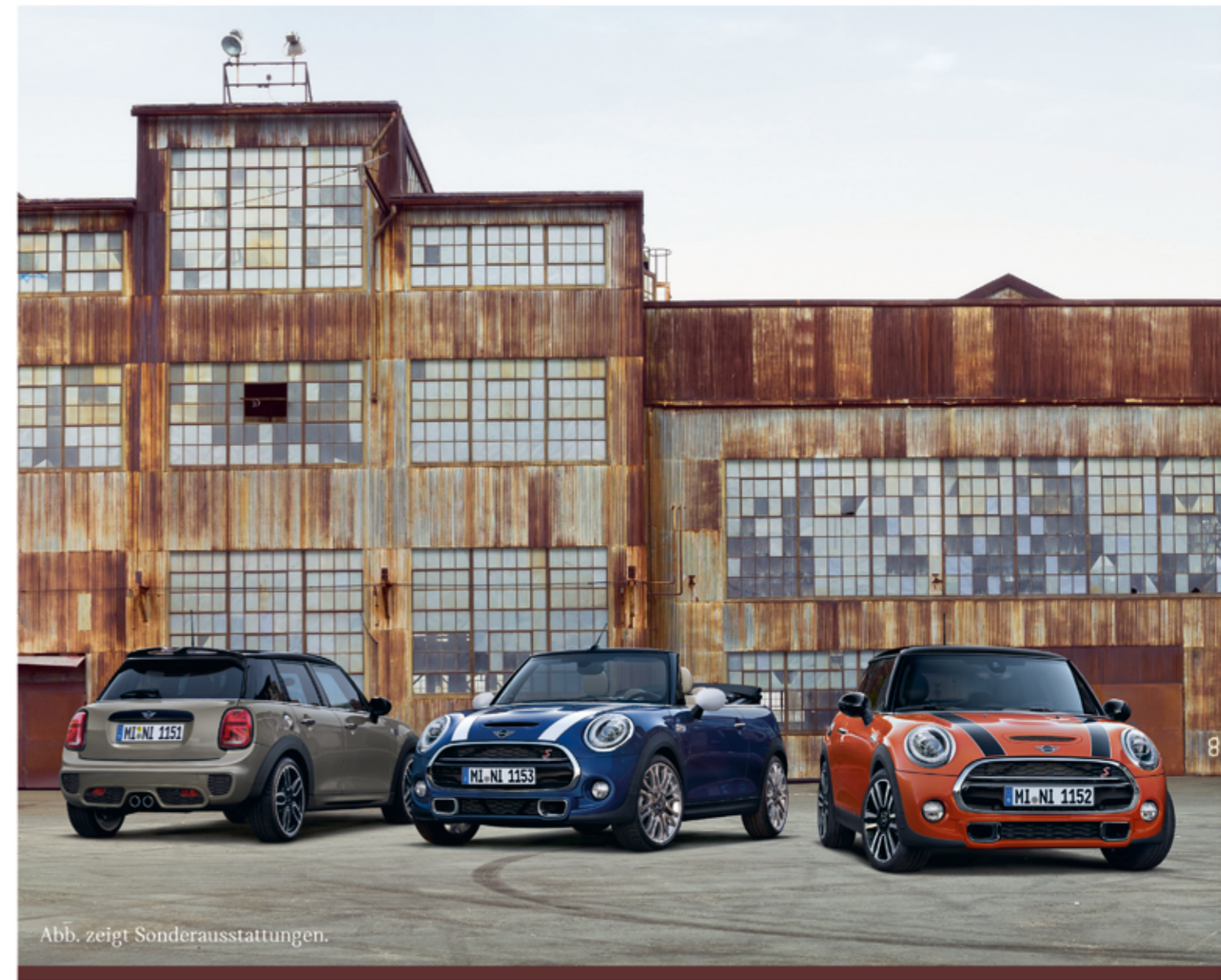
Abb. zeigt Sonderausstattungen.