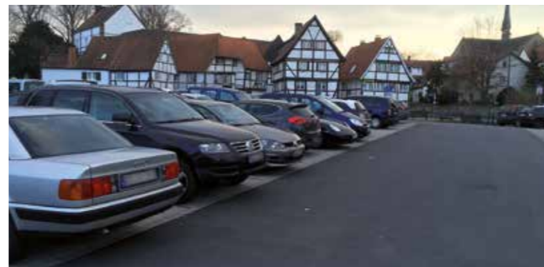
Parken am Großen Teich: Der neue Parkplatz findet mit seiner guten Lage zur Altstadt viele Freunde.

„Dauerparken soll nicht auf Premiumpätzen geschehen“, steht für Peter Wapelhorst fest. Der Beigeordnete der Soester Stadtverwaltung begründet Änderungen der Parkraumbewirtschaftung am Dasselwall. Mit diesem Thema wird sich in der kommenden Woche auch der Stadtentwicklungsausschuss befassen. Konkret geht es darum, für einen Teilbereich der Parkplätze im Bereich Stadthalle/Hotel Susato/ Jahnstadion und Hotel am Wall ein Parkgebühren-Tarifsystem einzuführen.