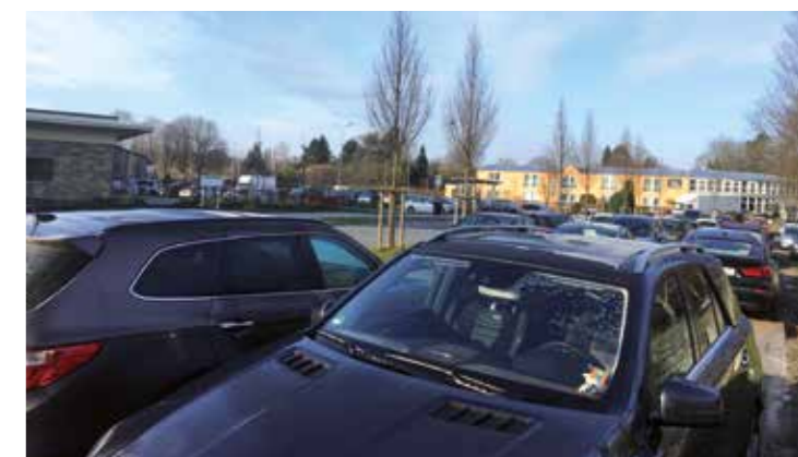
Parken in der Soester Innenstadt ist begehrt: Darum sollen die Plätze am Dasselwall künftig bewirtschaftet werden.

Die aktuell gültige Parkgebührenordnung ist 17 Jahre alt. Mit der nun anstehenden Modifizierung soll es nicht darum gehen, mehr Parkgebühren in die Stadtkasse zu spülen, sondern eine Lenkungswirkung zu erzielen, heißt es im Rathaus. Änderungen sollen auch im Bereich Brüdertor, Kohlbrink vorgenommen werden. Insbesondere durch die bald anstehende Eröffnung des Parkhauses Kress mit 100 Stellplätzen wird es Veränderungen geben. Für diesen Bereich sollen „keine weiteren Anreize für den Parkraum geschaffen werden“: Vorgeschlagen wird, diesen Bereich mit dem Gebührentarif der Kernstadt (erste Stunde frei, vier Euro für drei Stunden) gleichzusetzen.