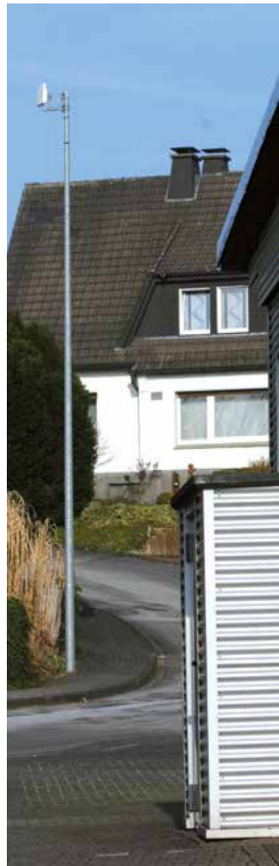
Ob der Richtfunk-Mast neben der Werkstatt die Lösung des Internet-Problems bringt?