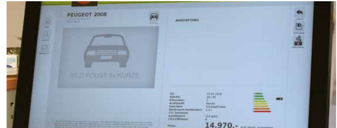
So macht keinem Kunden die Auto-Suche auf dem modernen Verkaufs-Display Spaß.