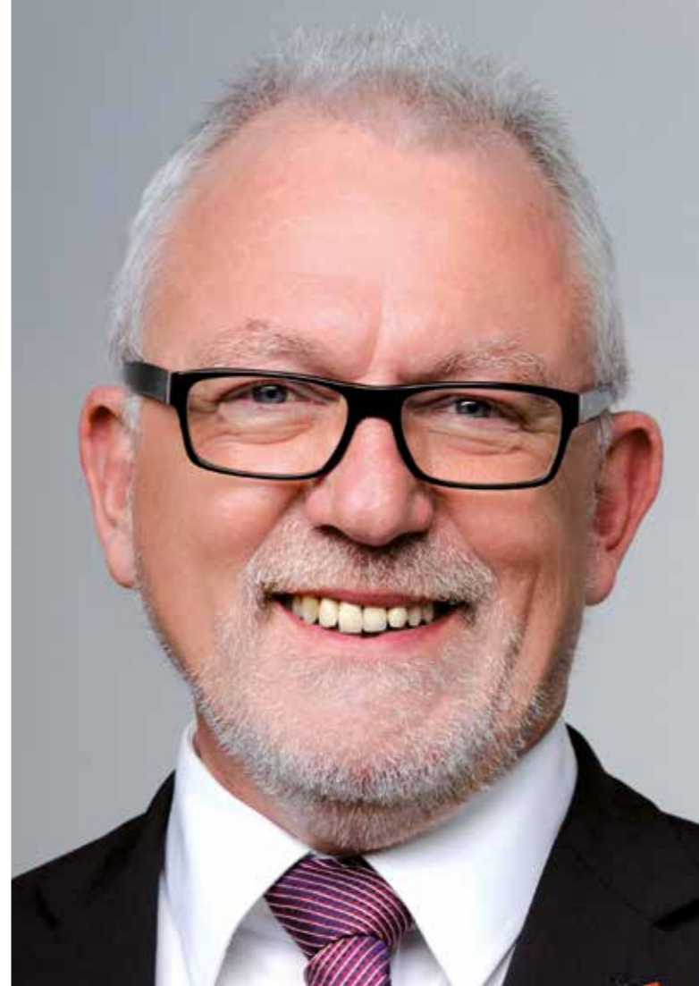
Wolfgang Hellmich (SPD)

„Wenn es der neuen unionsgeführten Bundesregierung gelingt, die Situation der Menschen auf dem Lande spürbar zu verbessern, namentlich in den Bereichen Digitalisierung, Bildung, Verkehrsinfrastruktur und medizinische Versorgung Fortschritte zu bewirken und wenn es ferner gelingt, den Menschen das Gefühl und Vertrauen zu vermitteln, dass unsere staatlichen Institutionen wieder die Kontrolle über unser Land zurückgewonnen haben, dann bin ich zuversichtlich, dass