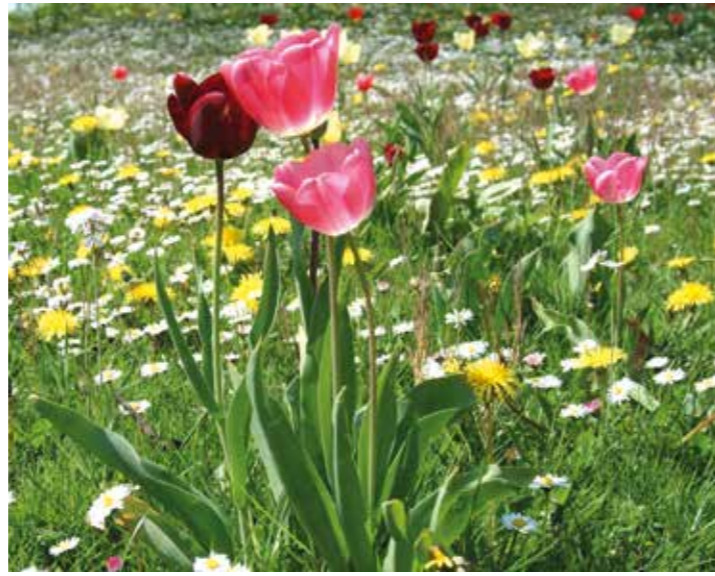
Für das leibliche Wohlergehen der Besucher sorgen der Ev. Johannes-Kindergarten aus Neungeseke und der Kindergarten „Tausendfüßler“ aus Bettinghausen mit ihrem Waffel-Café.

Den Charity-Stand im Foyer des Tagungs- und Kongresszentrums betreut dieses Mal der internationale Frauentreff Soest, der es sich zur Aufgabe gemacht hat, Hilfe zur Integration zu leisten. Hier werden Handarbeiten aus verschiedenen Nationen ausgestellt sein.