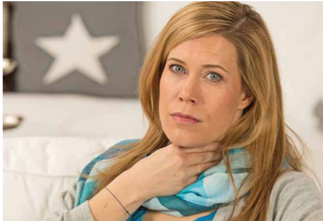
Menschen mit Sprach-, Sprech- und Stimmproblemen sind bei Sprachtherapeuten und Logopäden gut aufgehoben.

Kommunikation bedeutet Austausch und Teilhabe. Wesentliche Elemente von Kommunikation sind die Sprache, das Sprechen und die Stimme. Liegen hier Störungen vor, können sich Betroffene nur eingeschränkt mit anderen austauschen und ihnen bleiben Teilbereiche des sozialen Lebens verwehrt. Aktuellen Studien zufolge weisen ein Viertel aller dreieinhalb bis vierjährigen deutschsprachigen Kindern Sprachentwicklungsverzögerungen auf.