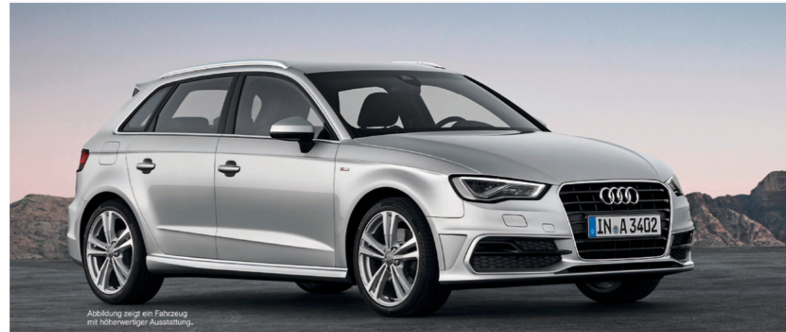
Abbildung zeigt ein Fahrzeug mit höherwertiger Ausstattung.