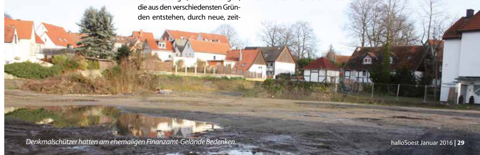
Denkmalschützer hatten am ehemaligen Finanzamt-Gelände Bedenken.