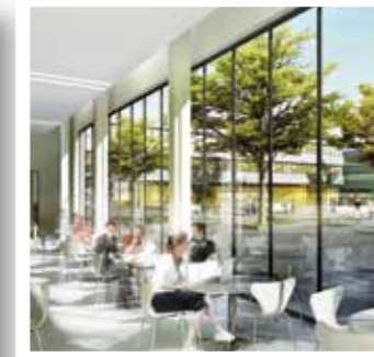
Kreis Soest Seite 10