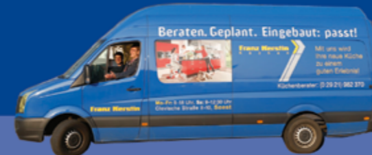
auf dem Weg zu Ihnen: Hartmut Riede und Kai Hillefeld