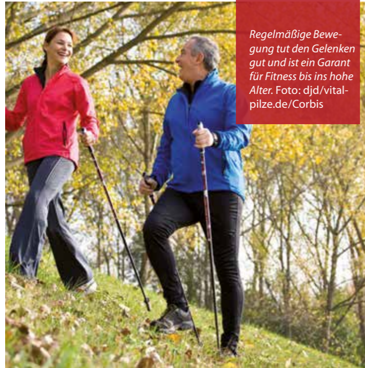
Regelmäßige Bewegung tut den Gelenken gut und ist ein Garant für Fitness bis ins hohe Alter.