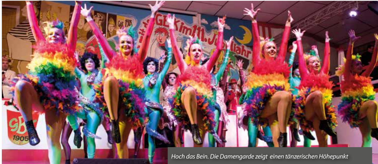
Hoch das Bein. Die Damengarde zeigt einen tänzerischen Höhepunkt