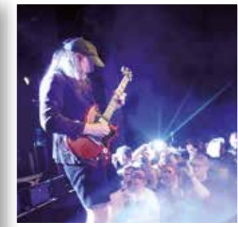
Soest Seite 23