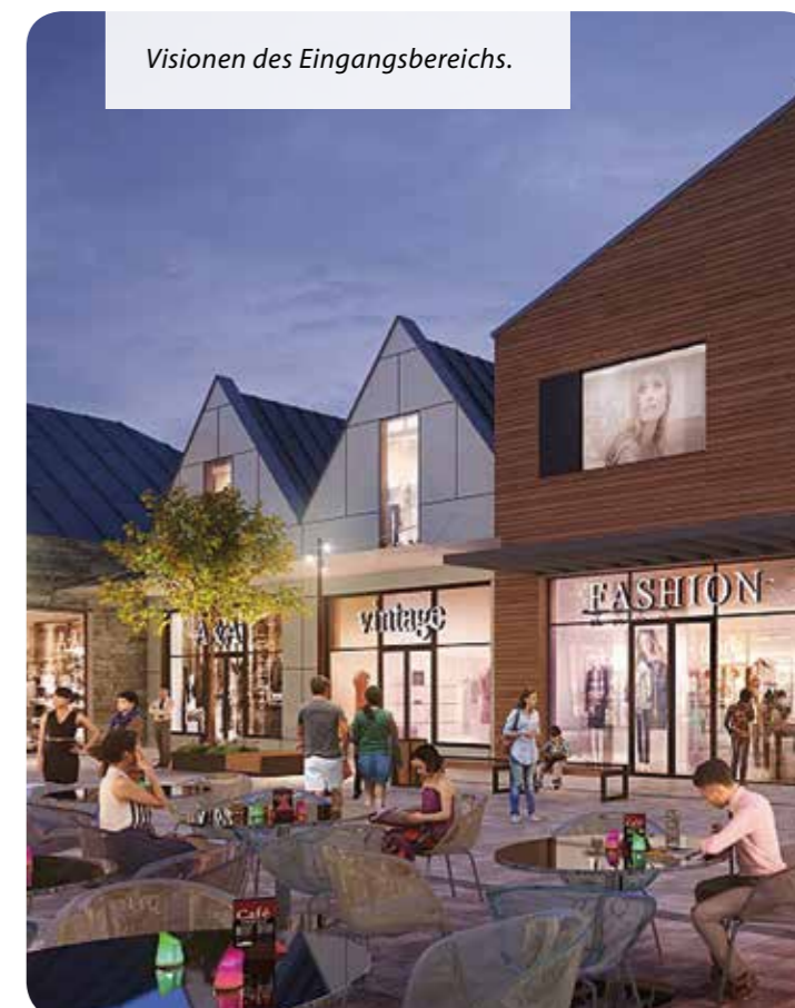
Typisch für die Region: Baumaterialien und Baustile sollen Tradition und Moderne verbinden.