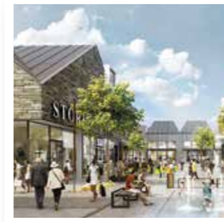
Werl Seite 4