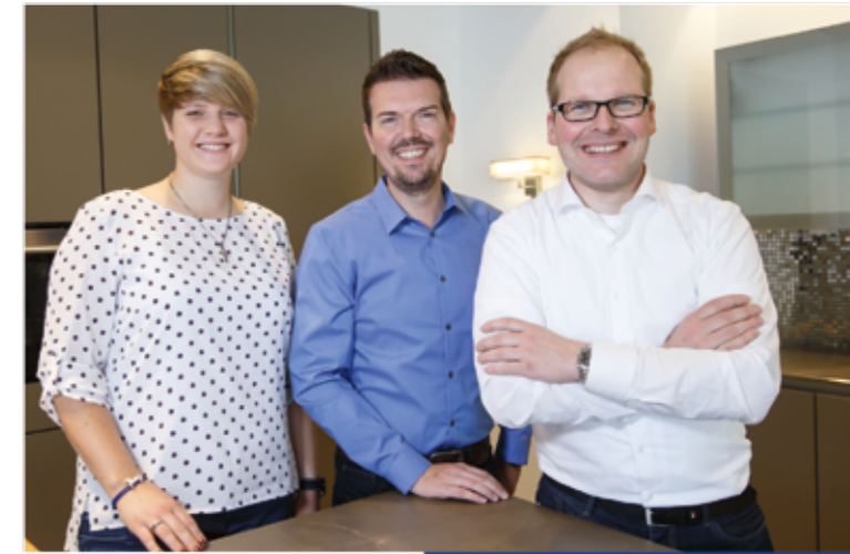
Wir sind Ihr Berater-Team

Das liefert auch die neueste Generation Dampfgarer-Backöfen mit inte-