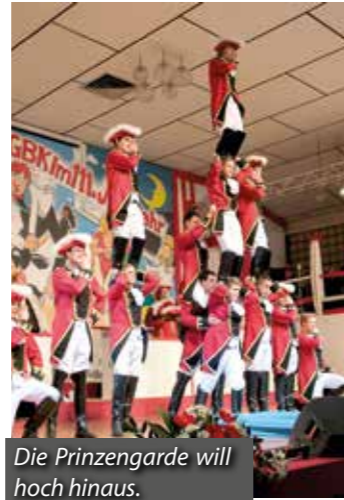
Die Prinzengarde will hoch hinaus.