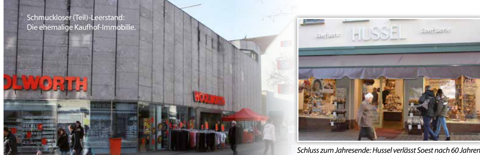
Schluss zum Jahresende: Hussel verlässt Soest nach 60 Jahren.

Schmuckloser (Teil)-Leerstand: Die ehemalige Kaufhof-Immobilie.