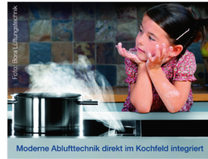
Moderne Ablufttechnik direkt im Kochfeld integriert

„Erst beim genauen Hinschauen und wenn Sie in Ihrer neuen Küche aktiv werden, entdecken Sie die vielen raffinierten Details, die Ihre Küche zu etwas Besonderem machen und die Sie jeden Tag aufs Neue begeistern werden.“