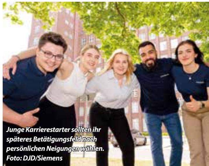
Junge Karrierestarter sollten ihr späteres Betätigungsfeld nach persönlichen Neigungen wählen.

Das Thema Berufswahl ist für Schulabsolventen kein leichtes: Lediglich 37 Prozent von 1.666 Befragten schätzen die Unterstützung bei ihrer beruflichen Orientierung als ausreichend ein. Das zeigt eine Studie der Bertelsmann-Stiftung aus 2022.