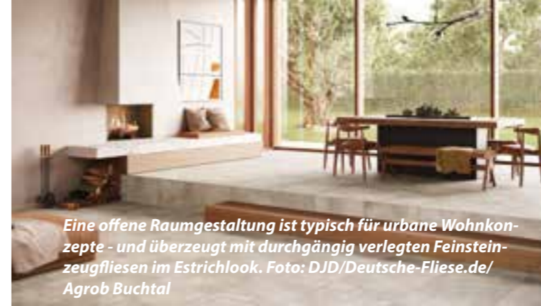
Eine offene Raumgestaltung ist typisch für urbane Wohnkonzepte - und überzeugt mit durchgängig verlegten Feinsteinzeugfliesen im Estrichlook.

Viele Baufamilien übernehmen Trockenbau, Fußbodenbeläge sowie Maler- und Tapezierarbeiten selbst. Und mit etwas handwerklichem Geschick können Heizungs- und Klempnerarbeiten in Eigenregie erfolgen. Wer auf Nummer sicher gehen will, lässt besonders bei technischen Gewerken lieber den Profi ran.