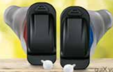
quiX von Audio Service