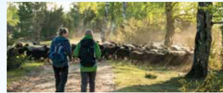
Eine Auszeit vom gewohnten Trott: Die naturbelassenen Pfade der Lüneburger Heide sind zu jeder Jahreszeit ein Erlebnis.

Ostern gehört zu den beliebten Reisezeiten im Jahr. Um das christliche Fest fallen die Schulferien und viele Reiseanbieter locken mit verführerischen und günstigen Angeboten zum super Preis. Egal ob ein Kurzurlaub, Wellness, Städtereise oder Pauschalurlaub: für jeden Geschmack ist etwas dabei. Wer sich sein Lieblingsziel sichern möchte, der sollte schon jetzt die Augen offen halten.