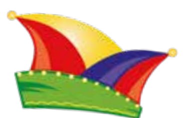
Narrenkappe: © christine krahl-stock.adobe.com

Viel Spaß beim Lesen und beim Karneval feiern wünscht Ihnen das Team von „Der Lippetaler“