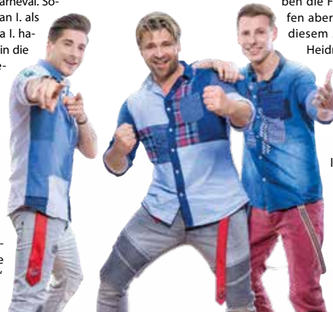
Pressefoto: „Die Zipfelbuben“

In Lippborg startet die erste große Sause am Samstag, 15. Februar, ab 20.11 Uhr, dann steht die Galasitzung des KKL im Festzelt auf der Marktwiese an. Das Pro-