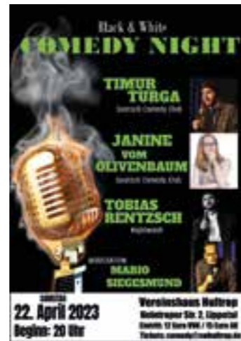
Plakat: SW Hultrop

Karten gibt's ab dem 27. März im Vorverkauf für 12 Euro online: E-Mail an comedy@swhultrop.de sowie an folgenden Vorverkaufsstellen: Feinbrennerei Northoff in Hultrop, Fleischerei Kleeschulte in Oestinghausen, Sanitär Brentrup in Lippborg und Gaststätte Meier in Herzfeld. An der Abendkasse kosten die Tickets 15 Euro.