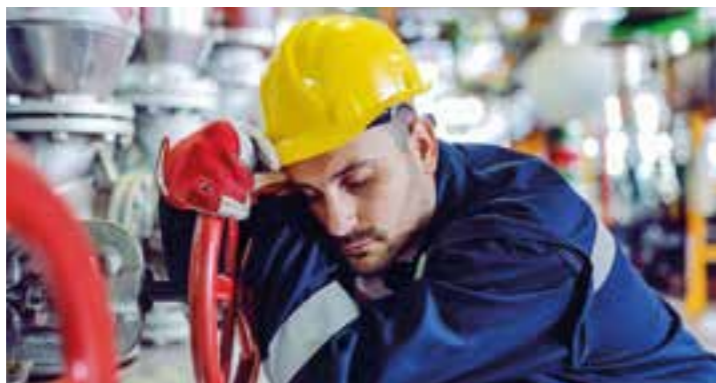
Übermäßig lange Arbeitstage kosten viel Kraft und können auf Dauer krank machen. Deshalb setzt das Arbeitszeitgesetz klare Grenzen.

Der Fachkräftemangel wird zunehmend zum Problem, tausende Arbeitsplätze in unterschiedlichsten Branchen sind aktuell unbesetzt. Für die Mitarbeiter in zahlreichen Unternehmen bedeutet das so manche Mehrbelastung, um die Arbeit überhaupt noch erledigt zu bekommen.