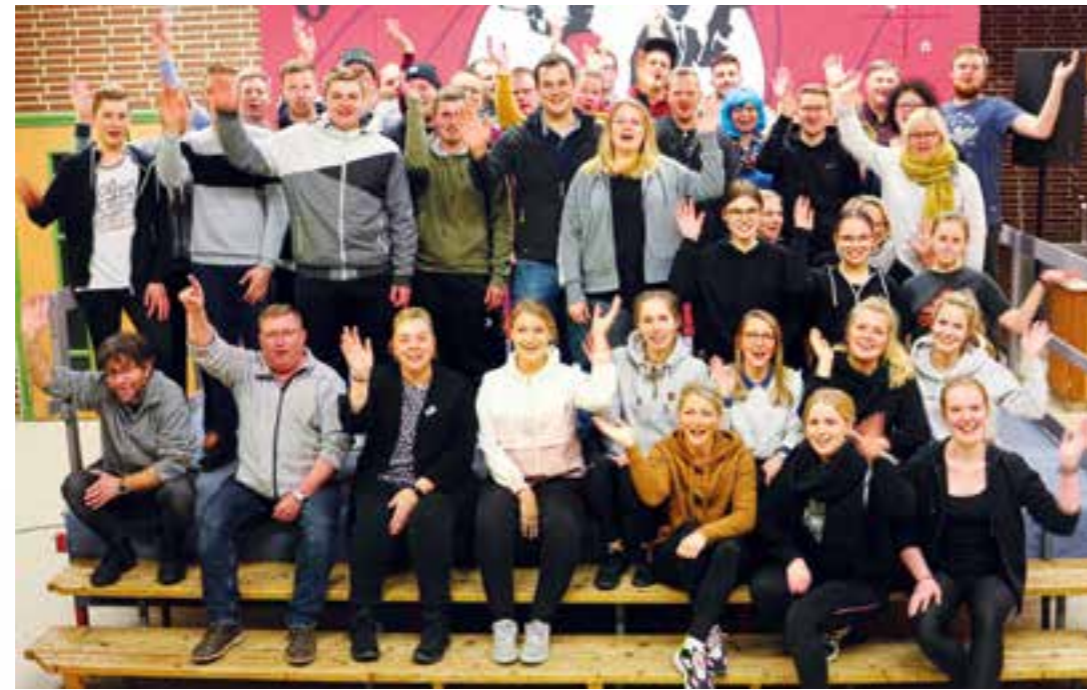
Die Akteure des Karnevals in HuHeiBü freuen sich auf die neue Session.