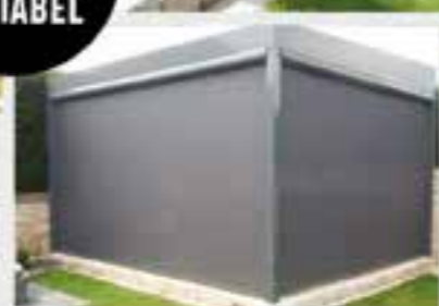
WOHLFÜHLEN ZU JEDER JAHRESZEIT