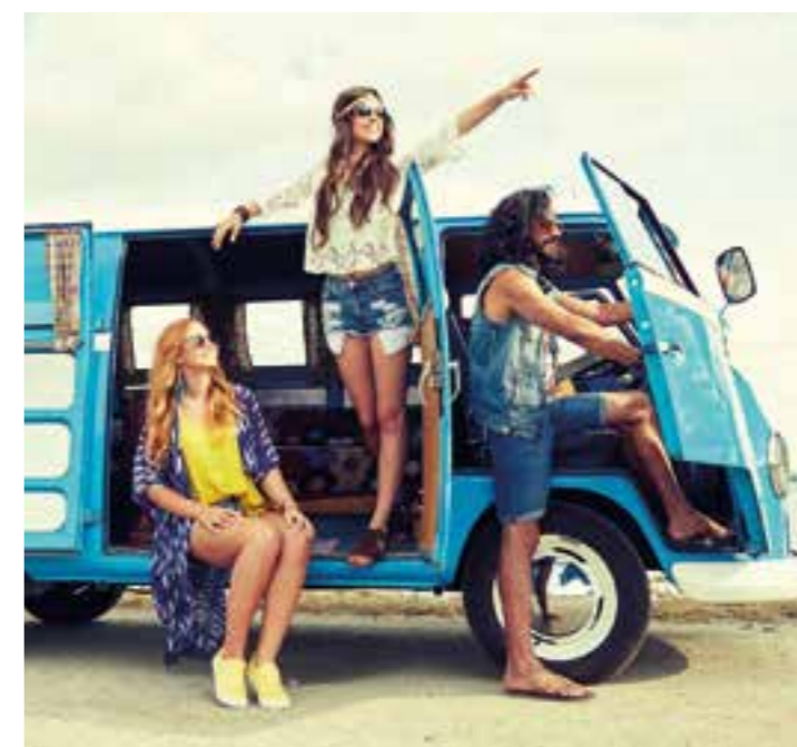
Bereits am Mittelmeer und in Osteuropa besteht das Risiko, sich mit Hepatitis A anzustecken.

Die Urlaubsplanung, insbesondere in den jetzigen Zeiten, sollte frühzeitig und mit Bedacht angegangen werden. Neben den Corona-Schutzmaßnahmen ist dabei auch der Schutz vor weiteren Krankheiten zu berücksichtigen, weshalb der Impfpass-Check ebenso wichtig ist wie eine gut ausgestattete Reiseapotheke. Bei beidem sollten sowohl das Reiseziel als auch die geplanten Aktivitäten berücksichtigt werden, da sich die erforderlichen Impfungen sowie benötigten Medikamente von Ziel zu Ziel unterscheiden können.