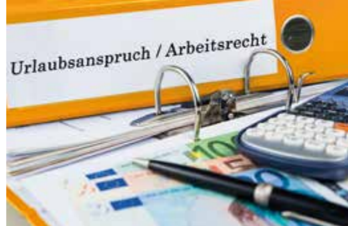
Der Anspruch auf Urlaubstage ist gesetzlich geregelt. Arbeitnehmerorganisationen können in Streitfällen beraten.

Das Gesetz gibt auch vor, dass Beschäftigte den Urlaub grundsätzlich im laufenden Jahr nehmen sollten. Resturlaub kann übertragen und bis 31.