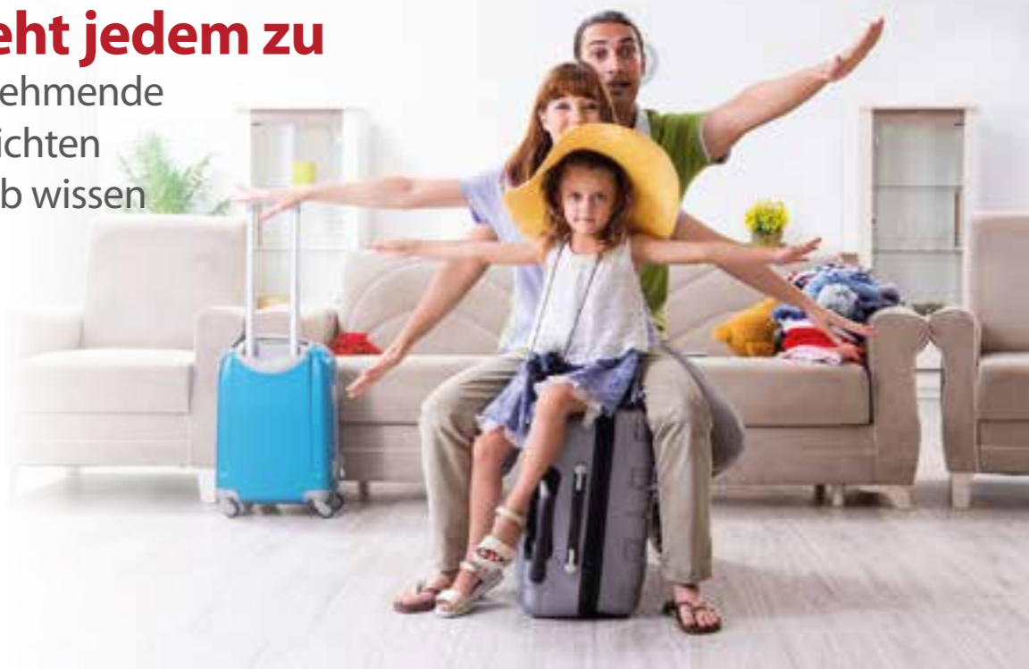
Endlich wieder rauskommen und Erholung finden: Die Rechte und Pflichten rund um die schönsten Wochen des Jahres sind im Bundesurlaubsgesetz beschrieben.

Erholung tut in diesen Zeiten besonders gut. Für den Sommer 2022 dürften viele Familien die erste weitere Reise seit Langem planen. Arbeitnehmer:innen haben ein Recht auf diese Auszeit, schließlich soll Urlaub dem Erhalt der eigenen Gesundheit und der Arbeitsfähigkeit dienen.