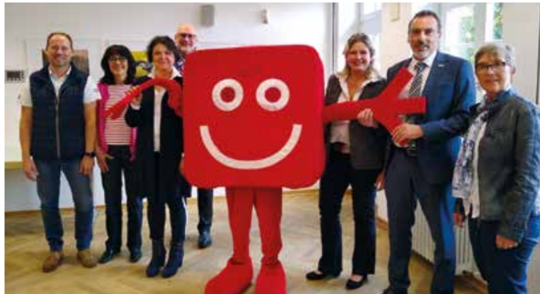
Gruppenbild mit Maskottchen: Vertreter von Gemeinde, Kreis, Trägern, Betreibern und den ausführenden Architekten freuen sich über die Entstehung zweier neuer Kitas.

Erweiterung des Betreuungsangebotes in Herzfeld und Lippborg