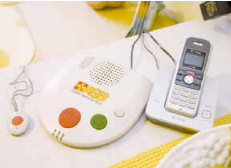
Ein Hausnotruf verschafft Ihnen ein sicheres Gefühl.