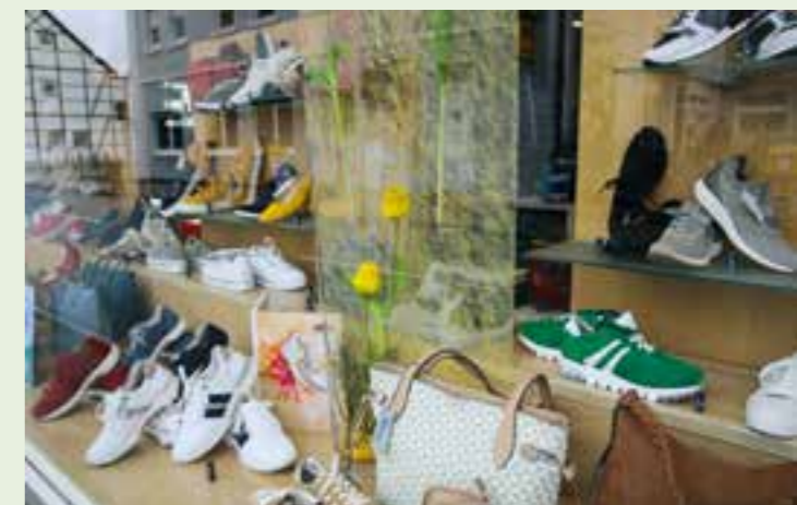
Anzeige: F.K.W. Verlag

Turnschuhe und Sneakers für sie und ihn füllen aktuell die Regale. Wer es etwas eleganter braucht, kann sich durch die modischen und schon recht leichten Halbschuhe probieren. Das freundliche und fachkundige Personal