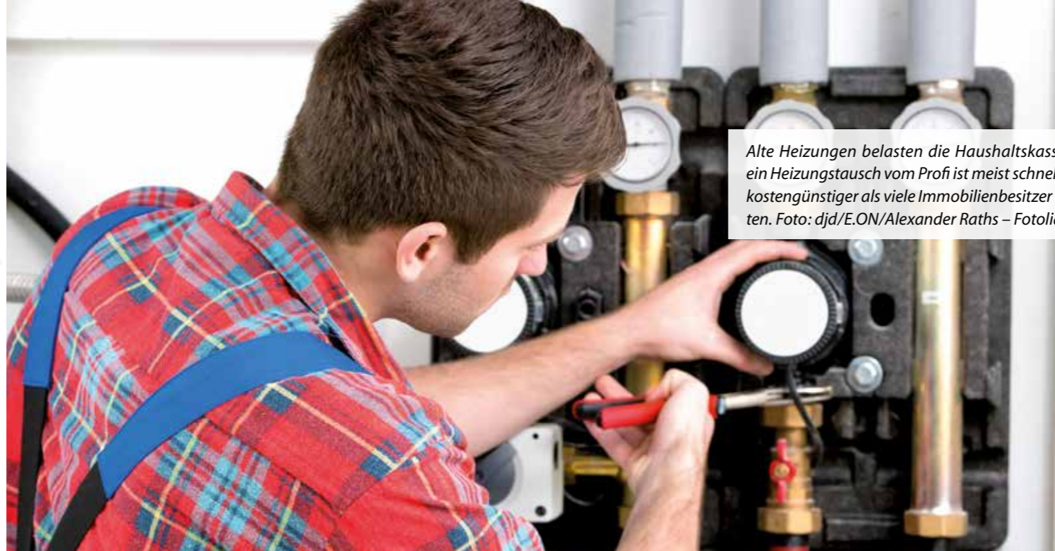
Alte Heizungen belasten die Haushaltskasse. Und ein Heizungstausch vom Profi ist meist schneller und kostengünstiger als viele Immobilienbesitzer vermuten.