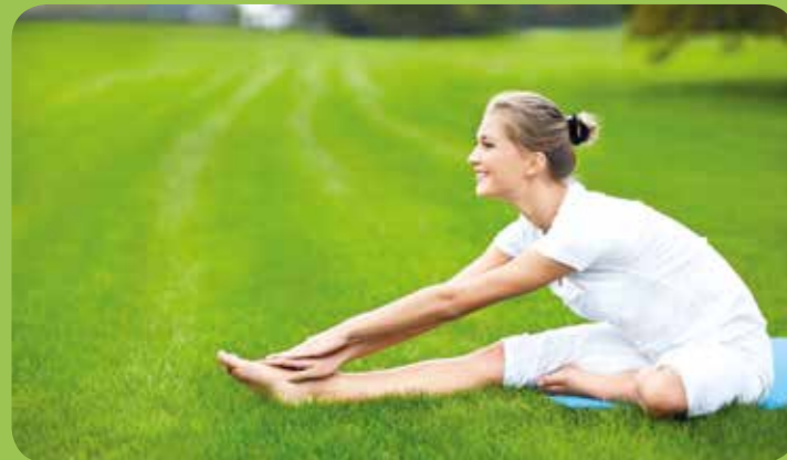
Gesundheit lässt sich erlernen: Ein spezielles Training zeigt Wege auf, wie man langfristig sein körperliches und seelisches Wohlbefinden stärken kann.

Der Gesundheitskurs umfasst theoretische wie praktische Elemente und wird von den Krankenkassen als Präventionskurs sowie als ergänzende Leistung zur ambulanten Rehabilitation anerkannt.