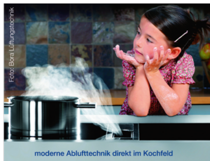
moderne Ablufttechnik direkt im Kochfeld