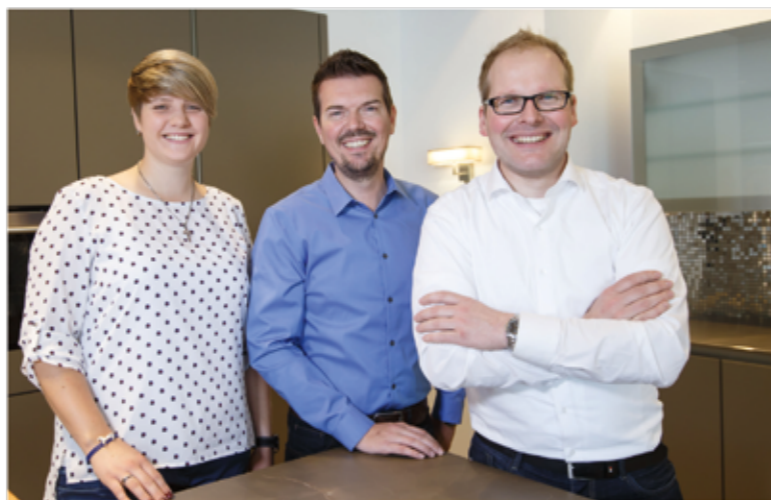
Wir sind Ihr Berater-Team