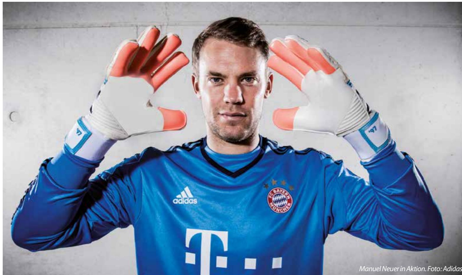
Manuel Neuer in Aktion.

Bleibe noch das Orakel zur Europameisterschaft: „Ich habe der ganzen Mannschaft und natürlich Manuel fest die Daumen gedrückt. Ich bin sicher, die ganze Region hat das auch getan“. Das klappte ja gegen Italien vorzüglich, dann kamen die „Handballspieler“ und zum Schluss patzte auch Sohn Manuel einmal. (rh)