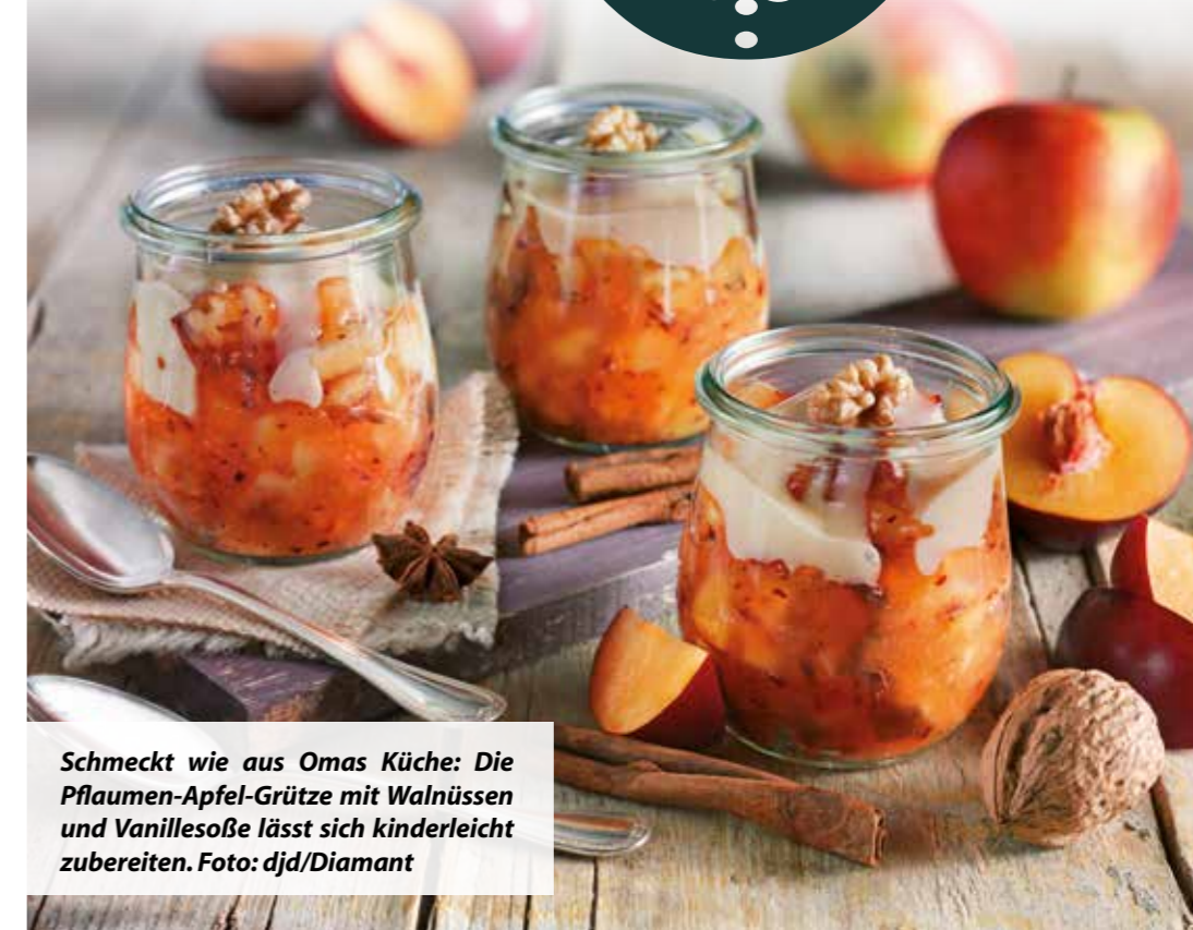
Schmeckt wie aus Omas Küche: Die Pflaumen-Apfel-Grütze mit Walnüssen und Vanillesoße lässt sich kinderleicht zubereiten.

Lecker, fruchtig und ganz einfach Jetzt zu den Früchten: 400 Gramm Pflaumen (entsteint gewogen) und 350 Gramm säuerliche Äpfel waschen. Pflaumen entsteinen, Äpfel nach Wunsch schälen, entkernen und beides in grobe Stücke schneiden. Davon 400 Gramm Obst abwie-