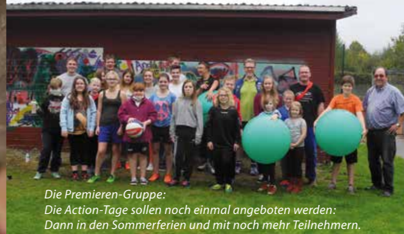
Die Premieren-Gruppe: Die Action-Tage sollen noch einmal angeboten werden: Dann in den Sommerferien und mit noch mehr Teilnehmern.

Die Idee war schnell geboren, die Umsetzung nicht ganz leicht: doch dann konnten die ersten Herzfelder Action-Tage an den Start gehen. „Für Jugendliche wird zu wenig geboten“, hatten vier aktive Lippetaler erkannt und das neue Angebot aus der Taufe gehoben. Schnell waren weitere Mitstreiter gefunden: unter anderem unterstützten heimische Banken, der SC Lippetal und Geschäftsleute die Premiere. 27 Jugendliche machten gerne mit. Auf sie wartete an zwei Tagen ein abwechslungsreiches Programm. Eine Wand (legal) mit Graffiti