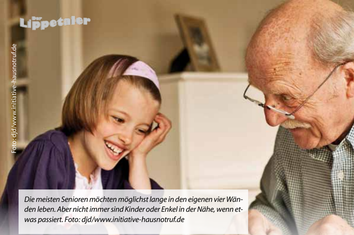
Die meisten Senioren möchten möglichst lange in den eigenen vier Wänden leben. Aber nicht immer sind Kinder oder Enkel in der Nähe, wenn etwas passiert.