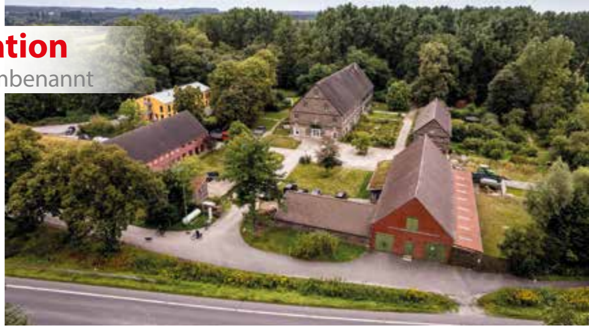
Die Ökostation mit dem gelben Gästehaus.