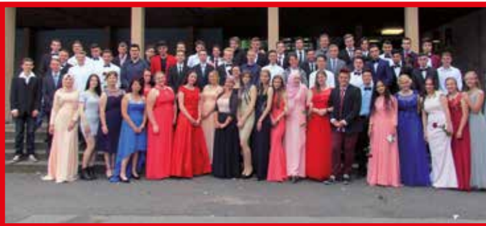
Ende Juni durften sich alle Zehntklässler der Realschule Oberaden über einen erfolgreichen Abschluss freuen. Dabei erhielt deutlich mehr als die Hälfte die Qualifikation zum Besuch der gymnasialen Oberstufe. Nach der offiziellen Zeugnisübergabe wurde bis in den späten Abend hinein harmonisch miteinander gefeiert, getanzt, gelacht und einige Erinnerungen ausgetauscht.