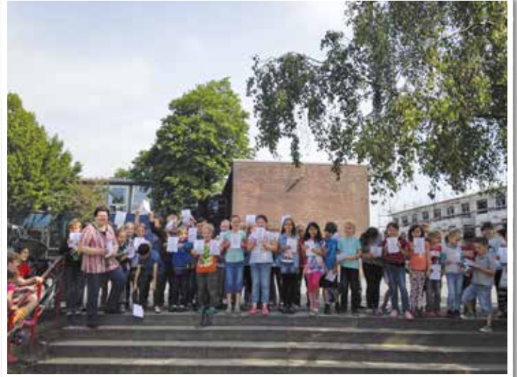
Ende Juni fand die Urkundenausgabe für alle Teilnehmer beim „Minikänguruwettbewerb“ statt.

und Zweitklässler, der sich am Wettbewerb „Känguru der Mathematik“ orientiert. Die Schüler müssen Textaufgaben bearbeiten, was aufgrund der Leseanforderung schon eine große Herausforderung für die Erstklässler ist.