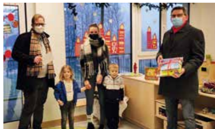
Die AWO-Kita Brausepulver freute sich über die neue Lektüre.

Alle vier Kindertagesstätten in Methler bekamen vom SPD Ortsverein Buchgeschenke.