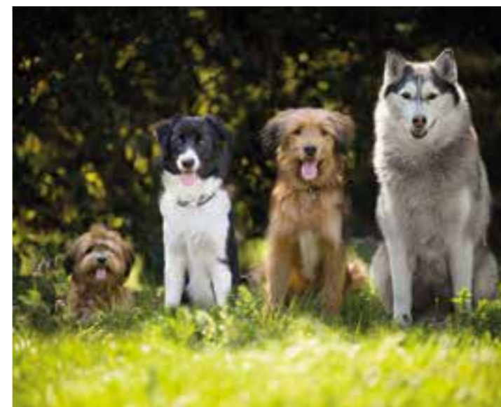
Auch Hundehalter erhalten in den kommenden Tagen Post.

Der Gutachterausschuss für Grundstückswerte im Kreis Unna ist beauftragt, einen qualifizierten Mietspiegel für die Stadt Kamen