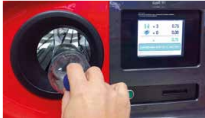
Seit Januar gelten einheitliche Regelungen für Kunststoffflaschen.

Gebrauchte Elektrogeräte wie der alte Rasierer oder das aussortierte Handy können seit dem Jahreswechsel beim Discounter oder im Supermarkt abgegeben werden, sofern die Ladenfläche größer als 800 Quadratmeter ist und in dem Geschäft mehrmals im Jahr Elektrogeräte verkauft werden. „Für Kleingeräte mit einer Länge von bis zu 25 Zentimetern hängt die Rücknahme nicht davon ab, ob die Kunden auch ein neues Gerät kaufen. Größere Geräte wie Fernseher oder Waschmaschinen müssen vom Händler jedoch nur angenommen werden, wenn der Kunde bei ihm ein