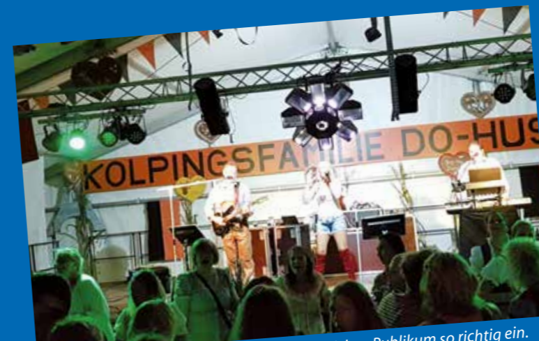
Beim Oktoberfest heißt die Band „Music-E“ dem Publikum so richtig ein.