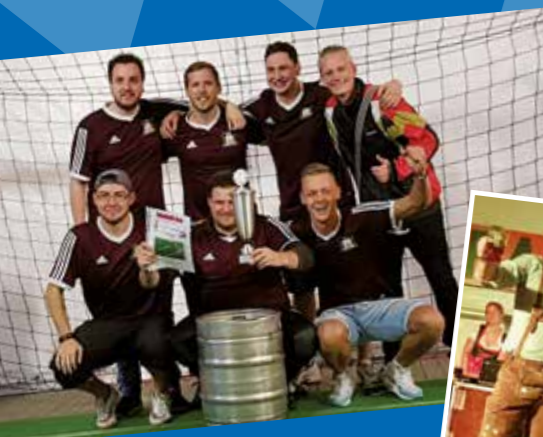
Das Siegerteam „SC Trinkfest“ vom 9-Meter-Schießen.