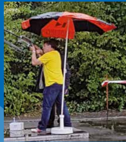
Der finale Schuss...