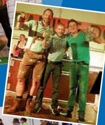
Finalisten im Maßkrugstemmen