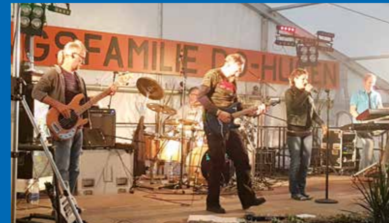
Die Coverband BIRDIE sorgte für eine ausgelassene Partystimmung.