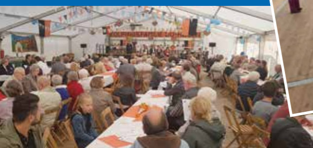
Zum Abschluss fand im Festzelt ein gemeinsamer ökumenischer Gottesdienst der katholischen Kirche St. Petrus Canisius und der evangelischen Kirche Husen statt.