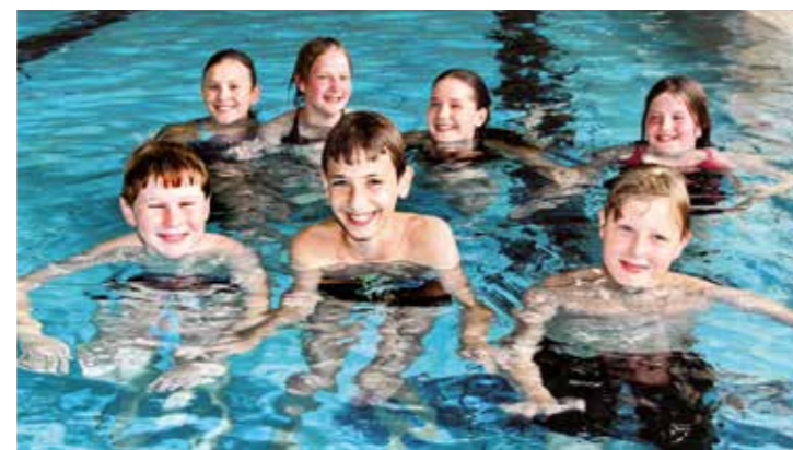
Kinder und Jugendliche der DLRG Ortsgruppe Kamen beim Training.