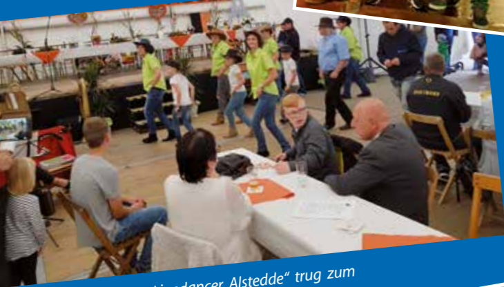
Der Auftritt der „Linedancer Alstedde“ trug zum guten Gelingen des Festes bei.