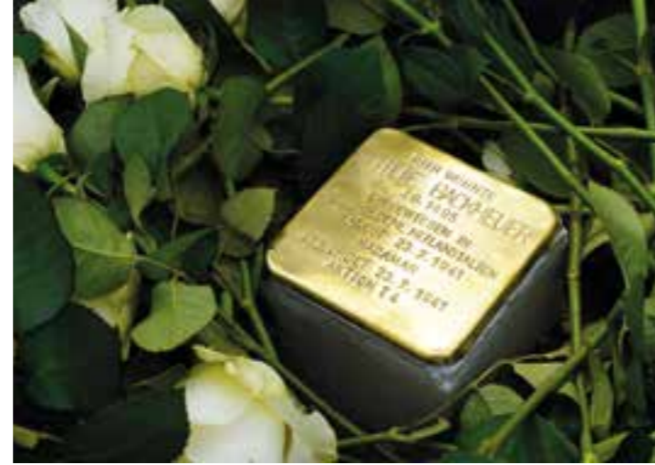
Weißer Rosen am Stolperstein für Otilie Backheuer vor ihrer ehemaligen Wohnanschrift an der Kleistraße 65 in Massen.