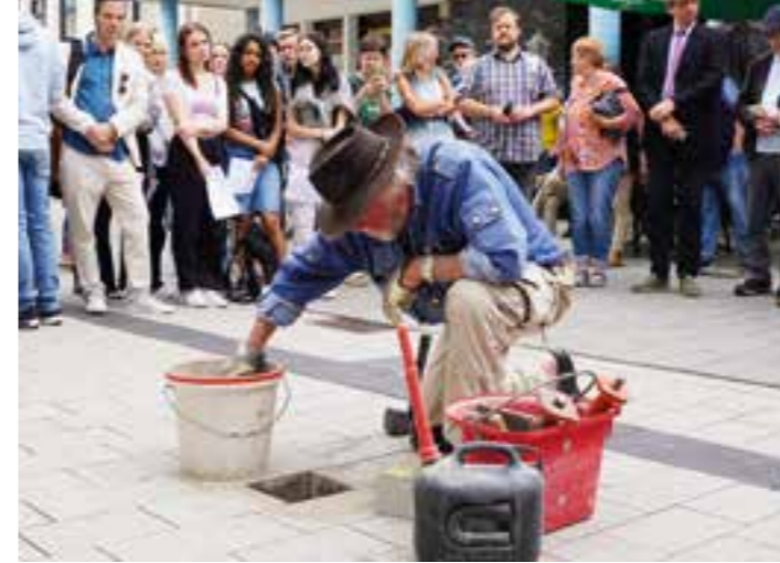
Künstler Gunter Demnig bei der Verlegung des Stolpersteins für Emma „Emmi“ Schrewe an der Massener Straße 27 in der heutigen Fußgängerzone.