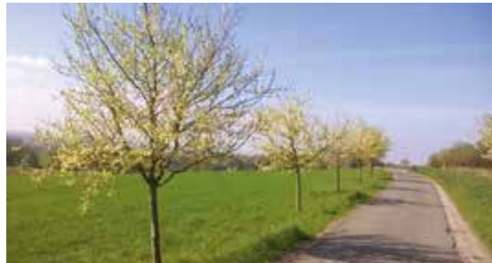
Das Ziel: blühende Obstbaumwiesen im Frühjahr.

Im Frühling verschönern Obstbäume die Landschaft im Kreis Unna mit ihren bunten Blüten.