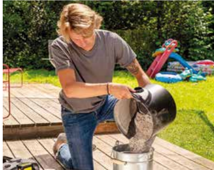
Der Auffangbehälter des Aschesaugers lässt sich einfach und weitgehend ohne Schmutzkontakt entleeren.

Um Fettverschmutzungen und Verkrustungen möglichst gering zu halten, sollte man darauf achten, dass Soßen und Marinaden gar nicht erst in den Grill tropfen. Mithilfe von wieder verwendbaren Grillschalen etwa lassen sich Fett und andere Flüssigkeiten auffangen. Profis empfehlen zudem, den Grill nach dem Gebrauch kräftig - am besten mit geschlossenem Deckel - aufzuheizen, damit Rückstände von Speisen auf dem Rost und im Inneren des Gerätes verglühen. Anschließend können die verkohlten Reste mit einer Drahtbürste leicht