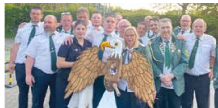
Der Schützenverein Massen 1830 e.V. feierte Anfang Juni sein Biwak.