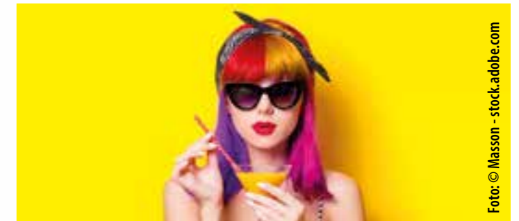
- Anzeige -