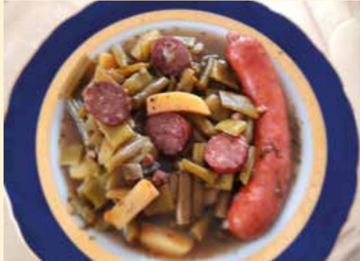
Westfälisches Blindhuhn nach traditioneller Art, ein Rezept von Gudrun Friese-Kracht (VHS-Kochdozentin).