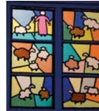
Grafiken: Ev. Kirchengemeinde Massen

Sonntag, 04.12. - 18:00 Uhr Neuapostolische Gemeinde Koppelweg 1