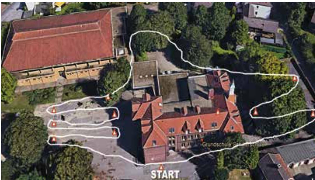
Die 400-Meter-Laufstrecke auf dem Schulgelände der Schillerschule.