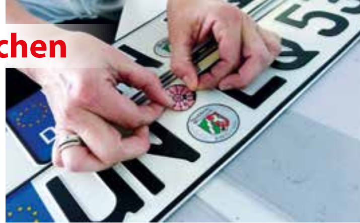
Kennzeichen als Kerngeschäft: In der Zulassungsstelle des Kreises Unna dreht sich alles um Auto, Motorrad, Lastwagen & Co.

Was im Straßenbild auffällt, kann die Zulassungsstelle der Straßenverkehrsbehörde nur bestätigen: Die Anzahl der Autos mit E-Kennzeichen wird immer größer. Seit Mitte 2015 können reine Elektrofahrzeuge, aber auch bei-