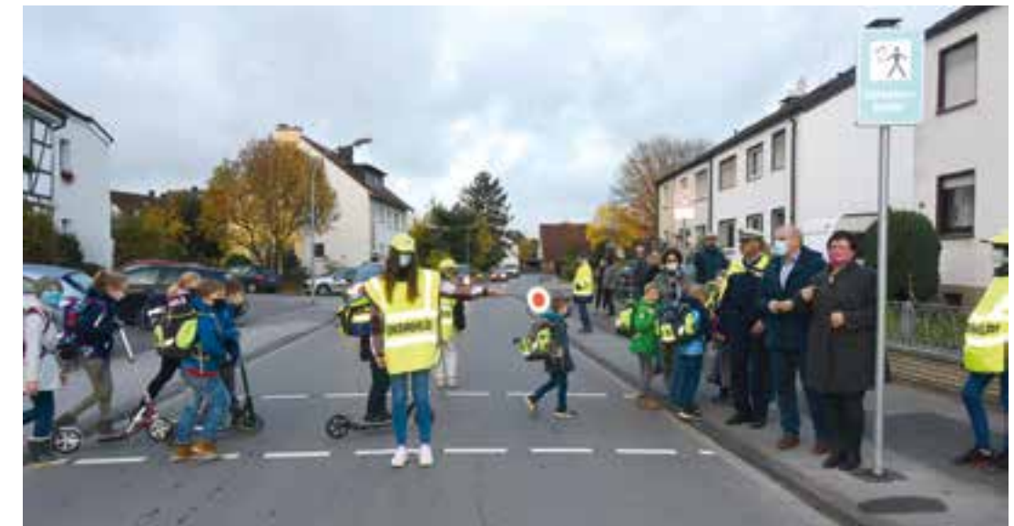
In Massen erhalten die Schülerinnen und Schüler der Schillerschule von den Schülern der Hellweg-Realschule Hilfe beim Überqueren der Straße. Damit soll eine größere Sicherheit auf dem Schulweg gewährleistet werden.