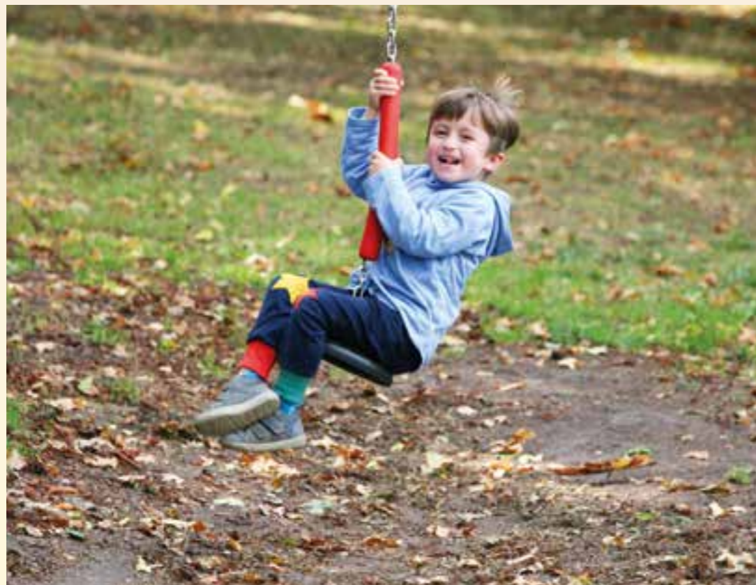
Massen Mitte bietet Kindern eine Menge Spielspaß – bald kommt noch ein neues Gerät dazu.

Der versteckt liegende Spielplatz am Massener Kirchweg ist nun endgültig Geschichte. Nachdem bereits vor einiger Zeit die dortige Schaukel abgebaut wurde, sind nun auch die letzten Spielgeräte verschwunden. Und werden weiterverwendet! „Das Kletternetz hat einen neuen Standort auf dem Spielturm Thomas-Mann-Straße gefunden“, teilt uns auf Nachfrage die Pressestelle der Stadt Unna mit. „Die Rutsche wurde ehrenamtlich abgebaut, wird aufbereitet und findet bei einer Kindereinrichtung ein neues Zuhause.“ Das Grundstück wird nun vorerst als Grünfläche angelegt. Als Ausblick für 2020 vermeldet die Stadt zudem, dass ein neues spannendes Spielgerät für die Fläche Massen Mitte am Radweg aufgebaut wird.