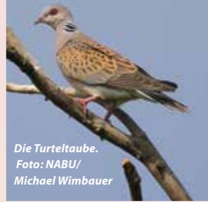
Die Turteltaube.

Fledermäuse fressen Insekten. Weil diese im Winter kaum zu finden sind, überwintert der Große Abendsegler in einem Winterquartier. Dies kann eine Baumhöhle sein,