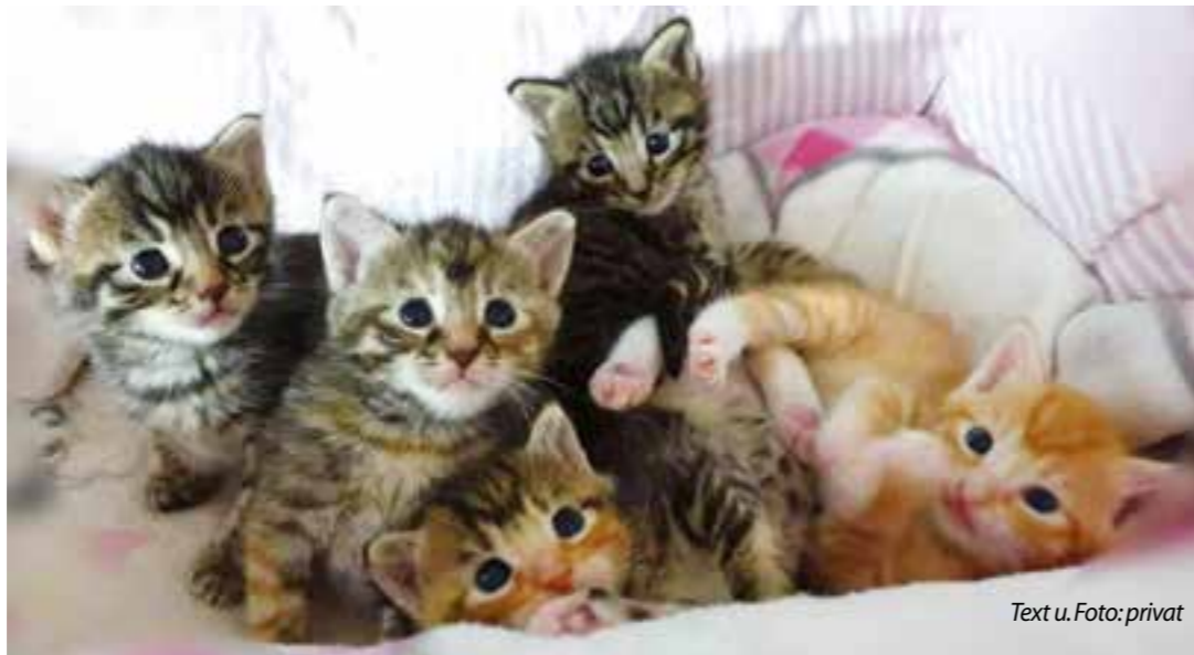
Text u. Foto: privat

Wir suchen Pöppel- und Pflegestellen im Kreis Unna und naher Umgebung.