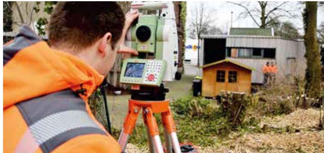
Ein Vermesser am Messgerät.

Voraussetzung: Studium Ein Studium der Fachrichtungen Vermessungswesen oder Geoin-