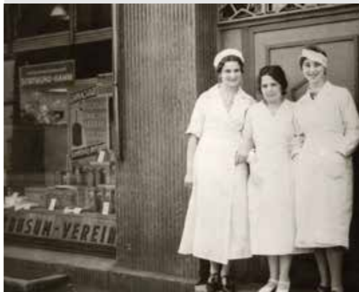
Das Team des ersten „Konsums“ an der Kleistraße.