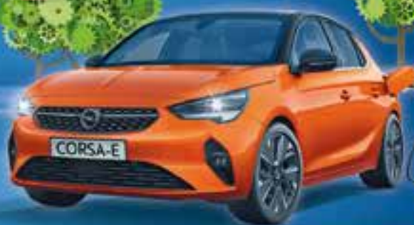
Abbildungen zeigen Sonderausstattung