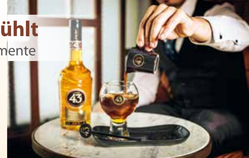
Für einen Espresso 43 gibt man einfach frischen Espresso auf eisgekühlten Likör.

Leckere Drinks für gemeinsame Momente in der kalten Jahreszeit