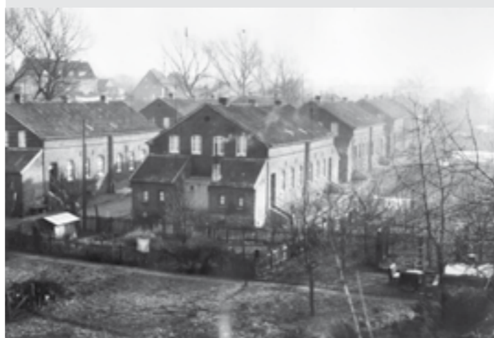
Alte Bergbausiedlung „Im Kamp“, 1967 abgerissen.

Auf dem Weihnachtsmarkt, im Café der AWO sowie in weiteren Massener Geschäften wird der Kalender pünktlich zum Nikolaustag am 6. Dezember für 6 Euro käuflich zu erwerben sein.