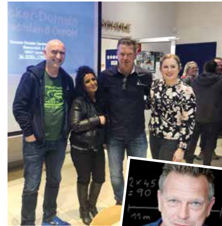
Wenn Fußball Schule macht: Mein Weg vom Fußballprofi zum Lehrer

Edel Books, 240 Seiten, 19,95 Euro ISBN: 978-3-8419-0554-3