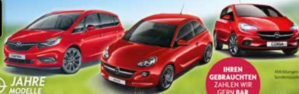
Abbildungen zeigen Sonderausstattung

IHREN GEBRAUCHTEN ZAHLEN WIR GERN BAR AUS!