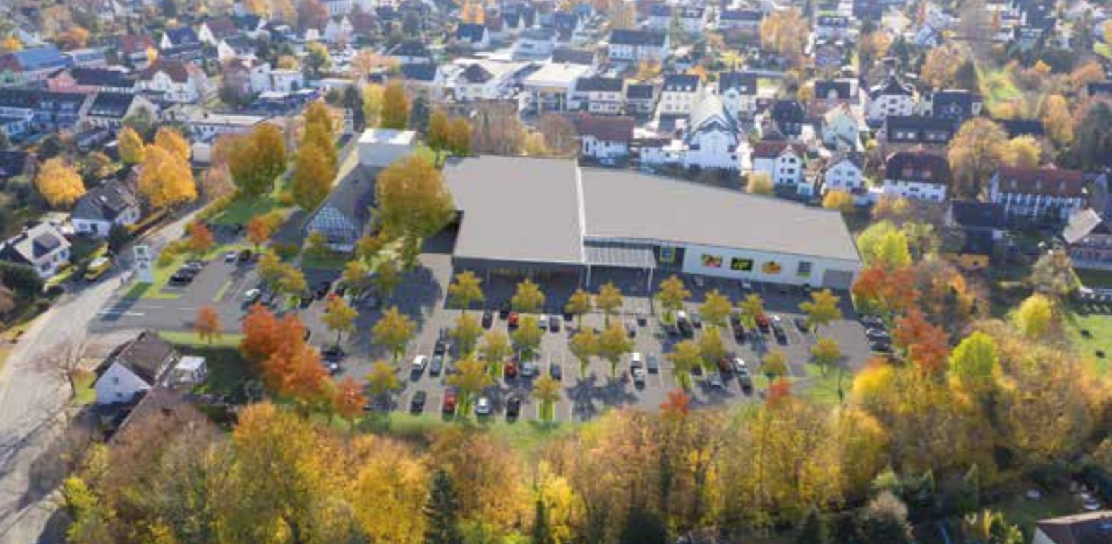
So soll das geplante Einkaufszentrum in Zukunft aussehen.