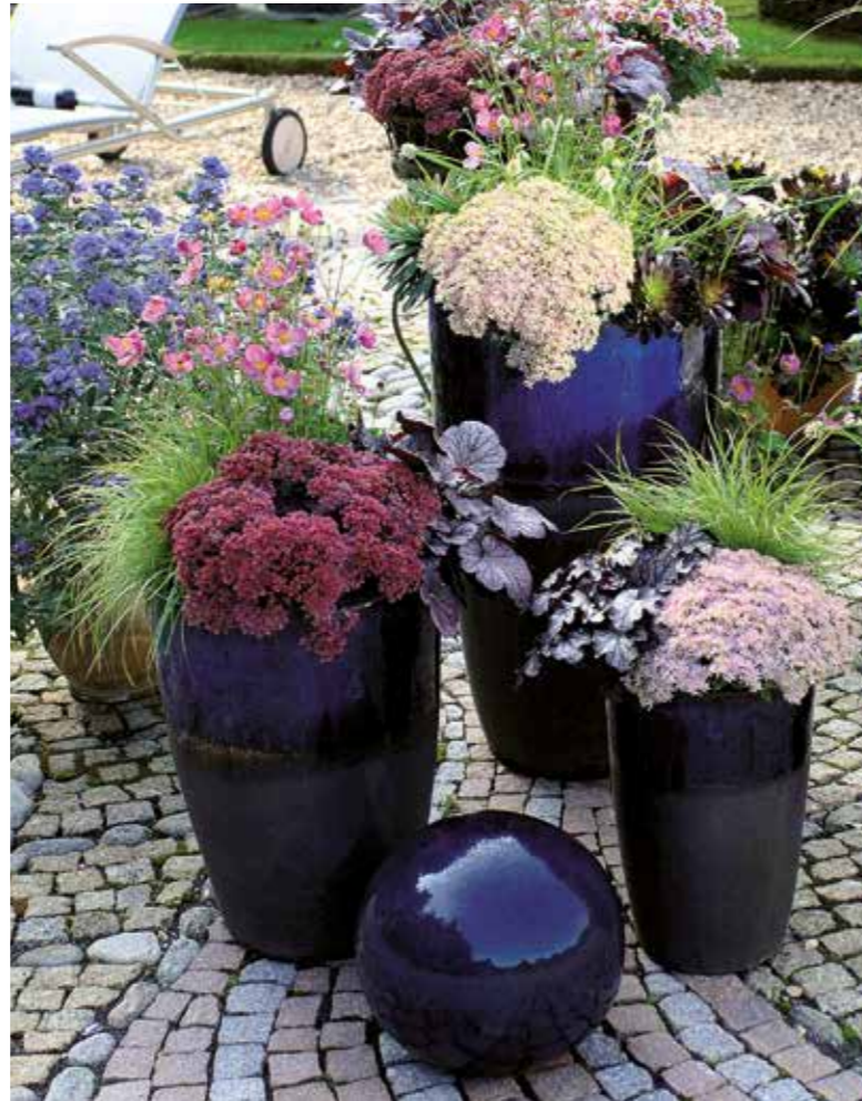
Kompakt und luftig, breitwachsend und aufstrebend, gesetzt und spritzig – diese herbstlichen Kübelbepflanzungen vereinen Harmonie und aufregende Kontraste Bild GMH.

serstars ziehen mit ihrem Selbstbewusstsein und ihrer Präsenz jeden in ihren Bann, doch sie haben es nicht nötig, sich gegenseitig die Show zu stehlen oder sich divenhaft zu gebärden. Sie ihrer eigenen Schönheit voll bewusst, unterstreichen sie die Vorzüge ihrer Pflanzpartner noch zusätzlich – wohl wissend, dass das Auge des Betrachters auch zu ihnen zurückkehren wird. Und zwar immer und immer wieder, denn die Herbstzauber-Pflanzen bleiben bis weit in den Winter hinein attraktiv – die einen, da sie ohnehin immer- oder wintergrün sind, die anderen, weil ihre Blütenstände auch im trockenen Zustand ausgesprochen anziehend wirken. Die Fetthenne ‚Herbstfreude‘ beispielsweise begeistert mit fleischig-sukkulenten Blättern und schirmförmigen Blütentellern, die ihre Farbe im Aufblühen vom zartem weiß-grün zu kräftigem Purpurrot ändern und bei Bienen sehr beliebt sind. Sie bringen auch nach der Blütezeit Struktur in die Pflanzung, weshalb sie erst im nächsten Frühjahr zurückgeschnitten werden. Purpurglöckchen (Heuchera-Hybriden) wiederum begeistern den ganzen Winter über mit ihrem attraktiven Laub, das in zahlreichen Farbvarianten von leuchtendem Bernstein bis zu glühendem Burgunderrot erhältlich ist. (GMH)