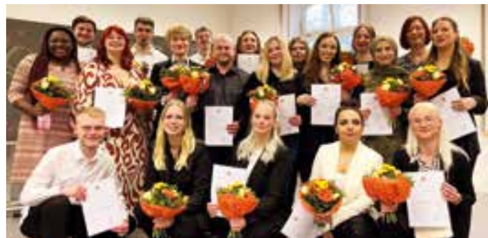
Die frisch gebackenen Pflegefachfrauen und -männer mit ihren Zeugnissen und Blumensträußen.

21 junge Frauen und Männer haben die Examensprüfungen bestanden und starten jetzt nach ihrer dreijährigen Ausbildung als Pflegefachfrauen und -männer ins Berufsleben.