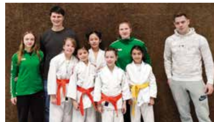
Die Judokas U11 weiblich vom JC Holzwickede.