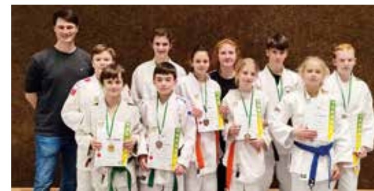
Die U15-Judokas sicherten sich die Teilnahme an den Westdeutschen Einzelmeisterschaften.

Anfang Februar stellten die Judokas des JC Holzwickede ihr Können bei den Bezirkseinzelsmeisterschaften in Kamen unter Beweis.