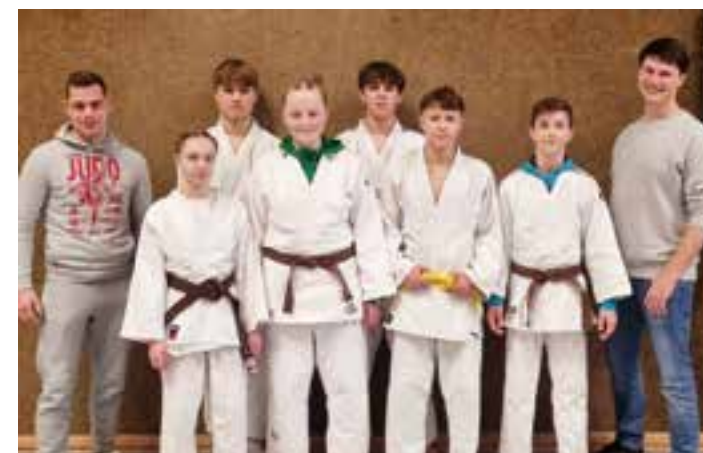
Der erste Kampftag stand ganz im Zeichen der U18 Kämpferinnen und -kämpfer.