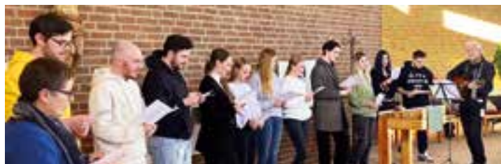
Die Auszubildenden, die die Gedenkfeier vorbereitet hatten, luden die Besucherinnen und Besucher zum Mitsingen ein.

Auszubildende und Seelsorge luden in die LWL-Klinik Dortmund ein