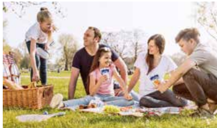
An sonnigen Sommertagen macht ein Picknick mit der Familie einfach Spaß.

Ob ein lauschiges Plätzchen im Park, am Strand oder auf einer kleinen Waldlichtung: Passende Locations für das Picknick gibt es viele. Allerdings sollte man darauf achten, ob der Platz eventuell als Naturschutzgebiet ausgewiesen und ob beispielsweise Grillen erlaubt