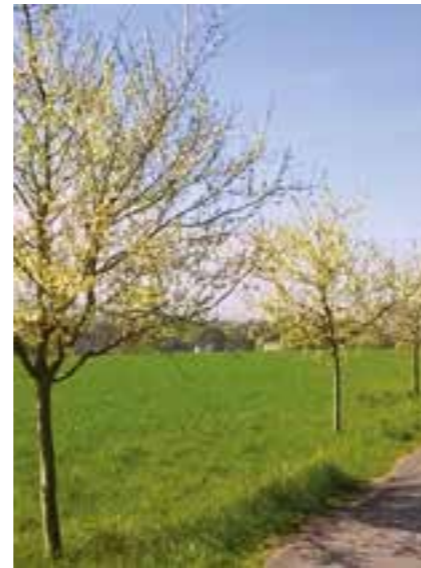
Das Ziel: blühende Obstbaumwiesen im Frühjahr.