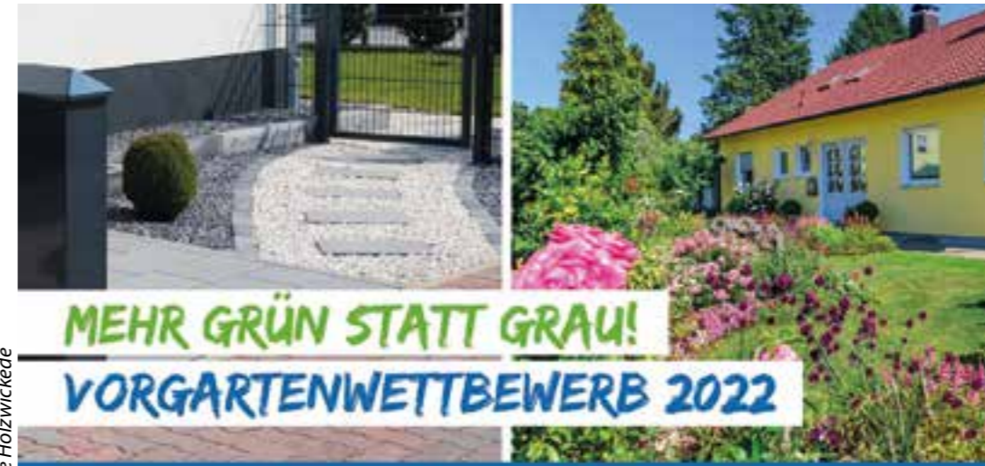
Plakat: Gemeinde Holzwickede

Vorgarten-Wettbewerb in Holzwickede ist gestartet