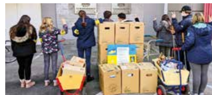
Mit Bollerwagen und U-Bahn brachten die Schüler:innen die Spenden zur zentralen Sammelstelle in den Westfalen-Hallen Dortmund.