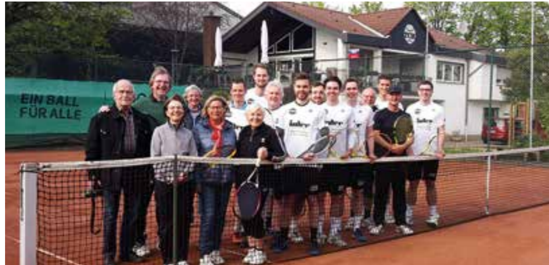
Gruppenfoto zur Eröffnung vor dem TCH-Clubhaus am Haarstrang.

Mixed-Turnier, Grillen, Tombola und gute Laune