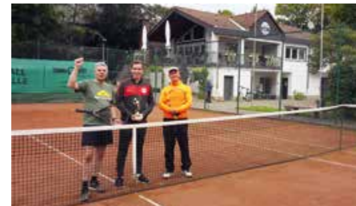
Blick auf das Clubhaus des TC Holzwickede mit Sportsbar und Terrasse.

Der TC Holzwickede hat sein Clubhaus kernsaniert.